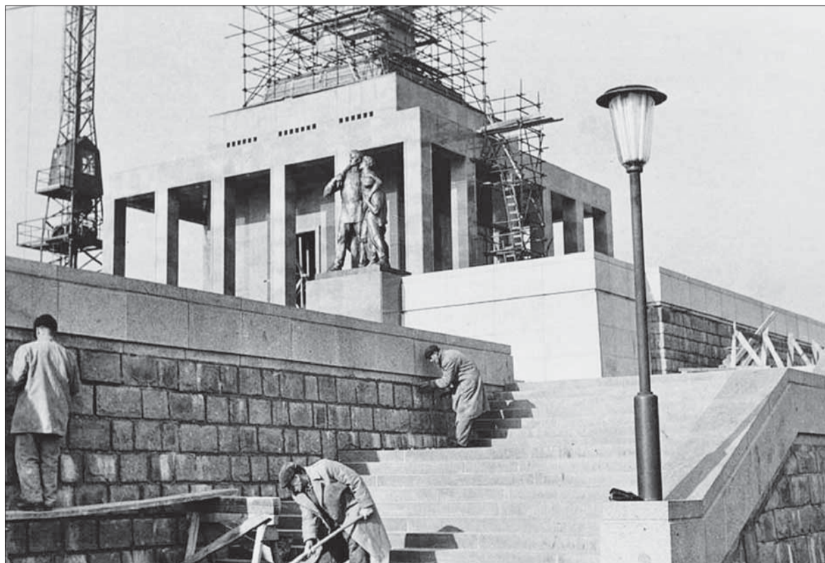
Dokončovacie práce na Slavíne začiatkom jari 1960.