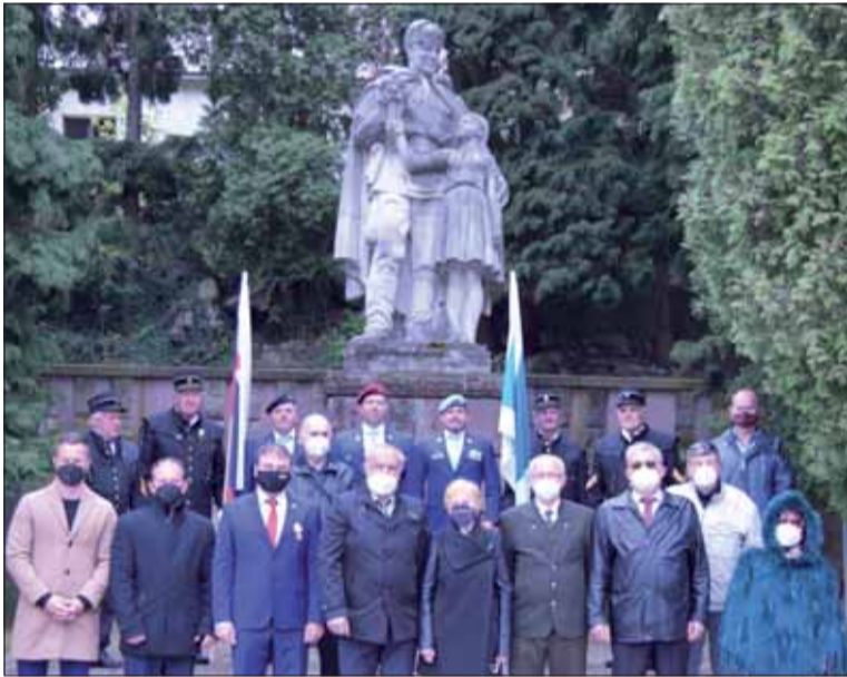
Účastníci oslavy v Banskej Štiavnici.