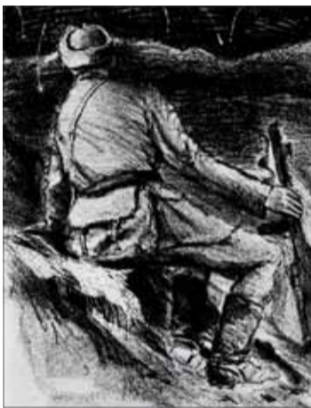
KD Na hliadke pri Dukle, litografia 1946.