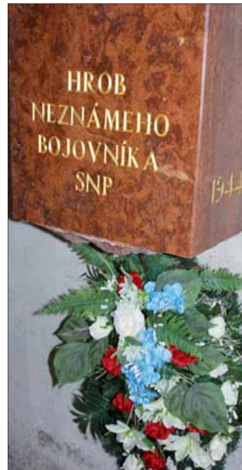
Pribudne aj hrob Múzea SNP?

Ministerka Milanová a (alebo) minister Nad' o zámeroch s Múzeom SNP celkom určite a dokázateľne klamú. A minister je taký netrepezlivý, že ani nie je schopný svoje odhodlanie zakryť. Ak sa udeje to, čo títo dvaja členovia vlády tajne upiekli, o likvidácii Múzea SNP nepochybujte. Nič iné totiž ich cieľom nie je.