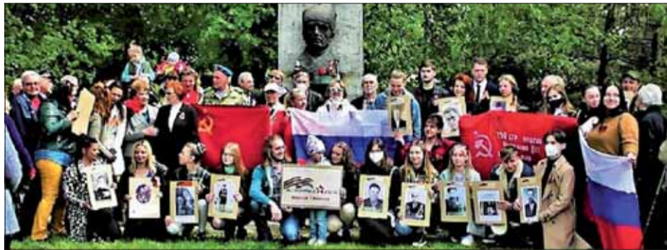
Oslavy Dňa víťazstva v Košiciach.

soko si ceníme ich počin a odsudzujeme nedôstojné protiruské a urážlivé vyhlásenia niektorých našich vrcholných predstaviteľov o tejto udalosti! Prítomní si mohli tento pre nás „svätý“ oheň preniesť do svojich domovov.