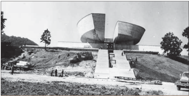
Takto vyzerala stavba hlavnej budovy Múzea SNP 15. 7. 1969.