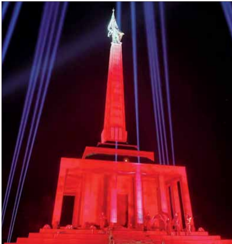
Slavín nadranom 9. mája.