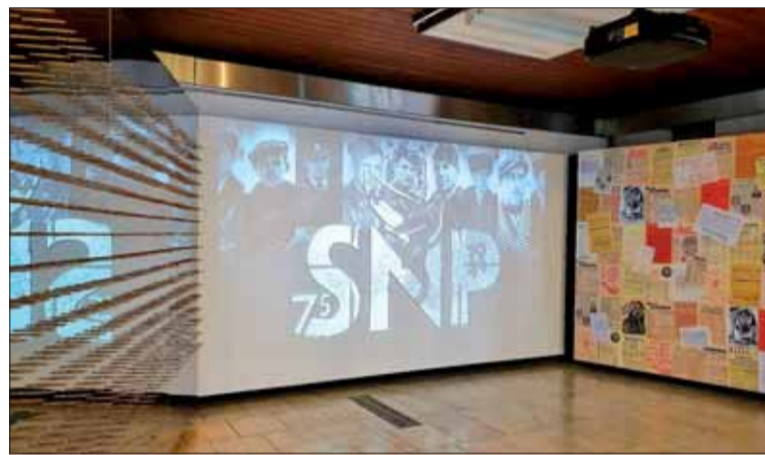
Medzi osobnosti Povstania patria mnohí civilisti .

Lenže o akých zdrojoch to minister tára? Vari má armáda