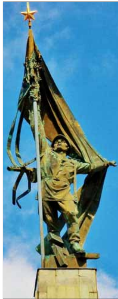
Socha sovietskeho vojaka vztyčujúceho vlajku od Alexandra Trizuljaka pred rekonštrukciou

Bratislavy ťahala Tatra 114. Pri Květennej, časti mestečka Strání, sa 21. februára 1960 transport pre poruchu motora zastavil.