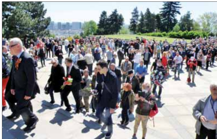
V nedeľu bol Slavín plný ľudí.

Napriek našej rade sa novinári v nedeľu neobjavili. Iba kamera- man z TA3 nakrútil pár záberov, keď sa dozvedeli, že na Slavíne