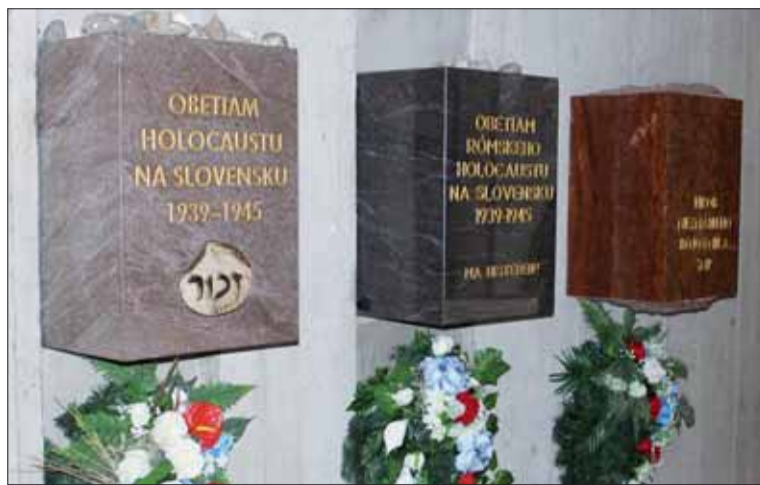
Múzeum SNP široko presahuje vojenskú históriu Povstania.