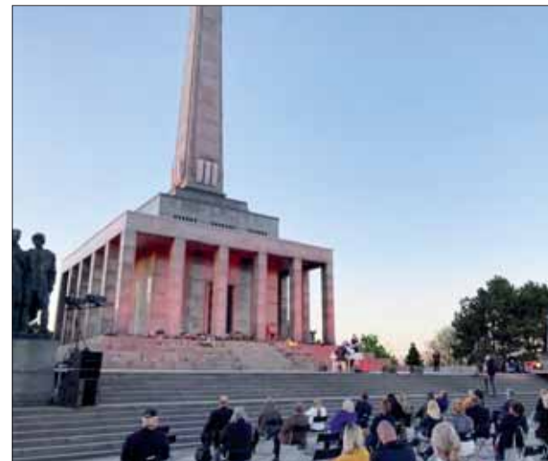
Nezvyčajný koncert na Slavíne.

upozornil, že akciu zorganizoval šéf Ruskej historickej spoločnosti, ktorým je aktuálny riaditeľ ruskej civilnej spravodajskej služby SVR Sergej Naryškin. Podľa ministra išlo o „zneužitie úcty k bojovníkom proti fašizmu na spravodajské hry“.