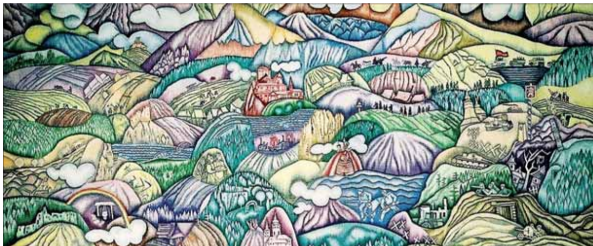
KD Cesta oslobodenia, gobelín 1980. – Výrez.