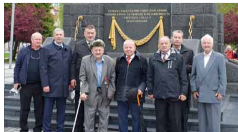
Účastníci pietneho aktu vo Zvolene.

Naš zväz je nositeľom odkazu druhej svetovej vojny, SNP, pokračovateľom priamych účastníkov odboja a v súčasnosti združuje antifašistické sily v SR. Len spolupracou a podporou štátnych elít s našim Zväzom budeme môcť účinne čeliť neofašizmu.