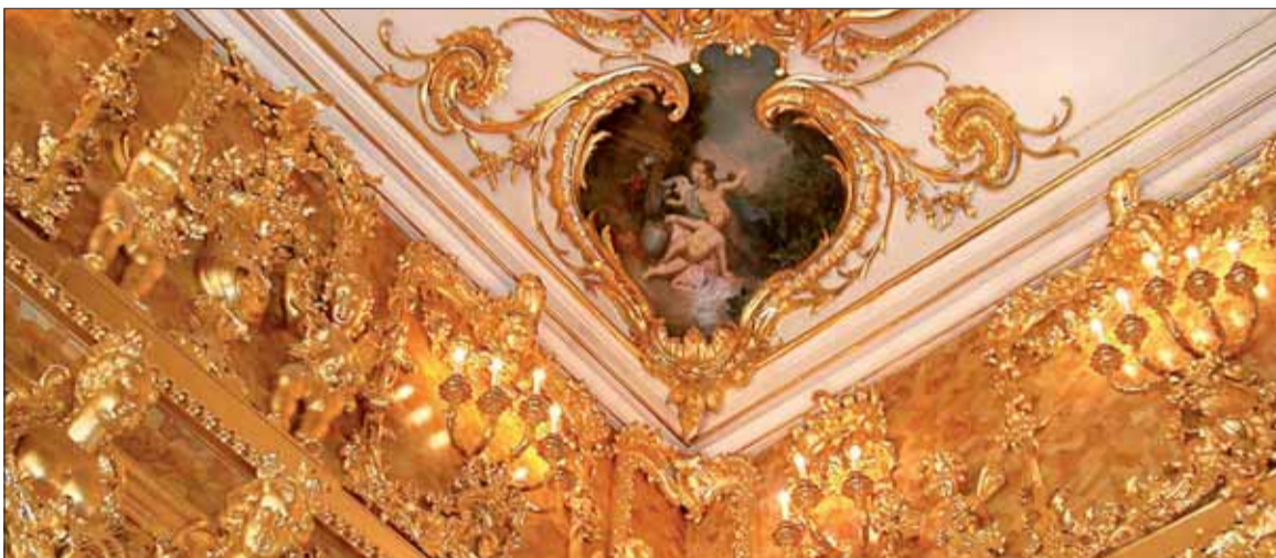
Nemci z Cárského sela vyviezli aj Jantárovú komnatu, ktorá sa dodnes nenašla. Toto je už len jej kópia.