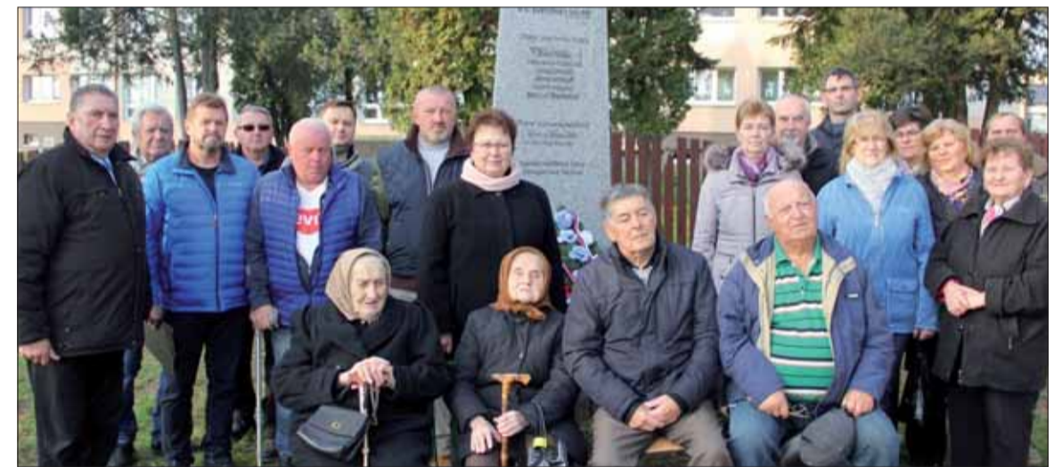
Rodinní príslušníci obetí vojny.

V týchto dňoch celá naša vlasť žije 75. výročím oslobodenia od fašizmu. Dňa 19. 12. 2019 sa uskutočnil pietny akt aj v obci Zemplínska Teplica. Zúčastnili sa ho občania, mládež, poslanci obecného zastupiteľstva a vzácní hostia – pozostali po obetách 2. svetovej vojny. So slzami v očiach spomínali na krušné chvíle, ktoré preživali počas zimy v roku 1944.