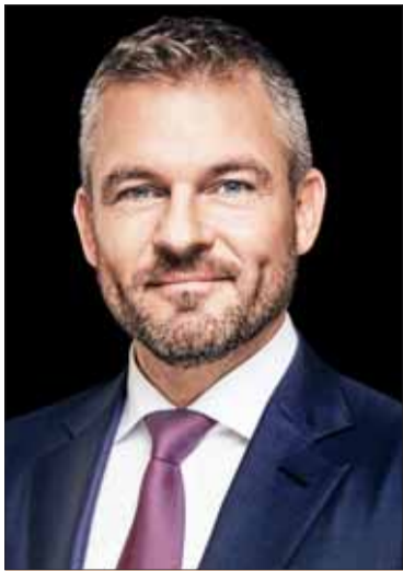
Predseda vlády SR P. Pellegrini

čo sme verejne činní, celá demokratická verejnosť stojí pred zásadnou úlohou. Potvrdiť dôveru k štátu, k jeho inštitúciám! Toto vnímam ako prevenciu voči tomu, aby tu na emočnej vlne nevyrástli nenávistné hnutia a novodobí extrémistickí vodcovia. Tu máme zodpovednosť všetci. Tak koalícia, ako aj opozícia.