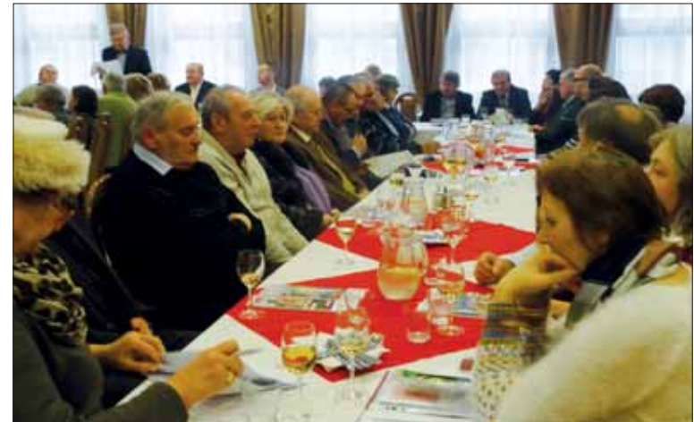
EO