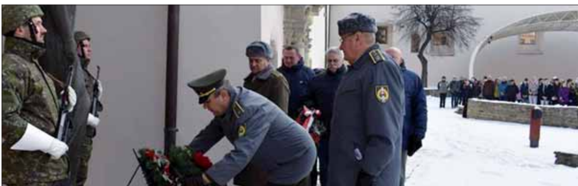
ZO SZPB Kežmarok, MsÚ Kežmarok, OU Kežmarok, Klub vojakov SR Kežmarok, delegácia vojakov v zálohe z družobného mesta Bochnia a žiaci základnej školy si 28. januára pietnou spomienkou pri pamätníku padlých partizánov pripomenuli 74. výročie oslobodenia mesta. ZO SZPB Kežmarok