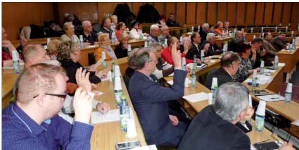
Hlasovanie trebišovských delegátov.