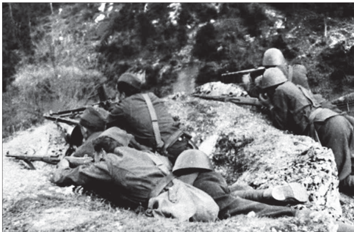
Ilustrácia z povstaleckého bojiska.