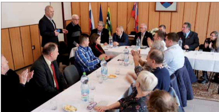
Ak by nemali školské povinnosti, boli by sa tohto stretnutia zúčastnili aj žiaci ZŠ zo Stredy nad Bodrogom..., čiže toto založenie KMP by bolo ešte veľkolepejšie.