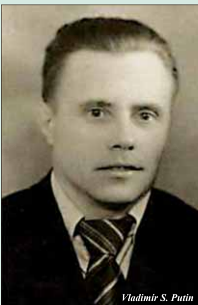
Vladimír S. Putin

Úryvky z knihy „SPOMÍNAŤ A NEZABUDNÚŤ, SNP a druhá svetová vojna v spomienkach štyroch generácií“