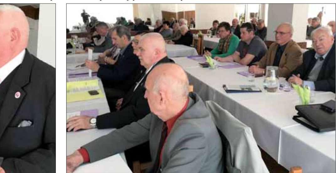
Lučenec – pohľad na delegátov.