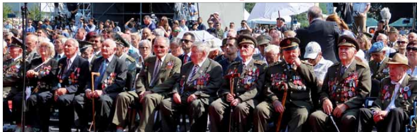
Uvedomujú si naši poslanci EP, že idú aj proti slovenským protifašistickým bojovníkom, ktorí za porážku hitlerizmu a aj jeho nasledovníkov prelievali vlastnú krv? (Snímka je z osláv 75. výročia SNP v B. Bystrici)

Normálne sa za slovami „nepriateľ ľudstva“ dá vidieť Satan. Nositeľ Nobelovej ceny Thomas Mann povedal, že nemecký nacizmus je „nepriateľom ľudstva“ a že práve preto sa na tomto základe treba spájať s komunizmom!