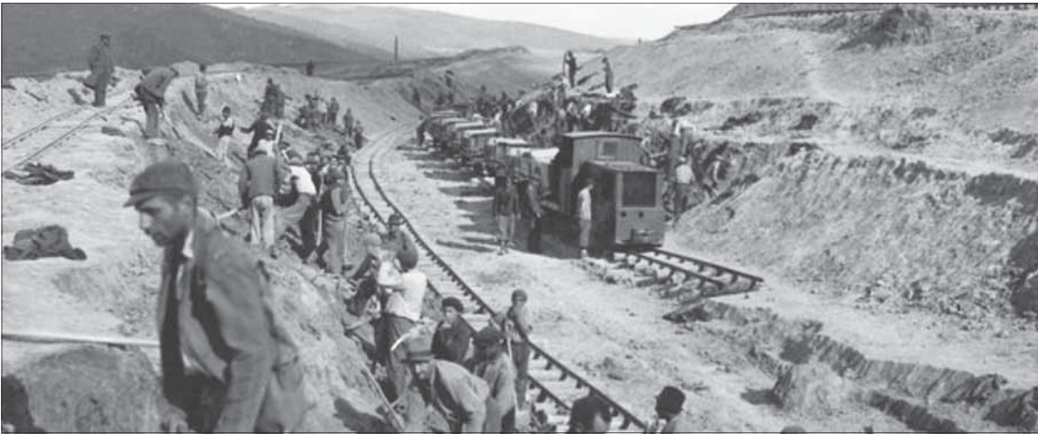
Rómovia z pracovného útvaru so sídlom v Hanušovciach nad Topľou.

Rómovia v táboroch pracovali v ťažkých podmienkach až 11 hodín denne, často bez akýchkoľvek pracovných nástrojov. Rómovia sa stali lacnou pracovnou silou. – r –