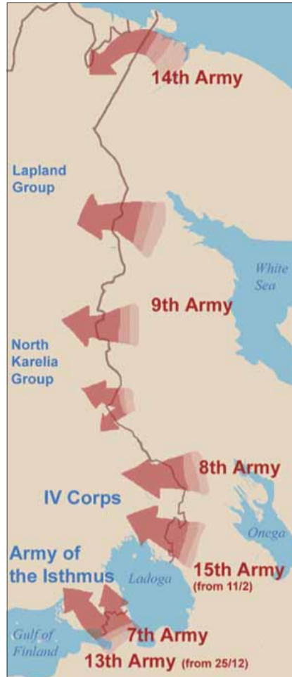
Hranica s Fínskom po Moskovskom mieri.

Bojovník čitateľom odporúča čítať tento článok so zapojením kritického myslenia. Osobitne v tom, že do októbrovej revolúcie v cárskom Rusku bolo Fínsko jeho súčasťou a tak úprava vzájomnej hranice po odčlenení Fínska nebola príliš jednoznačná.