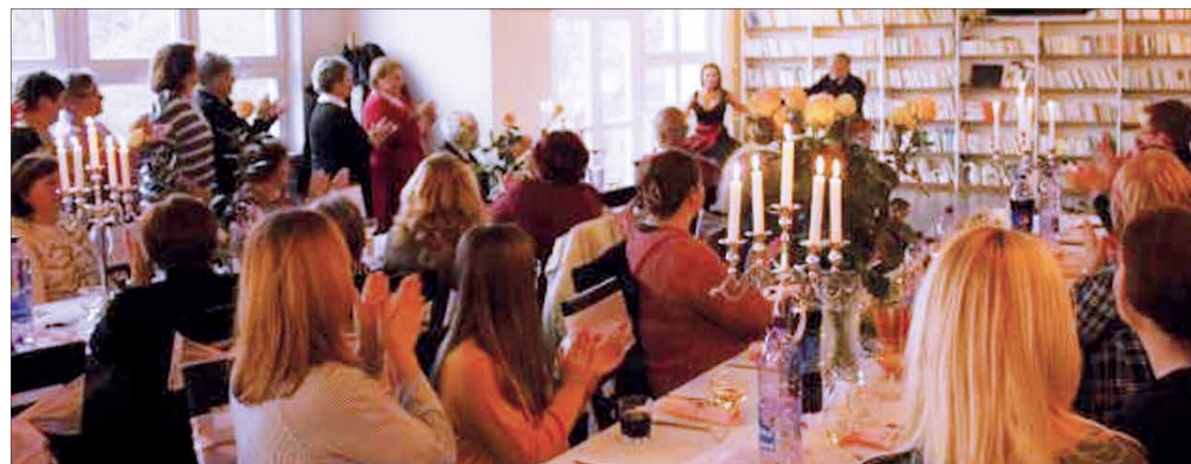
Atmosféru pri príležitosti MDŽ v ZO SZPB v Hornej Mičinej umocnil tanečný pár zo Španielska.