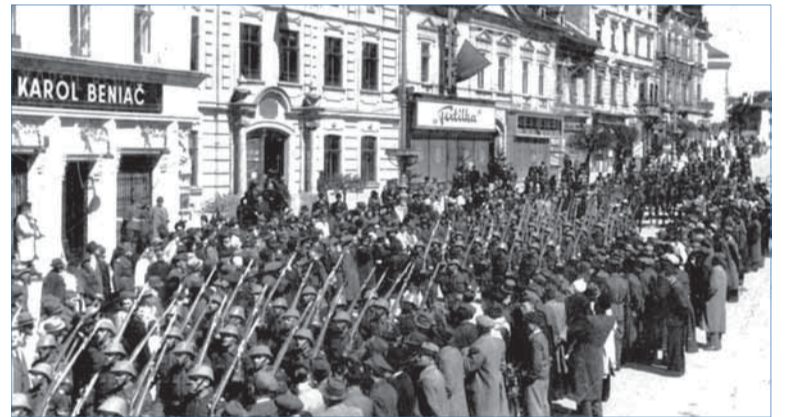
Rumunskí vojaci v oslobodenej Banskej Bystrici.

obce Buzica, nachádzajúcej sa juhozápadne od Veľkej Idy, dnes patriacej do okresu Košice okolie. Tento pluk bol súčasťou 4. rumunskej armády, pôsobiacej v podriadenosti velenia sovietskej 40. armády. Ďalšie zoskupenie rumunských vojsk prekročilo hranice Slovenska v priestore južne od Lučenca, na čiare Trenč a Kalonda, 26. decembra 1944. Boli nim zväzky rumunského 4. armádneho zboru rumunskej 1. armády, ktorý bol v tom čase podriadený veliteľstvu sovietskej 27. armády. V polovici januára 1945 sa k rumunskej 1. armáde vrátil jej 7. armádny zbor, dovtedy