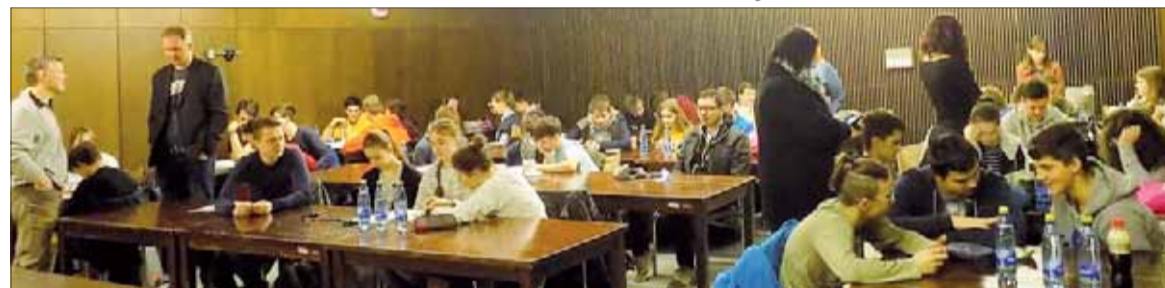
Pohľad na základné kolo „Medzníkov...“ z apríla minulého roka v Trenčíne.