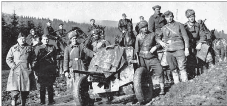
Príslušníci 1. čs. samostatnej brigády počas presunu cez Javorníky.

6. októbra 1944 v priestore Duklianskeho priesmyku, v zostave vojsk 38. armády 1. ukrajinského frontu, definitívne vstúpili na územie Slovenska jednotky 1. čs. armádneho zboru. Do konca Karpatko-duklianskej operácie (8. 9.–28. 10. 1944) potom postúpili k severnému okraju Nižného Komárniku a ku Korejovciam. Po ďalších bojoch v priestore Obšaru a okolitých výšin južne od Duklianskeho priesmyku v priebehu Východoslovenskej operácie (20. 11.–15. 12. 1944) postúpili v zostave vojsk 1. gardovej armády k rieke Ondave. Po jej dosiahnutí prešli do obrany v pásme, ktoré na začiatku januára 1942 prebiehalo od Breznice až po poľskú obec Ciechania.