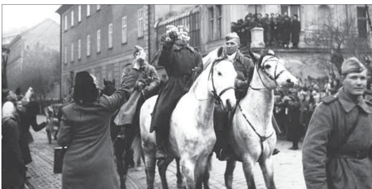
Presun sovietskej delostreleckej jednotky cez oslobodenú Bratislavu.