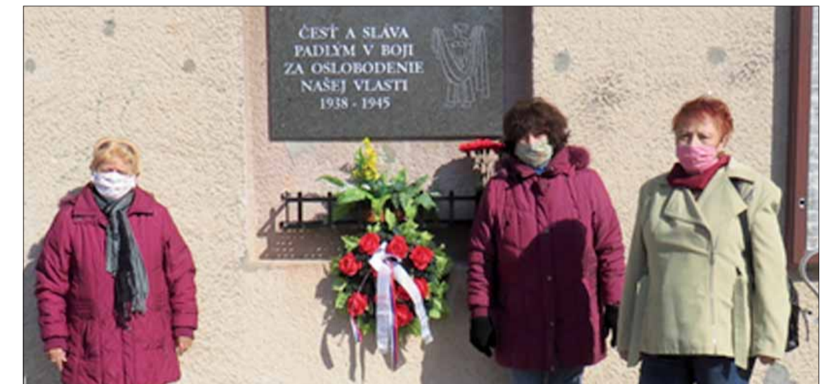
Aj tento rok sme si 2. apríla pripomenuli oslobodenie obce Bernolákovo. Úprimnú vďaka osloboditeľom vyjadrili členky našej ZO SZPB položením vencu i kytičky karafiátov k pamätnej doske.