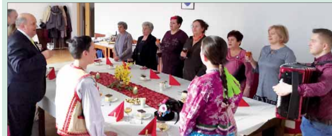
Dvoch mladých z klubu so svojim vedúcim sme privítali aj na posedení pri príležitosti MDŽ. A spoločne sme si zaspievali.