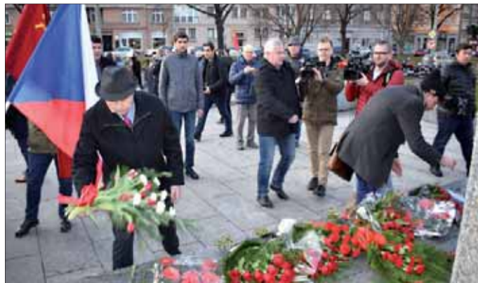
Kvety sú nefalšovaným dôkazom, že si pamätáme svoje dejiny!