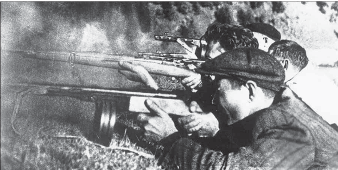
Boj v SNP bol aj bojom proti slovanskému holokaustu.