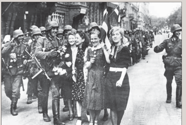
Riga, 7. júl 1941.