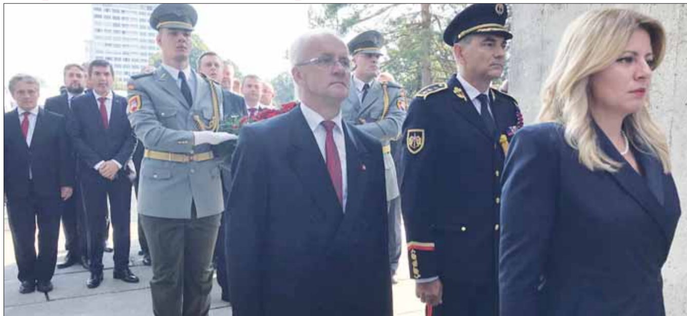
Prezidentka SR Zuzana Čaputová položila veniec vďaka na oslavách 75. výročia SNP v Banskej Bystrici.

Valné zhromaždenie OSN v rezolúcii 59/26 z 22. novembra 2004 vyhlásilo 8. a 9. máj za Dni spomienok a zmierenia na počesť všetkých, čo zomreli v čase 2. sv. vojny. V SR si Deň víťazstva nad fašizmom pripomíname 8. mája. V bývalom Sovietskom zväze, v Izraeli... i v terajšej Ruskej federácii tento sviatok oslavujú 9. mája.