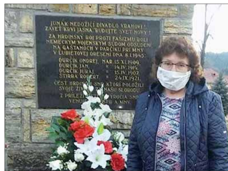
Základná organizácia SZPB v Lubietovej si v marci pripomína oslobodenie obce.

Pietneho aktu kladenia vencov a spomienkového stretnutia sa každoročne zúčastňujú členovia ZO SZPB, spoluobčania a žiaci miestnej základnej školy. Stretnutie potom pokračuje slávnostnou členskou schôdzou.