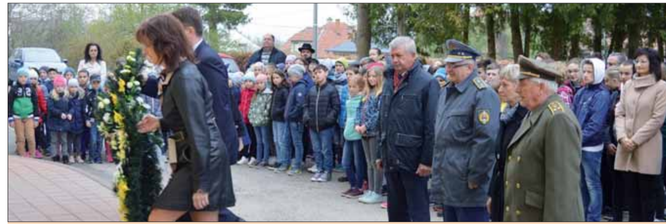
Takto to u nás vyzeralo kým nebačoval koronavírus.