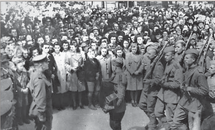
Vitazný nástup vojakov oslobodzovacích armád v kúpeľnom parku.