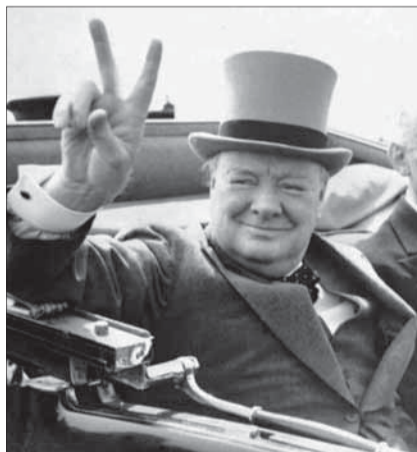
Čo sa dá v anglickej politike ostatných čias považovať za skutočnú „Victory“?