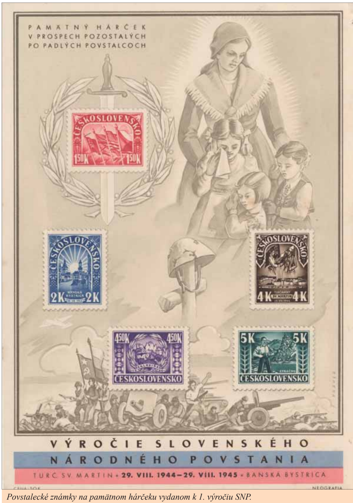
Povstalecké známky na pamätnom hárečku vydanom k 1. výročiu SNP.