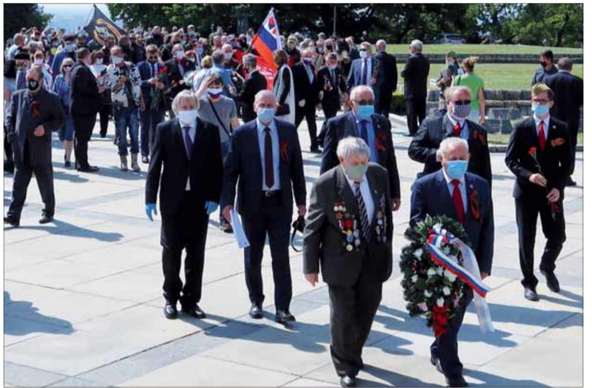
Každoročne 9. mája sa na Slavíne stretávajú tí, ktorým je cudzia slovná ekvilibristika falošných a nečestných politikov. Aj tohto roku sem prišli tí, ktorí vedia, že oslobodzovali a aj tí, ktorí vedia, že práve oni ich oslobodili.

Branislav Fábry, pravda.sk, 11. 5. 2020 (krátené)