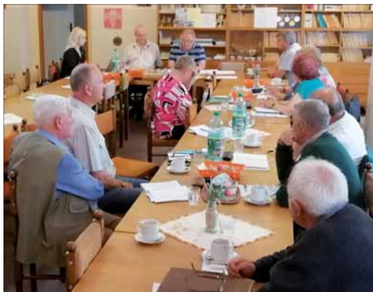
Činnosť oblastných a základných organizácií SZPB sa rozbieha. Dôkazom je aj pohľad na rokovanie oblastného výboru v Novom Meste nad Váhom.

Respekt.cz, 16. 6. 2020 (výňatky)