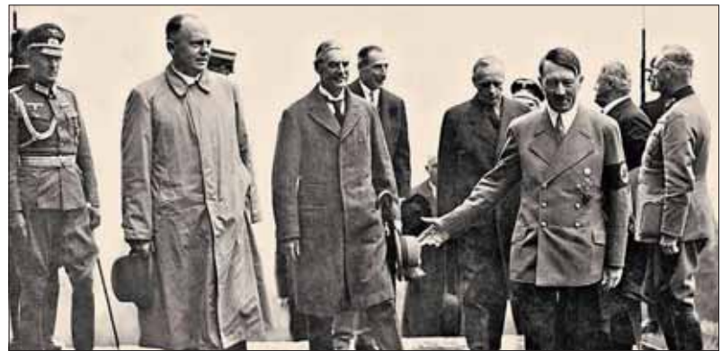
Adolf Hitler s Nevillom Chamberlainom počas jeho návštevy v Mníchove v septembri 1938.

V Poľsku si uvedomovali, že bez Hitlerovej podpory by ich agresívne plány boli odsúdené na neúspech. Tu zaciťujem záznam rozhovoru medzi nemeckým veľvyslancom vo Varšave, G. A. Moltkem a J. Beckom z 1. októbra 1938 o poľskom a českých (mysliac zrejme československých – pozn. Bojovník) vzťahoch a pozícii ZSSR v tejto otázke. Uvádza sa v ňom: „...pán Beck... vyjadrujem veľkú vďaka za lojálnu interpretáciu poľských záujmov na Mníchovskej konferencii, ako aj za úprimné vzťahy počas českého (opäť asi mysliac československého) konfliktu. Vláda a verejnosť