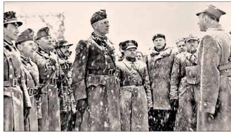
Obnovenie spoločnej hranice Maďarska s Poľskom. 16. marca 1939 sa pozdravujú maďarskí a poľskí dôstojníci.

Nevieme tiež, či existovali nejaké „tajné protokoly“ a prílohy k dohodám mnohých krajín s nacistami. Zostáva nám iba slepo „veriť na slovo“. Materiály o tajných anglo-nemeckých rokovaníach zatiaľ neboli odtajnené. Preto vyzývame všetkých štáty, aby zaktivizovali proces otvárania svojich archívov, zverejňovania predtým neznámych dokumentov predvojnového a vojnového obdobia, ako to v ostatných rokoch urobilo Rusko. Sme pripravení na širokú spoluprácu, na spoločné výskumné projekty historikov.