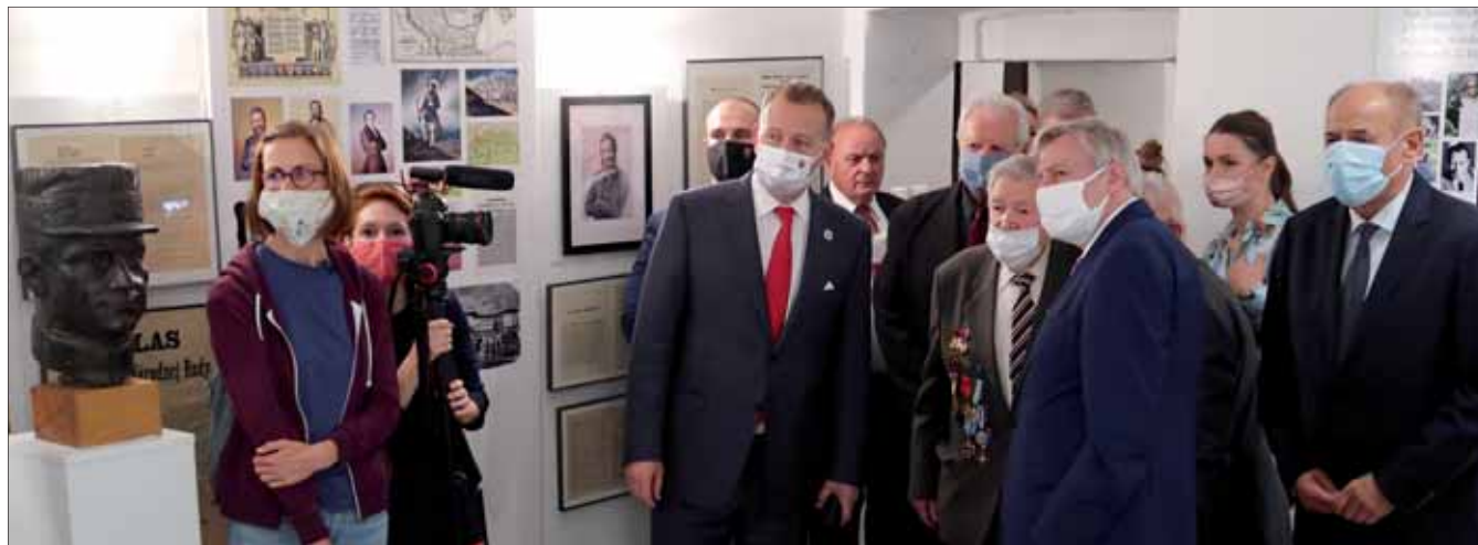
V muzeálnej expozícii SZPB „Za slobodu“.

...v mediálnom priestore sa rozpútala búrka. Bolo ním slovo „čestný“, ktoré použili tlačoví pracovníci predsedu NR SR Borisa Kollára, keď informovali TASR o jeho návšteve v sídle SZPB a o jeho prijatí za člena SZPB.