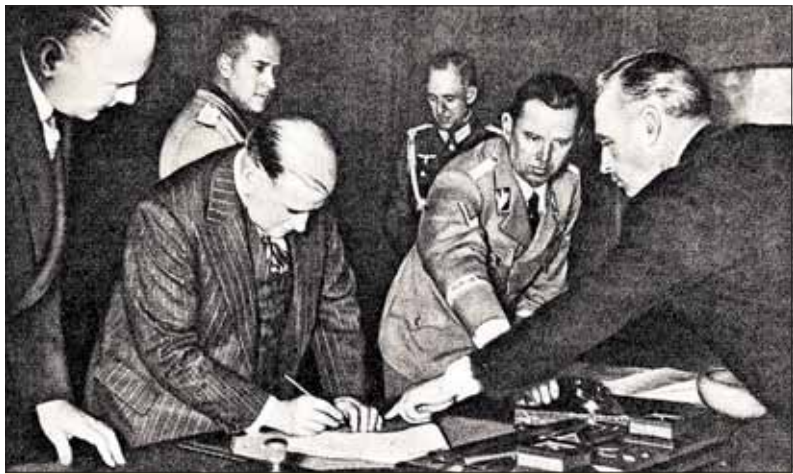
Ribbentrop ukazuje Daladierovi kam sa má podpísať.

[Poľska] plne vzdávajú hold pozícii Führera a ríšskeho kancelára.“