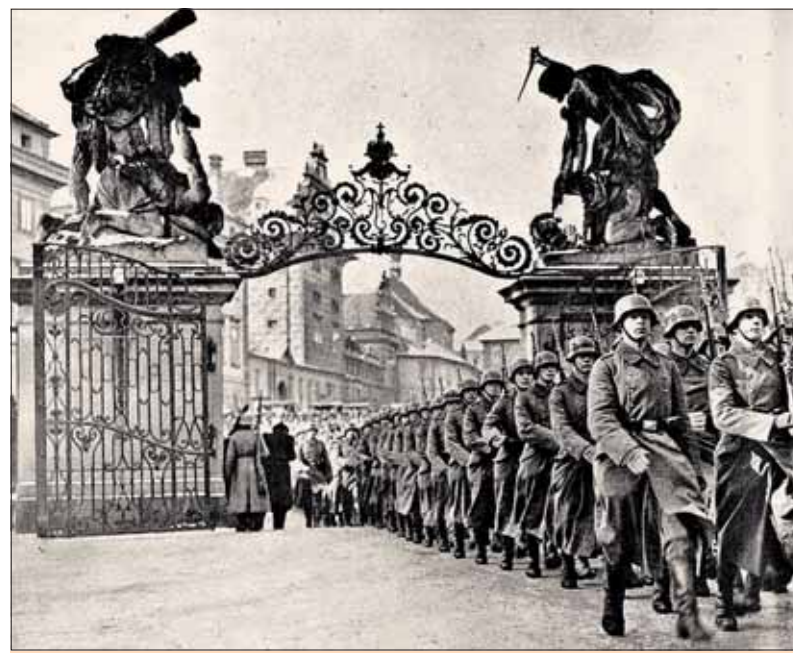
Nemecké vojská vstupujú na Pražský hrad.

Bolo by naivné veriť, že po zroku proti Československu by