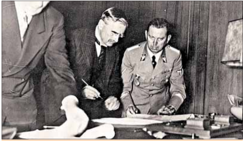
Chamberlain podpisuje Mníchovskú dohodu.