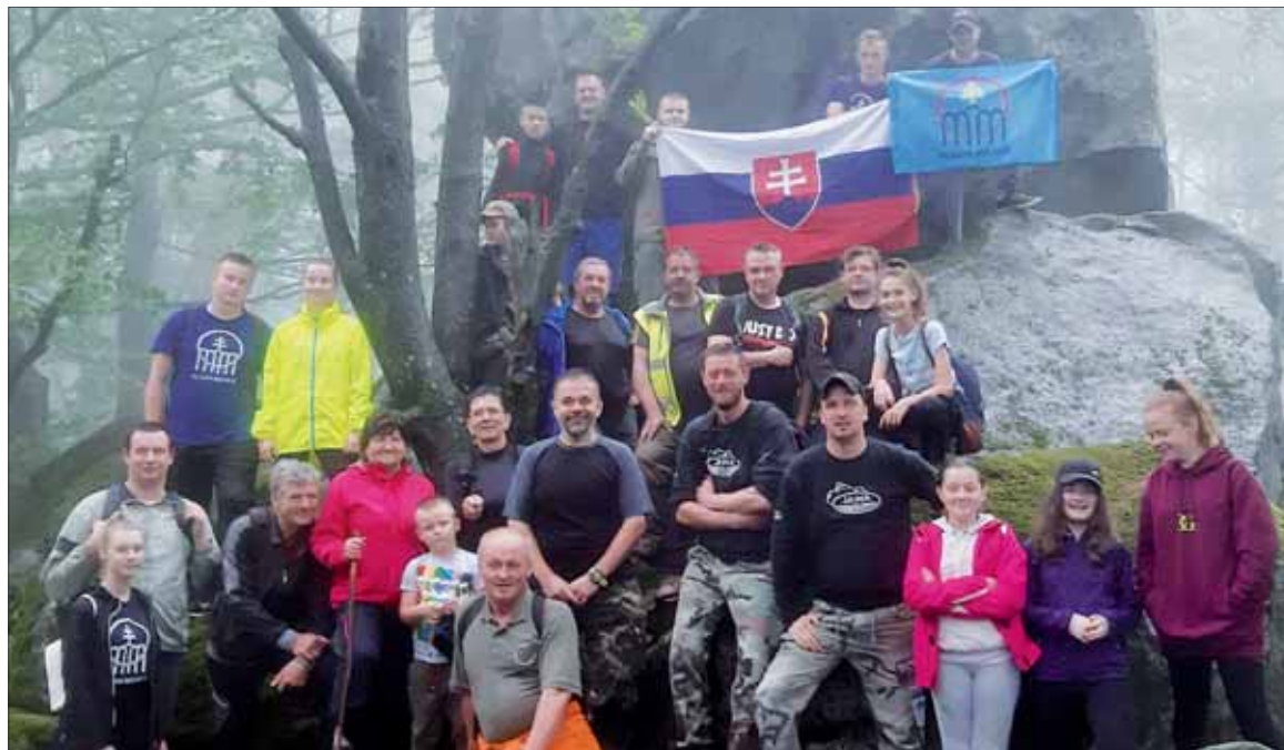
Pod vrcholom Oblíka.

na základná organizácia SZPB v Petrovciach za spolupráce Oblastného výboru SZPB Vranov n/Topľou a obecného úradu v Petrovciach. Akciu finančne podporila obec Petrovce. –MP– (Pre Bojovník bez nároku na honorár)