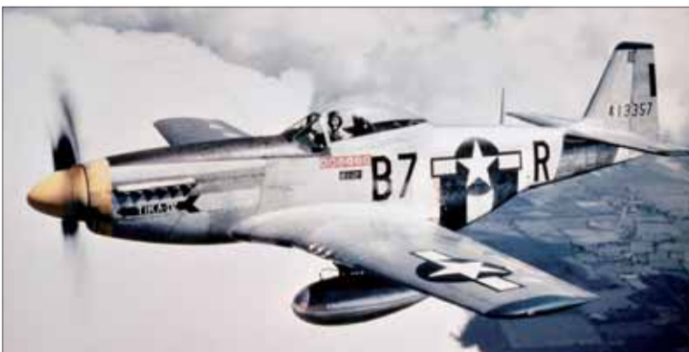
Vojnový Mustang P-51.