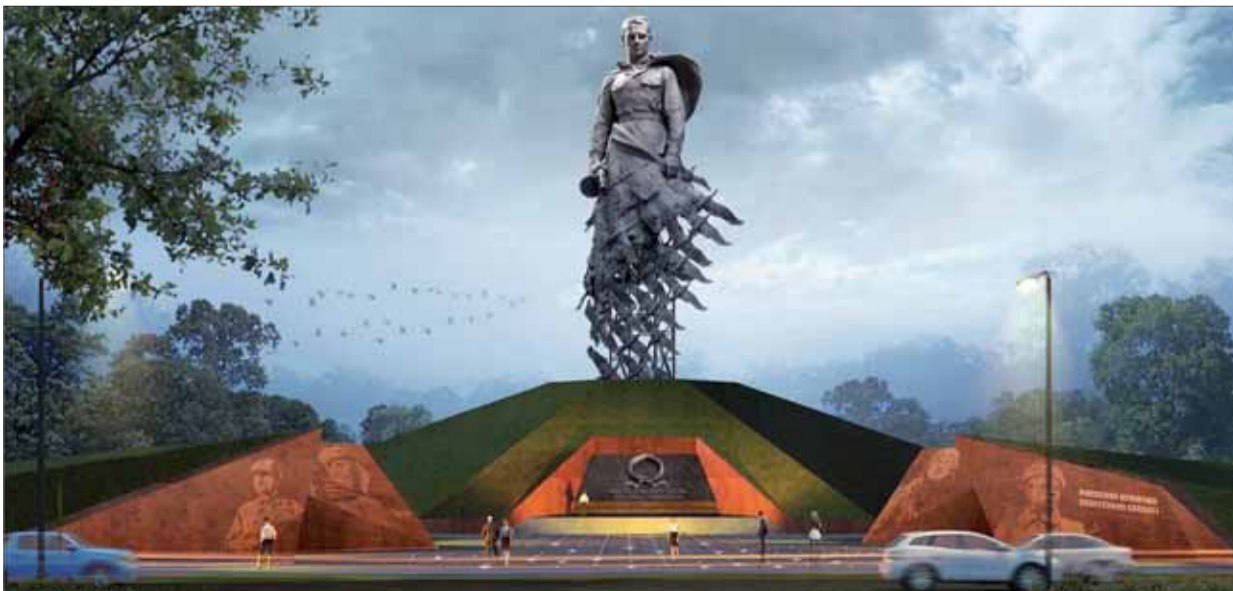
Nápis na podstavci pamätníka: Padli sme za vlasť, no je zachránená! Bronzová socha má výšku 25 metrov a hmotnosť okolo 80 ton.

V. Mikunda, podľa ruských prameňov, ilustrácia rzhew.histrf.ru