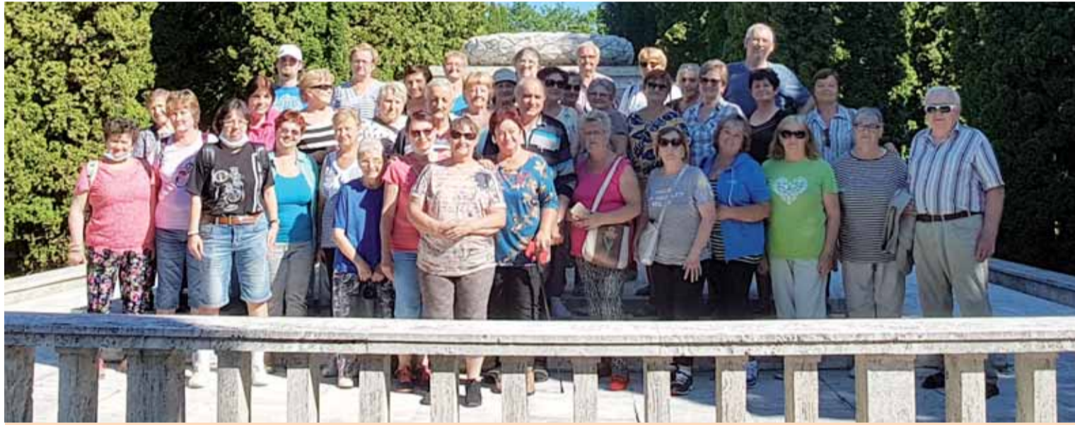
Vojenský cintorín Kráľovskej rumunskej armády vo Zvolene.