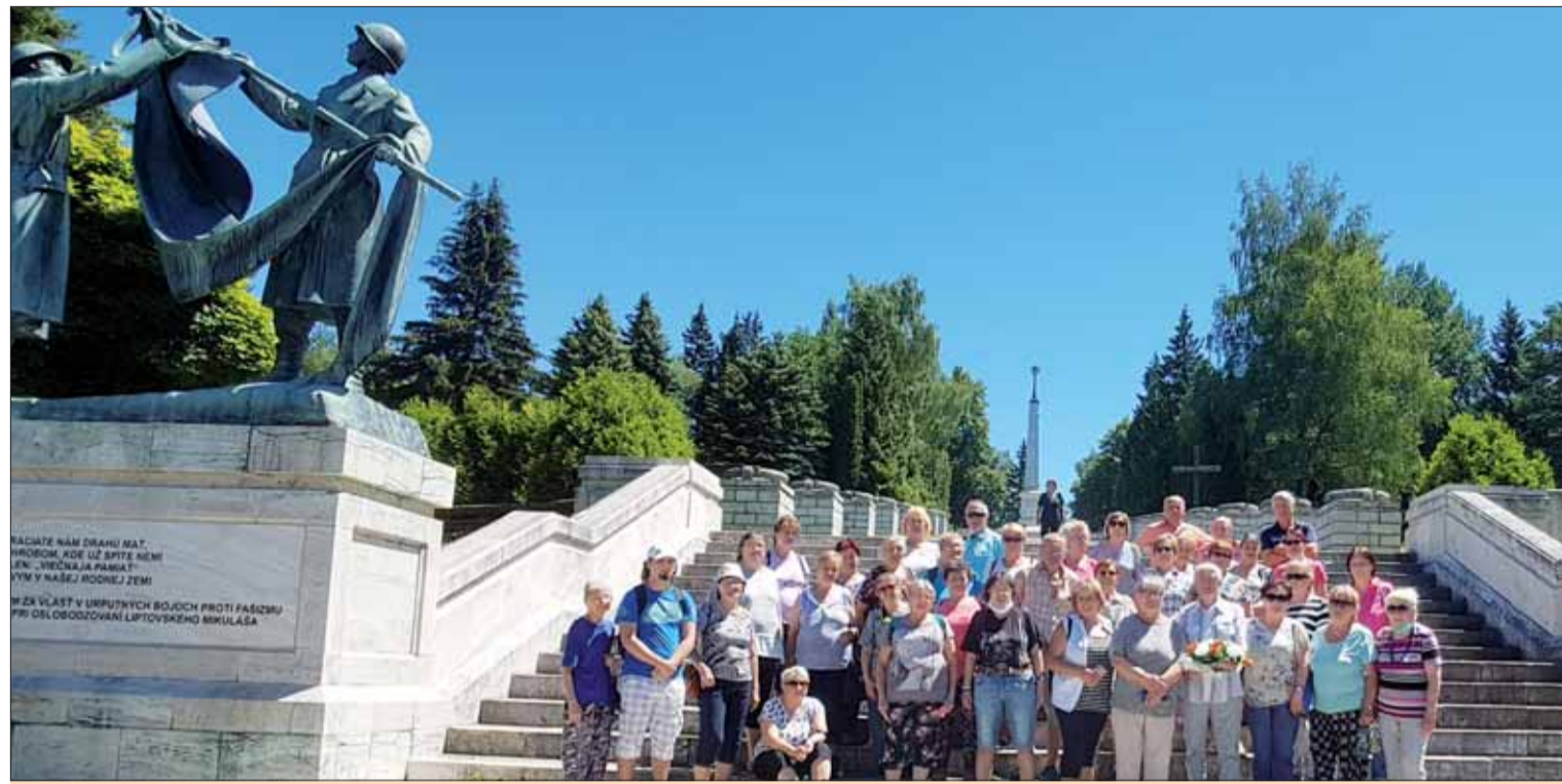
Vojenský cintorín 1. čs. armádneho zboru v ZSSR v Liptovskom Mikuláši na kóte 748 Háj – Nicovó.