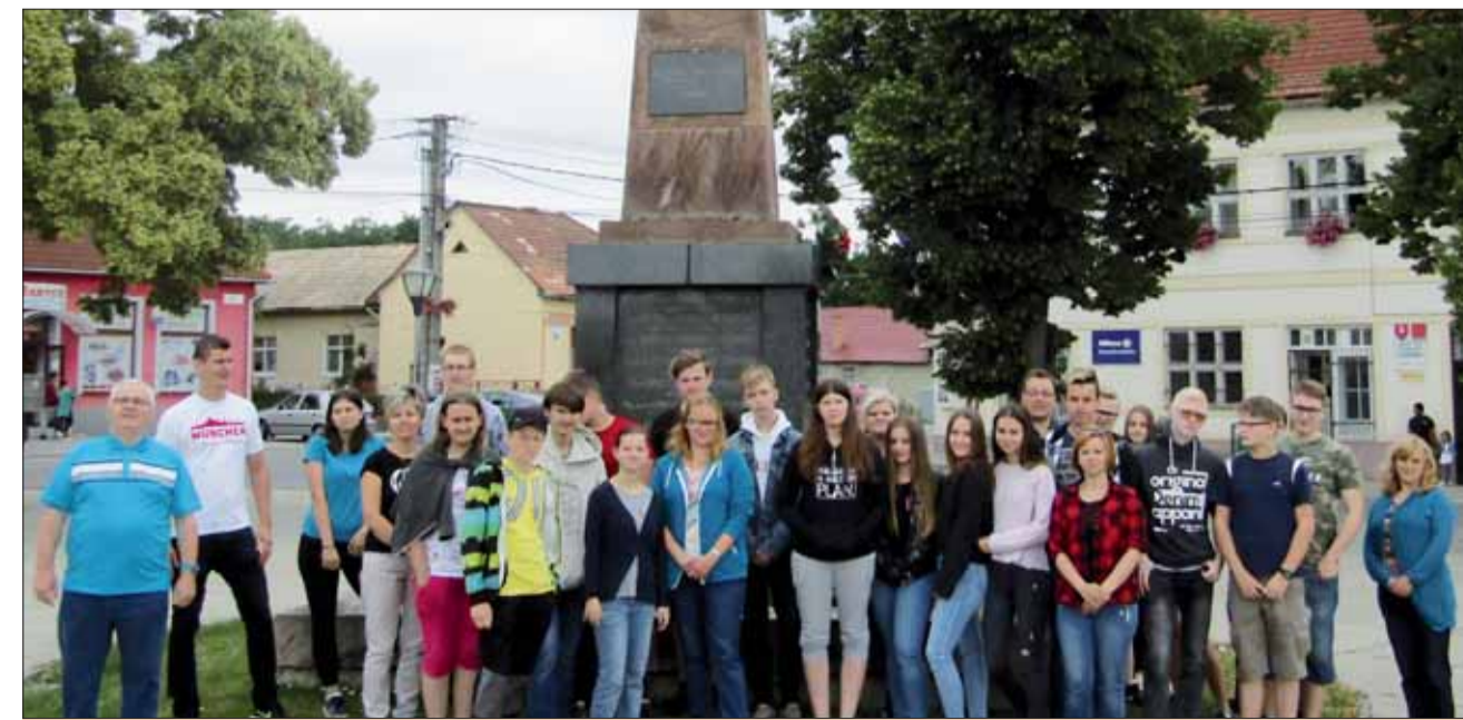
Mládež pri zrekonštruovanom pamätníku v Jesenskom.