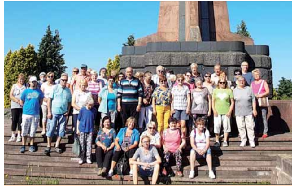
Vojenský cintorín Červenej armády vo Zvolene.