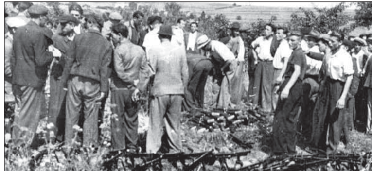
Vyzbrojovanie dobrovoľníkov v Baťovanoch (dnešné Partizánske).

vensku v priebehu júla a augusta 1944, sa však stali faktormi, ktoré sa spolupodieľali na začatí povstania podľa druhého variantu, bez ohľadu na dosiahnutý stav jeho príprav. Svedectvo o tom poskytujú viaceré dobové nemecké dokumenty. Napríklad vo vojnovom denníku nemeckého XXIV. tankového zboru, patriaceho do zostavy vojsk skupiny armád Severná Ukrajina nasade-