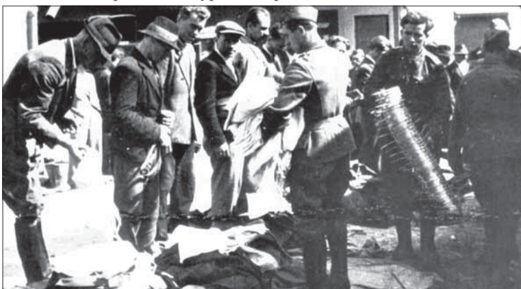
Vystrojovanie dobrovoľníkov v kasárňach v Banskej Bystrici.

Jozef Bystrický, VÚH Bratislava