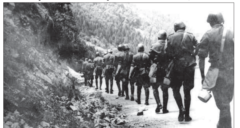
Presun povstaleckej vojenskej jednotky do pozícií pri Strečne.