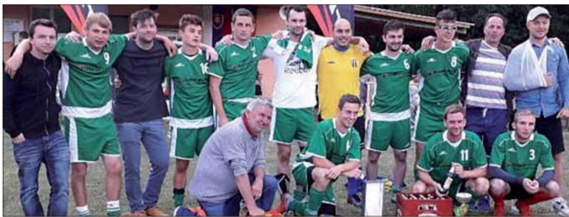
Vítané družstvo FC Stráni.