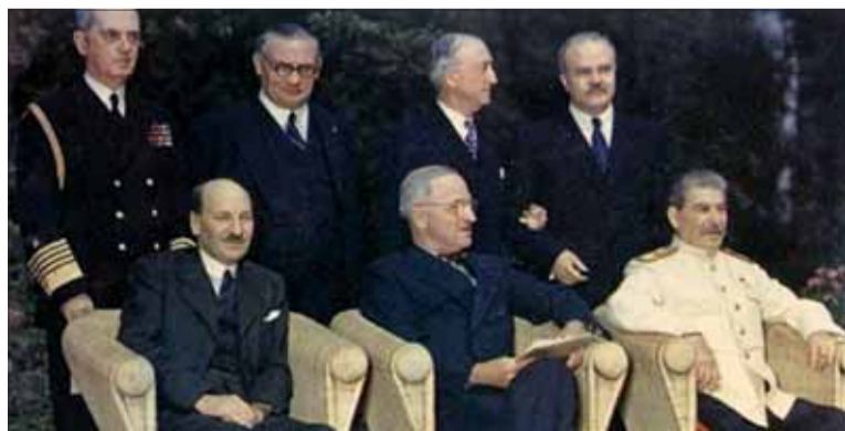
Vodcovia na Postupimskej konferencii. Zľava Clement Attlee (ktorý po vyhratých voľbách v priebehu konferencie nahradil Winstona Churchilla), Harry Truman a Josif Stalin.

Podľa ria.ru, 15. 7. 2020, snímka wikipedia.org