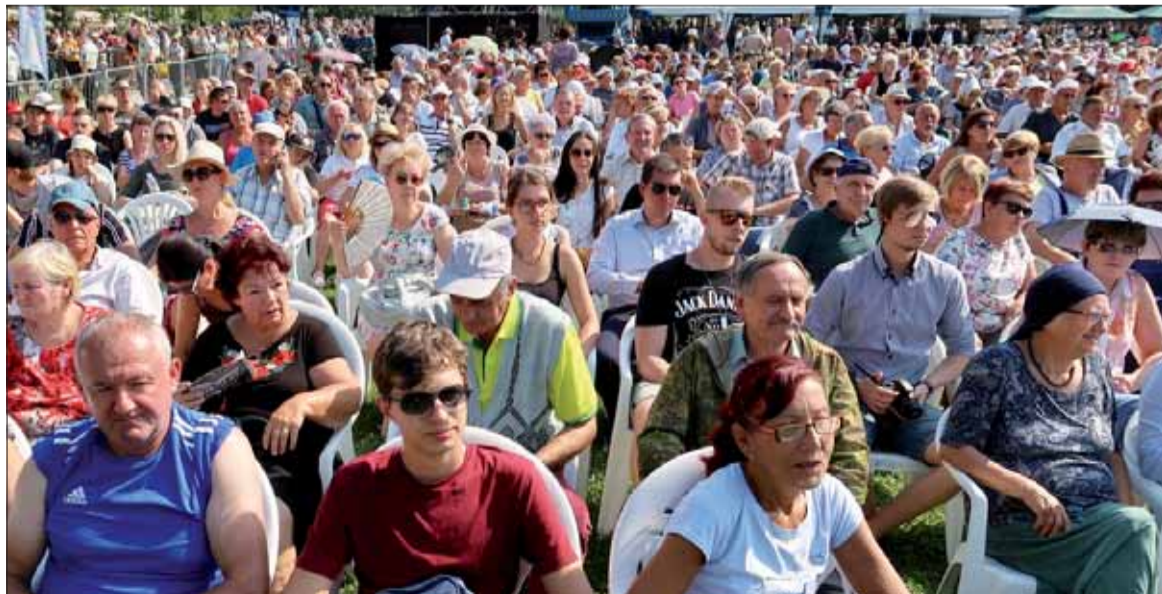
Tváre hovoria, že program je zaujímavý.