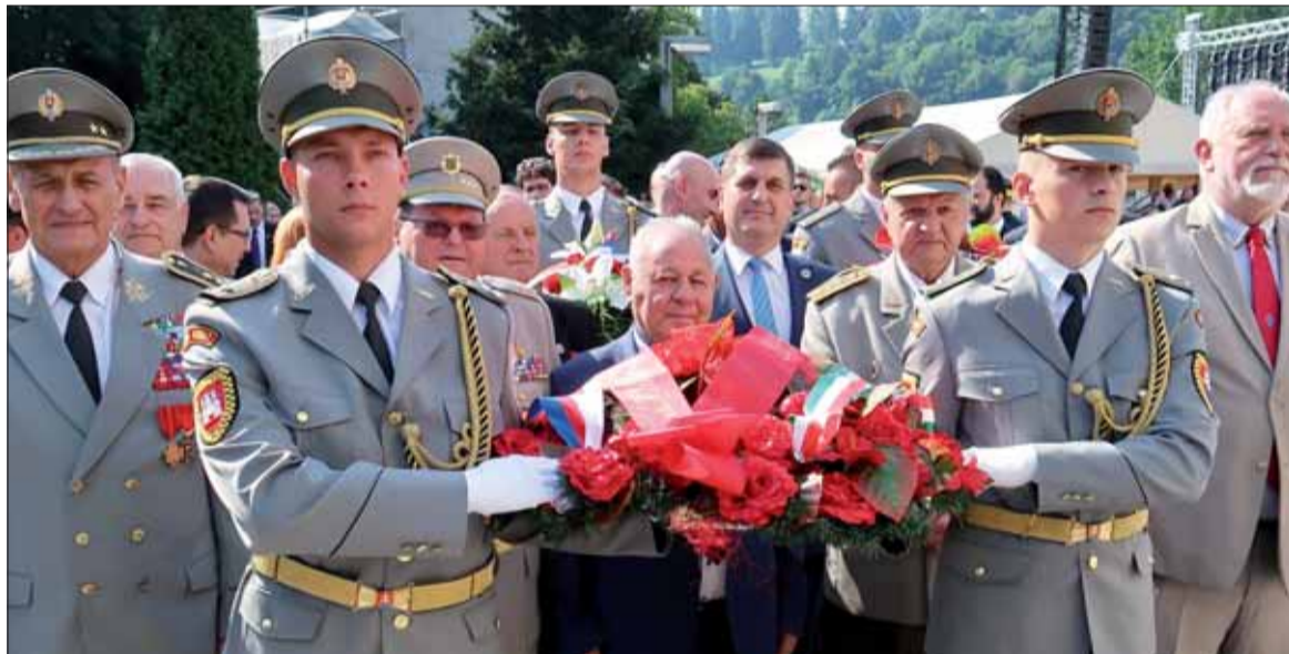
Delegácia SZPB, ČSBS a MEASZ.