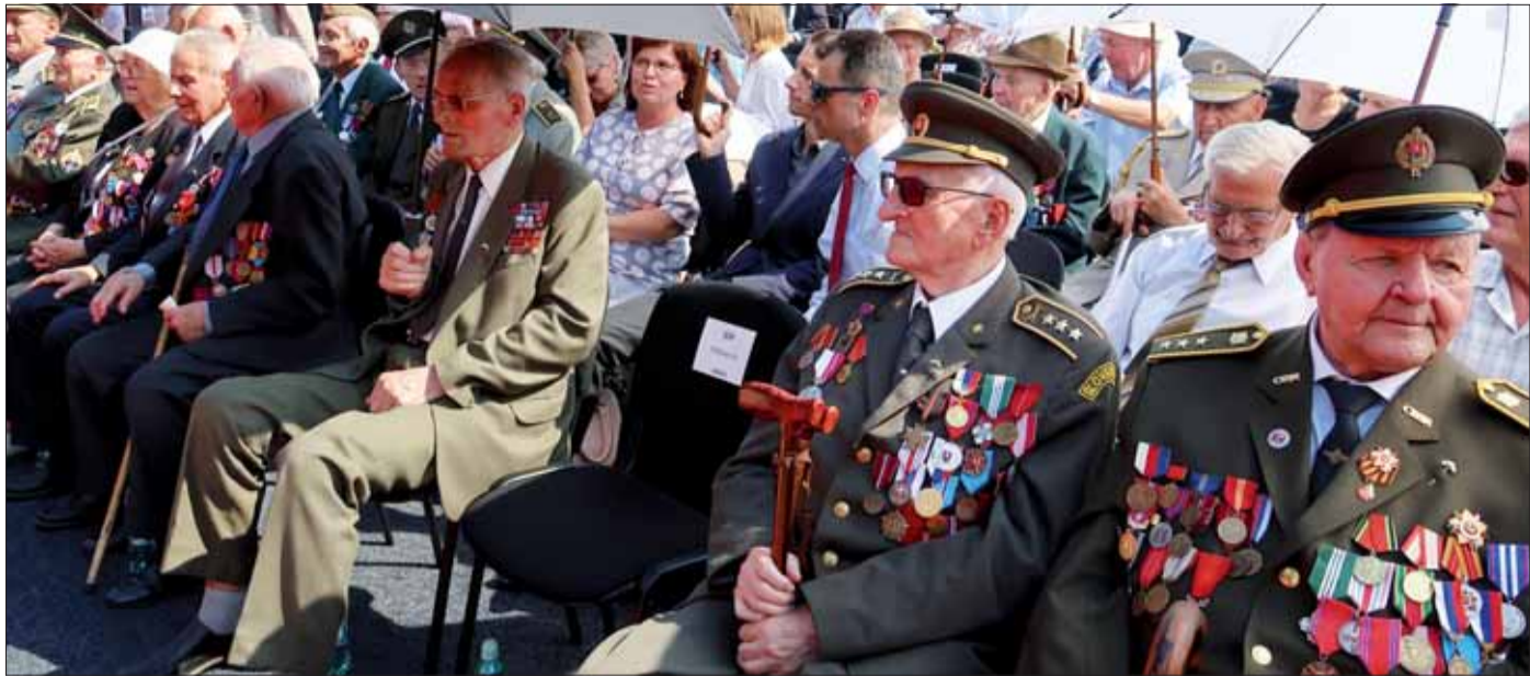
Takto, pod dáždnikmi, sa skrývali pred prudkým slnkom naši hrdinovia. Fašizmu však nastavili svoje slovanské prsia.