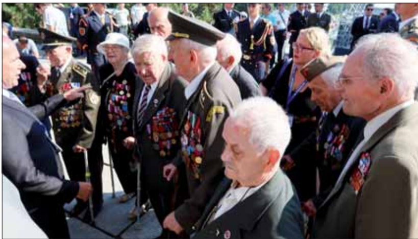
Vojnoví hrdinovia s pracovníkom MO SR.