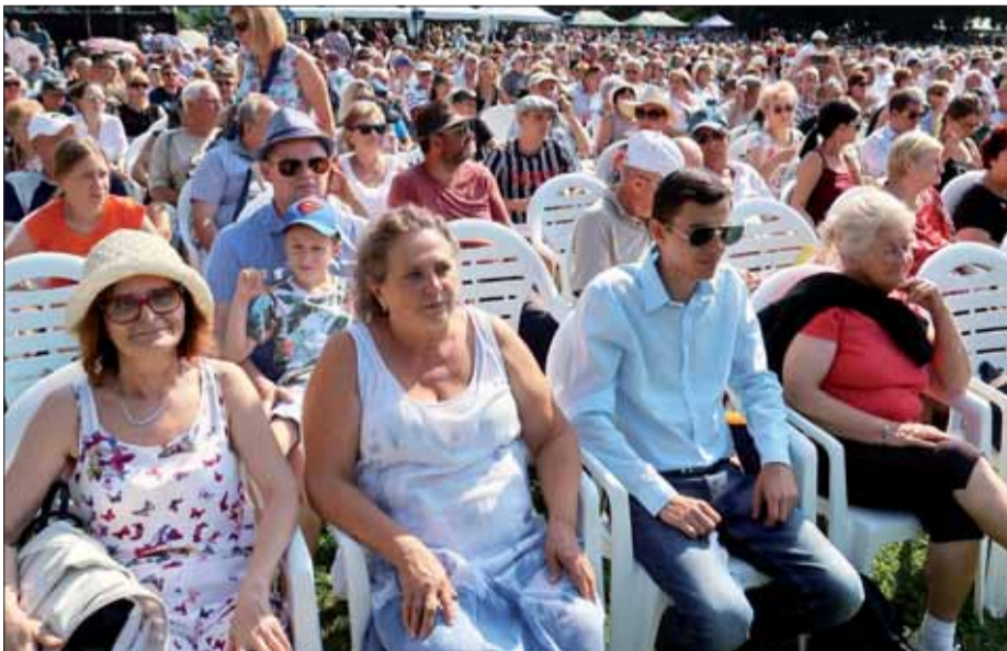
Ústredných osláv sa zúčastnili Bratislavčania, Oravci...