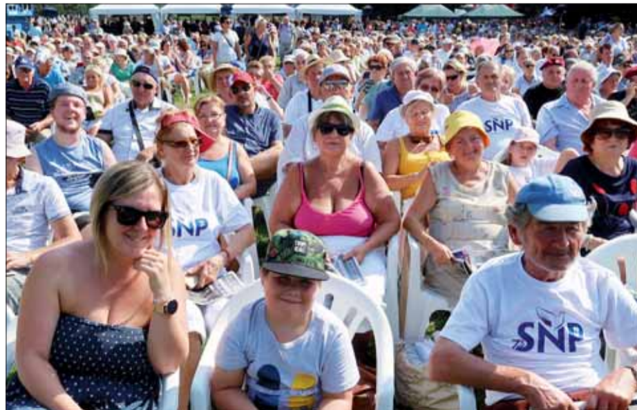
...a taktiež mládež.