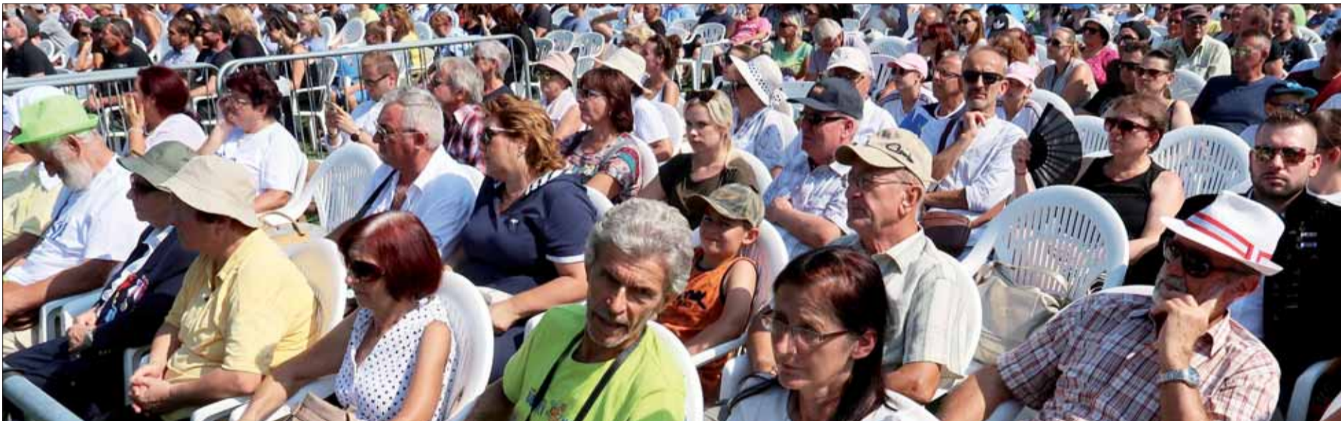
Vidíme protifašistov z Ružomberka, v diaľke aj z Košíc.