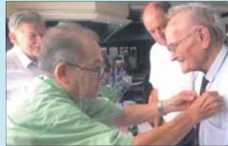
Vyznamenávanie Českým zväzom bojovníkov za svobodu.