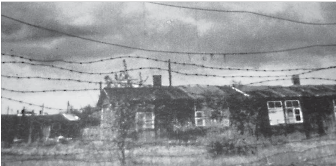
Zajatecký tábor v Haide.