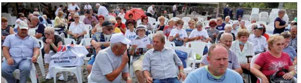
Pravdou je tiež to, že práve z týchto miest boli na niektorých politikov kričané cez diktafón slová „han- ba“, „fašisti“ a „zradcovia slovenského národa“, čo osobitne veľmi zle niesli prítomní vojnoví veteráni. Keď sa slova ujal predseda NR SR Boris Kollár, tak nezabudol ani na nich a oslovil ich ako „milí sme- rácki protestujúci“. Hoci SMER-SD si zorganizoval oslavy Výročia SNP pri Pamätníku obetiam fašiz- mu v Kremničke.

Rezort obrany (podľa www.mosr.sk) v súčasnosti eviduje 436 žijúcich účastníkov národného boja za oslobodenie. Z toho 92 osôb má na základe žiadosti priznané postavenie vojnového veterána.