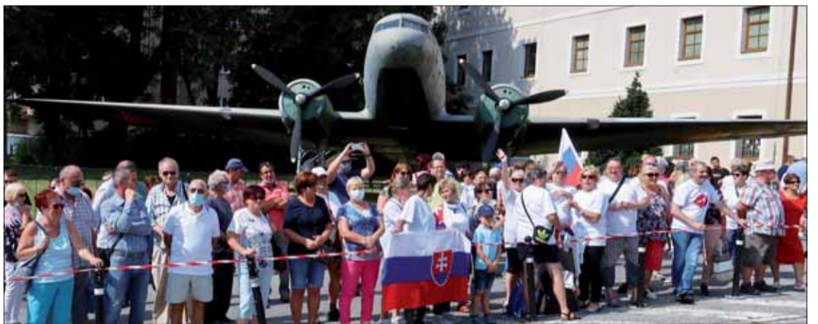
Mnohí z týchto ľudí vraj tiež chceli vstúpiť do areálu, no, žiaľ, mohlo v ňom byť len tisíc ľudí. Keď som k nim podišiel a požiadal policajtov, aby na chvíľu poodstúpili, za túto snímku sa aj im dostalo mnoho- hlasné poďakovanie.