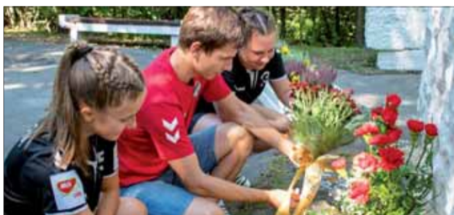
Kvety k pomníku partizánskej brigády.

Triumf na tomto najstaršom hádzanárskom turnaji na Slovensku si vybojovali hádzanářky ŠŠK Prešov, ktoré nestratili ani bod.