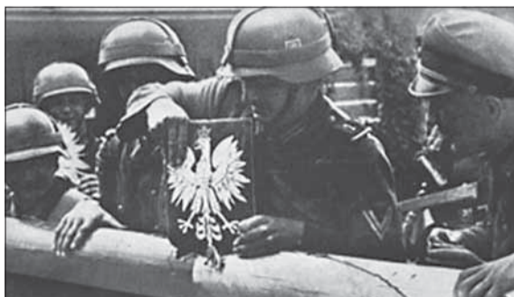
Nemeckí vojaci prekračujú 1. septembra 1939 poľskú hranicu.