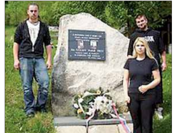
Študenti nenechali nič na pochybách. Dopátrali sa aj k okolnostiam vzniku tohto pamätníka v Pohronskom Bukovci.

Celkovo je táto študentská práca natoľko bohatá, že každý sa po jej prečítaní začne v téme SNP a jeho organizácie omnoho hlbšie orientovať.