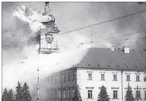
Horiaci Král'ovský zámok vo Varšave po ostreľovaní nemeckého delostrelectva.

O závažnosti a tajnosti dokumentu svedčí fakt, že Šapošnikov ho nezveril pisárke, ale napísal 31 strán osobne. Podľa názoru sovietskych vojenských odborníkov predstavoval najpravdepodobnejšiu hrozbu pre ZSSR v tomto období nielen vojenský zväzok Nemecka a Talianska, ale aj Poľsko, ktoré sa nachádzalo v oblasti fašistického bloku.