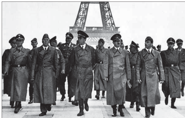
Kto mal najväčšiu zásluhu na ich porážke?