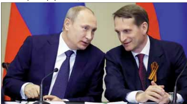
S. Naryškin s prezidentom RF V. Putinom.