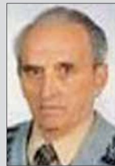
Oblastný výbor SZPB Martin