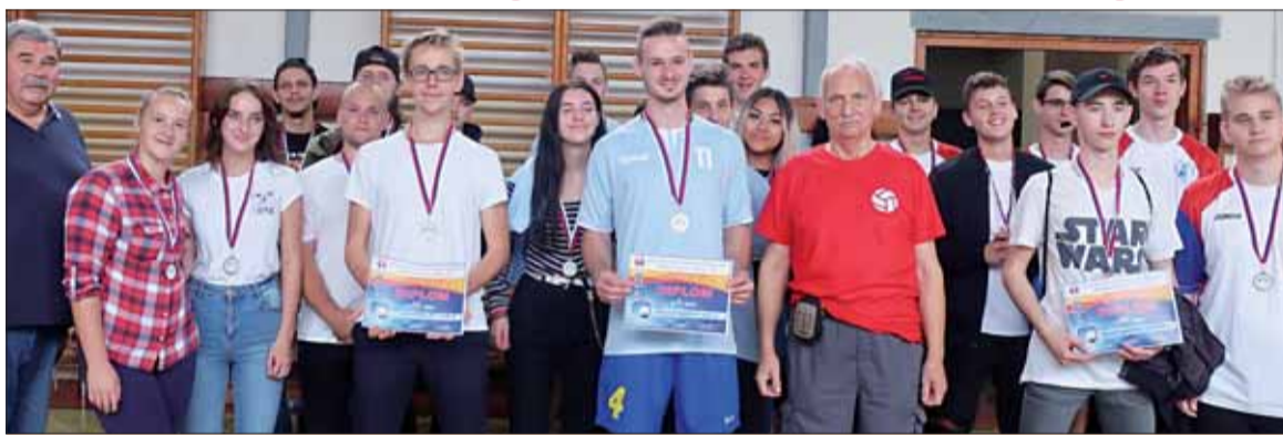
Družstvá juniorov na medailových miestach.

Pri príležitosti 75. výročia SNP ho usporiadala ZO SZPB Košice-Juh v spolupráci s MČ Košice-Nad jazerom, MČ Košice-Juh a Obchodnej akadémie Košice, Polárna 1.