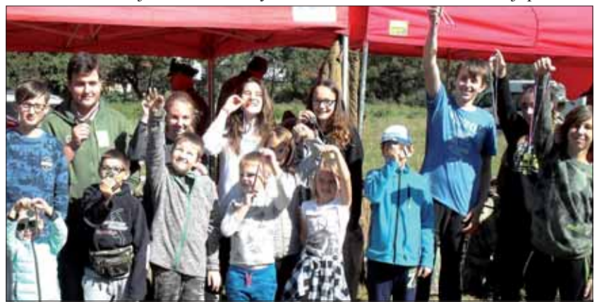
Ocenení súťažiaci v mladších kategóriách.

Súťažilo sa v 13-tich kategóriách, najviac ich bolo v kategórii „muži“. Medzi súťažiacimi bol aj poslanec