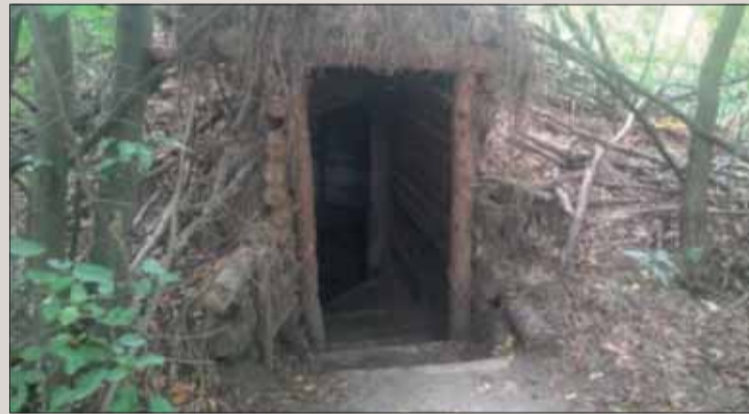
Bunker v lese nad Dargovským priesmykom.