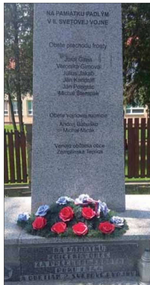
Pomník postavený na pamiatku padlým v 2. svetovej vojne pri ZŠ v Zemplínskej Teplici.

Martin Babič, Zemplínska Teplica, 5. ročník