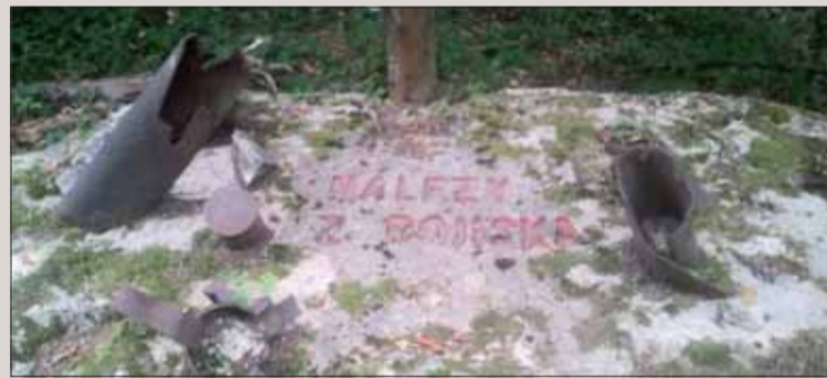
Ukážka nálezov z bojiska v okolí Dargovského priesmyku.