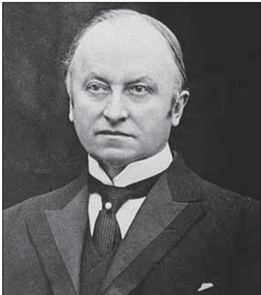
Lord George Curzon, minister zahraničia V. Británie, 1919.

Tá bola narysovaná a vytýčená v roku 1919 britským ministrom zahraničia lordom Geomom Cur-