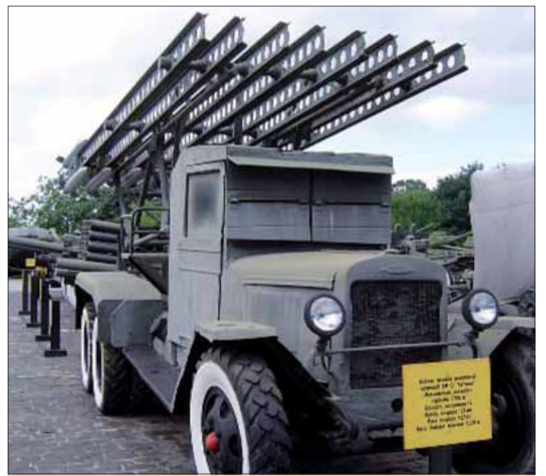
Sovietsky raketomet BM-13 zvaný „katuša“