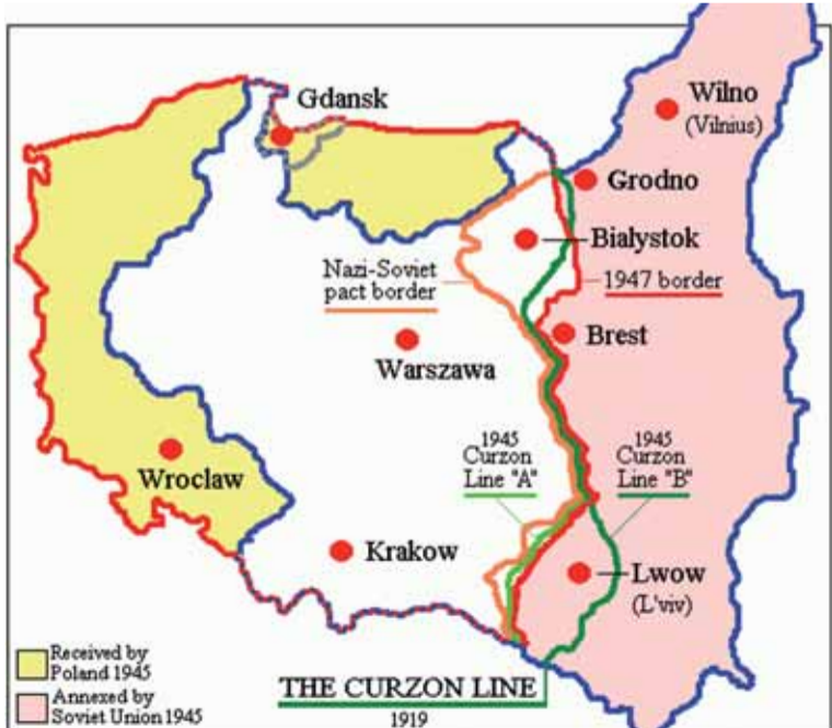
Curzonova línia je vyznačená zelenou farbou.