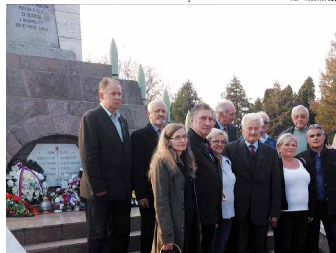
Maďarskí hostia v spoločnosti členov Predsedníctva ObIV SZPB Trebišov.

Zvýraznil dĺžku jednotlivých intervalov oslobodzovacieho boja, čo bolo spôsobené náročnosťou terénu a kladením odporu brániacich sa okupantov.