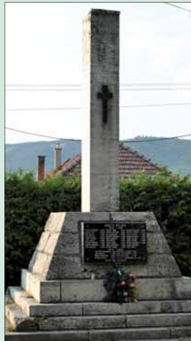
Spišský Štiavnik – Pamätník obetiam 1. a 2. svetovej vojny.

- Áno, obidvaja starí otcovia, ktorí vo vojne aj padli. Môj otec pracoval pre Nemcov v bani v Kišovciach.