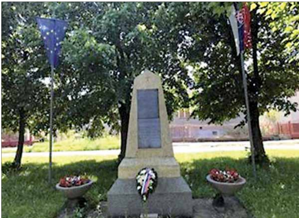
Pamätník v obci Egreš postavený padlým miestnym obyvateľom počas 2. sv. vojny.