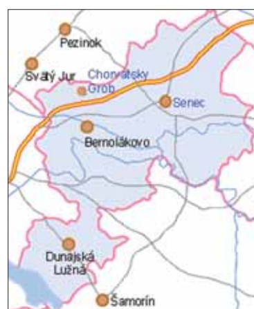
Mapa nášho okresu.