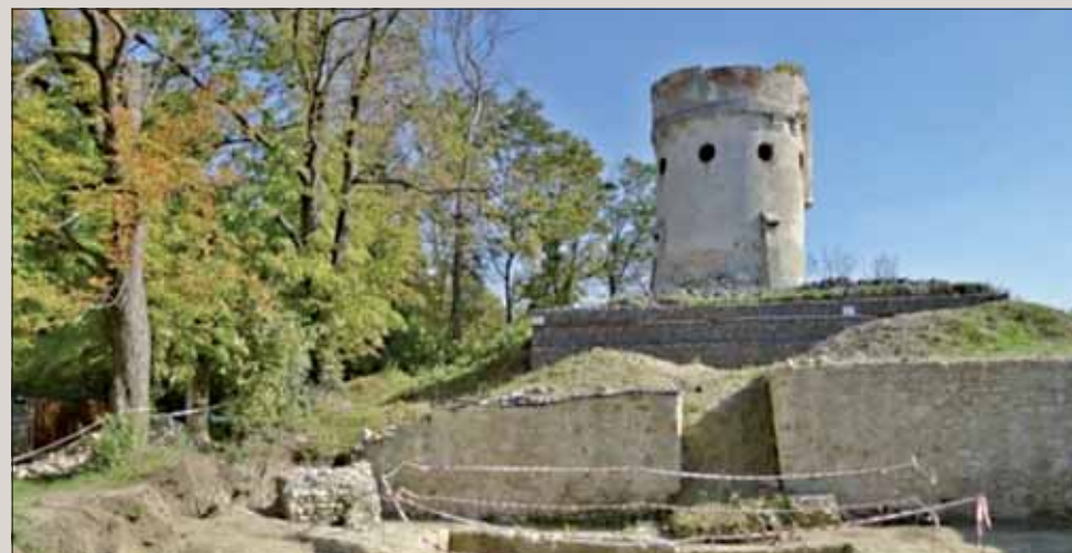
Zrúcanina hradu Čeklís - Vardomb

Našťastie po celom Slovensku bojovali za mier naši hrdinovia – partizáni. S pomocou sovietskej a československej armády sa im podarilo zvíťaziť nad fašizmom krátko pred polnocou 8. mája. Našu obec oslobodila Červená armáda 2. apríla 1945 ráno. „Zobudila som sa a konečne bolo všetko zlo preč. Bolo to krásne ráno,“ dopovedala mi prababka svoj príbeh. Chytilo ma to za srdce. My, mladí, by sme si mali vážiť, že pre nás staršia generácia vybudovala taký bezstarostný život. Oni nás vlastne oslobodili! Nevieť si predstaviť, čo by som ja robila pred 75 rokmi v takej situácii. Ale keďže mi záleží na budúcnosti mojich budúcich detí a detí mojich detí, tak by som bojovala až do konca! Za mňa to však urobil niekto iný,