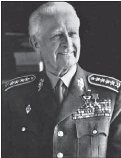
* 25. 11. 1895 Hrozatín, okr. Třebíč, ČR – † 20. 9. 1979 Praha

Dňa 5. 6. 1939 odišiel do Poľska, ako 310. dobrovoľník sa stal členom čs. vojenskej skupiny organizovanej v Krakove a jej veliteľom. Pod jeho velením sa po vydaní dekrétu poľského prezidenta I. Moscického formovala Česká a slovenská légia, ktorá po prepadaní Poľska ustupovala na východ a 18. 9. 1939 prešla na územie obsadené Červenou armádou. V ZSSR organizoval odsun internovaných príslušníkov čs. jednotky do Francúzska a Palestíny.