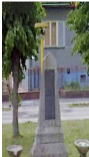
Pomník postavený na počesť padlým miestnym obyvateľom počas 2. sv. vojny.