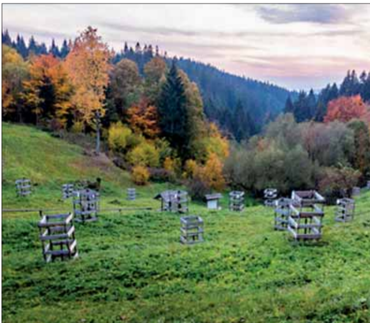
Sad života – pamätné miesto na Kališti, kde má obec Egreš svoj strom.