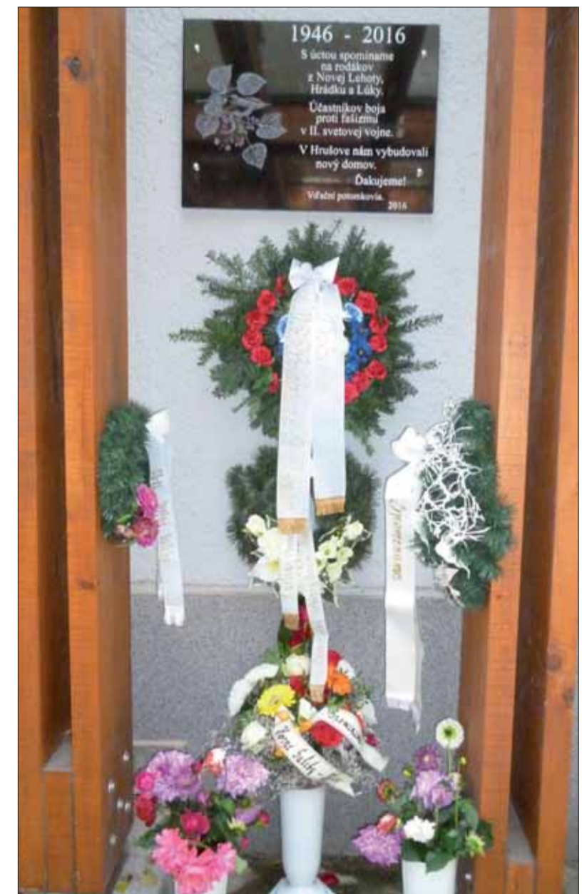
Pamätná tabuľa pre rodákov z Novej Lehoty, Hrádku a Lúky účastníkov boja proti fašizmu v 2. svetovej vojne je umiestnená v obci Dolné Saliby, lebo tam spia svoj večný sen.