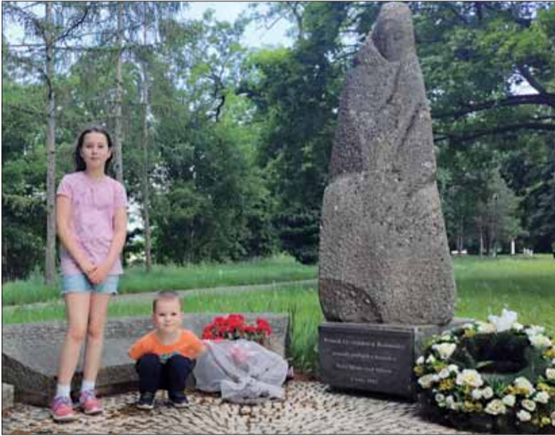
Pomník rumunským vojakom, padlým pri oslobodzovaní Nového Mesta nad Váhom. Je dielom akademického sochára M. Struhárika a P. Macku a bol odhalený 8. apríla 1992. Tu odpocívali telesné pozostatky vojakov až do ich exhumácie a prevezení na vojenský cintorín do Zvolena...

Pamätník osloboditeľov nášho mesta sme si boli pozrieť a môj otec pri ňom odfotografoval mňa aj môjho brata Adamka.