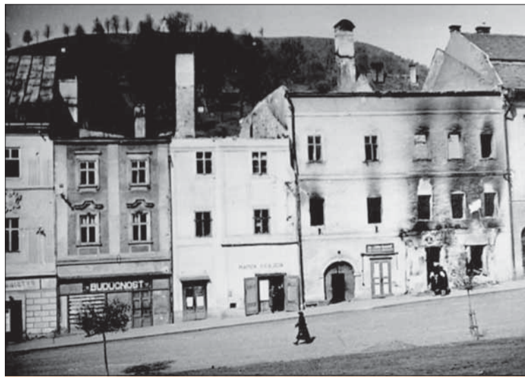
Dva z väčších vypálených kremnických domov.

A mesto Kremnica podporuje oficiálne priznanie tejto objektívnej dejinnej pravdy?