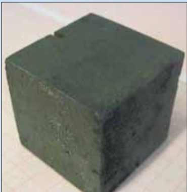
Kocka kovového uránu, ktorá je dôkazom nemeckého atómového výskumu cez vojnu.