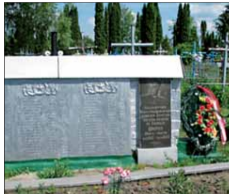
Spoločný hrob a pamätník Imricha Jacko-Lysáka v obci Ruda na Ukrajine.

Pri príležitosti 68. výročia SNP minister obrany SR povýšil 29. 8. 2012 Imricha Jacko-Lysáka do vojenskej hodnosti kapitán in memoriam.