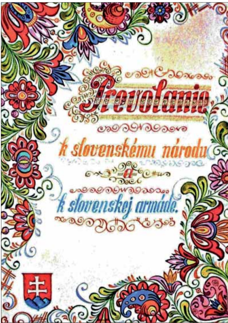
Titulná strana Prevolania.

Rok 1943 príslušníci Pluku slovenských dobrovoľníkov zakončili silvestrovským programom a spoločnou večerou. Na Nový rok bol pre mužstvo pripravený kultúrny program, ktorý na Silvestra zhliadli dôstojníci pluku. Ešte predtým, 30. decembra 1943, J. V. Stalin podpísal rozhodnutie Štátneho výboru obrany ZSSR o ďalšej výstavbe československých vojenských jednotiek na území ZSSR, na základe ktorého sa príslušníci pluku 3. januára 1944 dozvedeli o pripravách ich presunu do Jefremova. V tomto meste sa už 9. januára stali základom personálnej výstavby 2. československej samostatnej paradesantnej brigády v ZSSR, v rámci ktorej neskôr zasiahli do bojov v Karpatsko-duklianskej operácii, v Slovenskom národnom povstaní a mnohí z nich aj v partizánskej vojne na Slovensku po potlačení povstania. Jozef Bystrický, VNH Bratislava