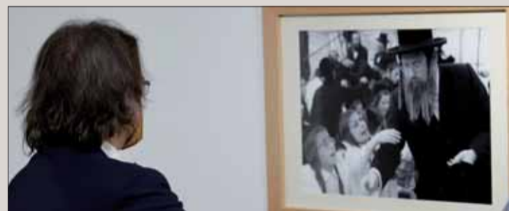
V Múzeu holokaustu sa uskutočnila aj vernisáž fotografií.

Počas Medzinárodného dňa obetí holokaustu si pripomíname výročie oslobodenia koncentračného tábora Auschwitz-Birkenau na území okupovaného Poľska. Ide o miesto, kde v rozmedzí piatich rokov nacisti zavraždili 1,1 milióna ľudí.