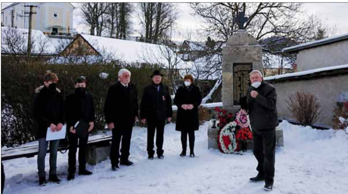
Účastníci pietneho aktu v Pohorelej pri pomníku, kde si uctili svojich osloboditeľov.

K pamätníku obetiam z oboch svetových vojen položili účastníci veniec a kyticu kvetov. Zapálili tiež sviečky, čím vyjadrili všetkým padnutým úctu. V krátkom príhovore pripomenul autor tohto článku historické udalosti oslobodenia.