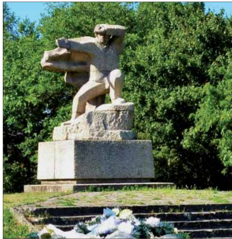
Pomník bojovníkom SNP na vrchu Roh.

kali, odzbrojili ho a chceli ho dopraviť na partizánsky štáb na brezovských kopaniciach. Cestou sme Glýra vypočúvali ohľadom lúpeží, ktoré spáchal. Sám sa k nim priznával a vyhlásil, že z toho, čo nalúpil, nemá veľkého osohu, lebo