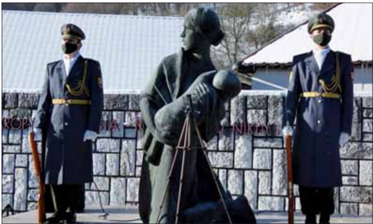
Pamätník, pri ktorom sa konala pietna spomienka na Krvavú nedeľu.