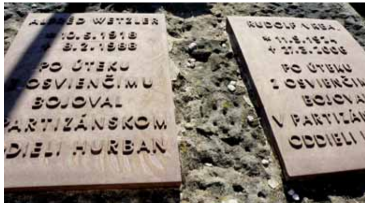
Pamätne tabule Alfréda Wetzlera a Rudolfa Vrba na pomníku hrdinov SNP na vrchu Roh.