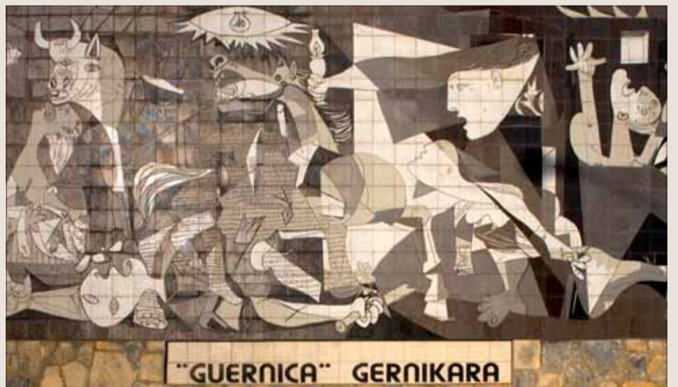
Picassova Guernica na múre.

Obraz Picassa namaloval v parížskom exile a v roku 1939 ho zveril Múzeu moderného umenia v New Yorku. Do Španielska mal dostať po opätovnom nastolení demokracie. Monumentálne dielo s rozmermi 350 na 777 centimetrov je v madridskom múzeu kráľovnej Sofie od roku 1981.