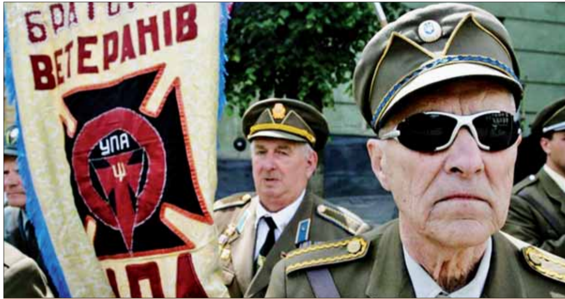
Bývalí vojaci Ukrajinskej povstaleckej armády v roku 2012 oslavovali svoj Deň hrdinov vo Lvove.

Musela to byť pre ňu hrôza, vydržala tak až do rána. O pár