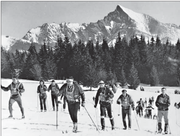
Na pribylinských lúkach pod Kriváňom, 15. ročník LTP roku 1989.

Autor bol dlhoročný organizátor a účastník všetkých ročníkov LTP, tiež prvého a mnohých ďalších ročníkov Bielej stopy SNP. Ako profesionál v telovýchove odpracoval 40 rokov.