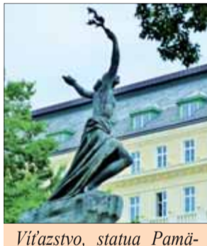
Víťazstvo, statua Pamätika oslobodenia Bratislavy Červenou armádou, mramor-bronz 1950.