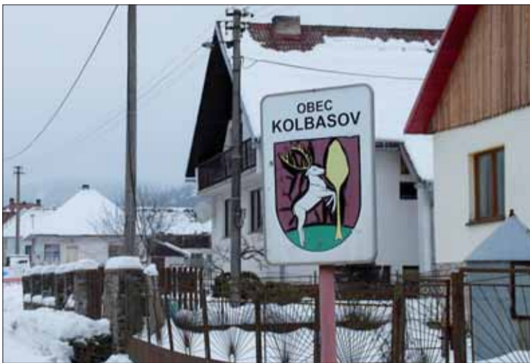
Obec Kolbasov leží v okrese Snina.

Bolo niekoľko mesiacov po druhej svetovej vojne. Ľuďom na severovýchode Slovenska sa žilo ťažko. Mnohí nemali strechu nad hlavou, ich domy zrovnal so zemou prechádzajúci front. Predchádzajúce tragické udalosti zdecimovali židovskú komunitu.