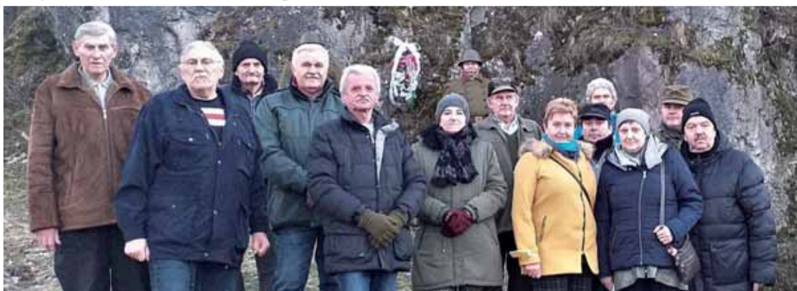
Účastníci osláv Dňa delostrelectva v Ružomberku.

V priebehu roka 2022 pamätník obohatia nové informačné tabule a úprava výstupového chodníka k samotnému delu.