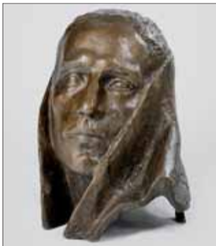
Hlava partizána z pomníka SNP v Partizánskom II, bronz 1949, SNG.