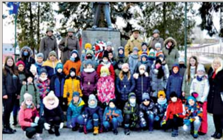
Na pietnom akte v Bystrom sa zúčastnili aj deti.

V úvode spomienkovej slávnosti zaznela hymna SR. Následne prebehol pietny akt kladenia vencov za asistencie Hencovského oddielu Gvardija podľa vojenských štandardov. Samozrejmosťou bola aj čestná salva na počesť padlým hrdinom, ktorí obetovali svoje životy pri oslobodzovaní. Prítomných privítal starosta obce a informoval o priebehu oslobodenia obce a občanoch, ktorí nasadili vlastné životy a podieľali sa na oslobodení.