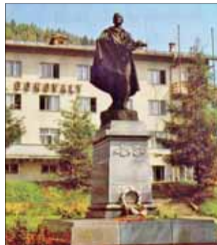
Pamätník SNP na Donovaloch Návrat partizána – Jar 1945, žula bronz 1954.