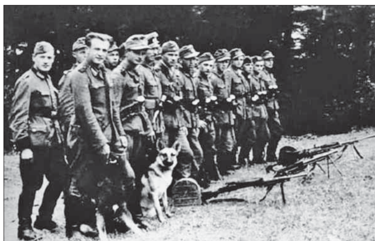
Príslušníci UPA, nazývaní banderovci.