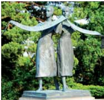
Vďaka, súsošie Pamätníka Červenej armády na Slavíne v Bratislave, bronz 1963.