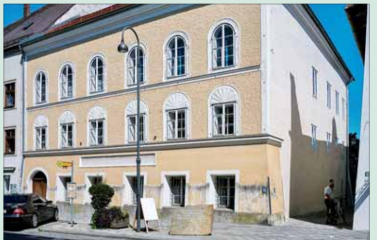
Rodný dom Adolfa Hitlera v hornorakúskom mestečku Braunau.