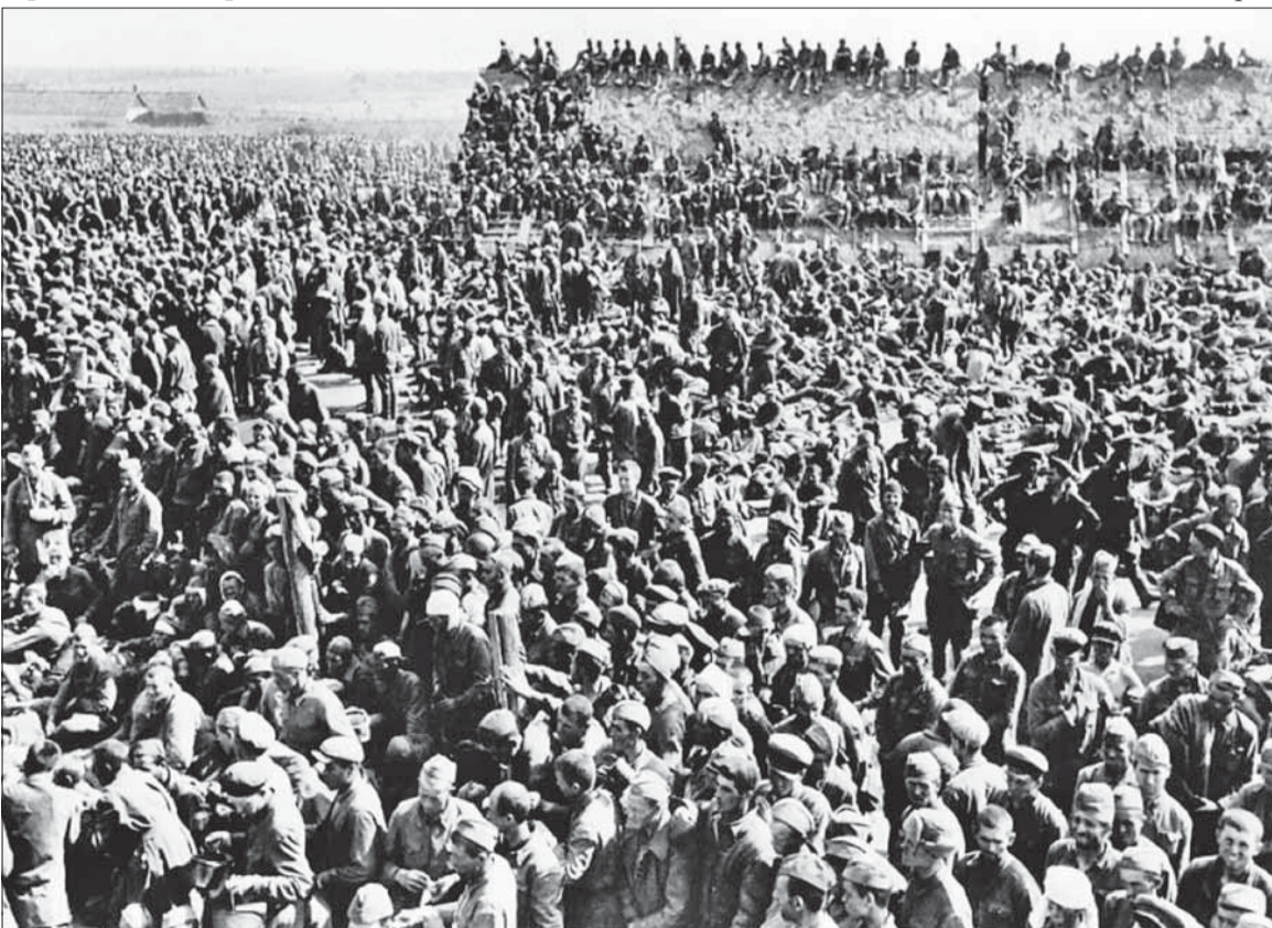
Sovietski zajatci v prvých dňoch vojny, boli ich státisíce.

Pokiaľ išlo o Rusko, Hitlerove a Rosenbergerove zábery boli v súlade. Územie malo jednoznačne patriť Nemcom, chceli zničiť komunistickú vládu a nepripustiť ustanovenie novej slovenskej vlády. Rosenberg však mal iné plány s po-