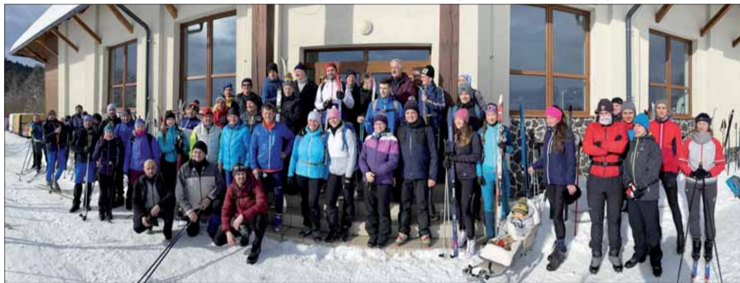
Účastníci bežkárskeho podujatia Po Kamjanských stežkách pred jeho štartom.

Aj takýmto spôsobom napĺňame odkaz našich nehynúcich hrdinov – osloboditeľov našej krásnej domoviny.