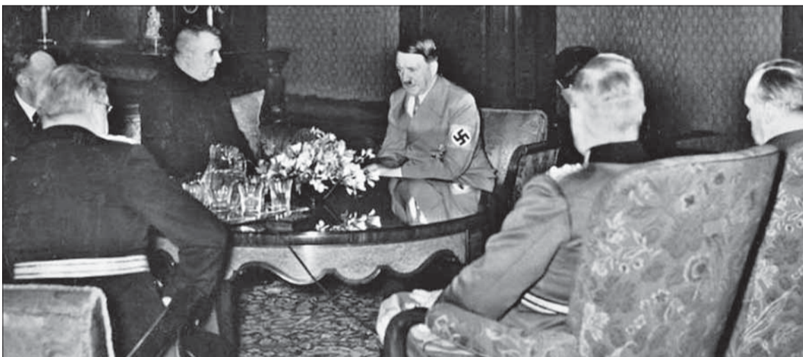
Jozef Tiso a Ferdinand Ďurčanský počas rokovania s ríšskym kancelárom Adolfom Hitlerom 13. marca 1939 v Berlíne.

V roku 1939 dostal ThDr. Jozef Tiso do rúk také množstvo mocenských pák na riadenie prinajmenšom vnútorných záležitostí štátu, že mu ich môžu mnohí súčasní politici s autoritatívnymi chůtkami závidieť. Ako ich bytčiansky rodák využil, či zneužil, dobre vieme.