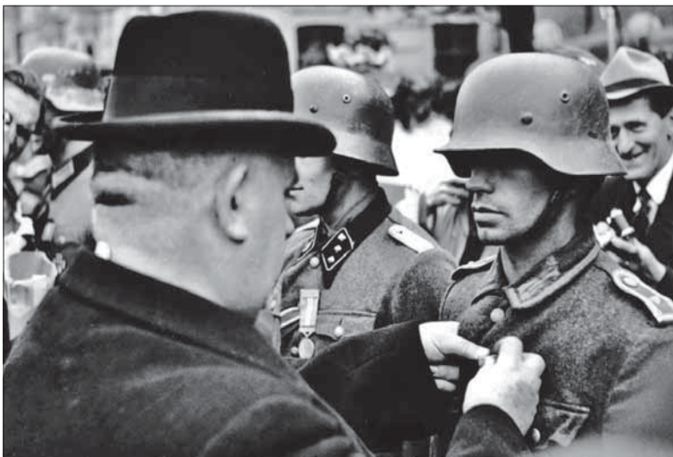
Tiso vyznamenáva nacistických vojakov v Banskej Bystrici.

Na politickej scéne sa Tiso výraznejšie objavil až po 1. sve-