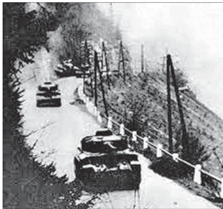
Tanky v bojoch o Strečniansku tiesňavu.