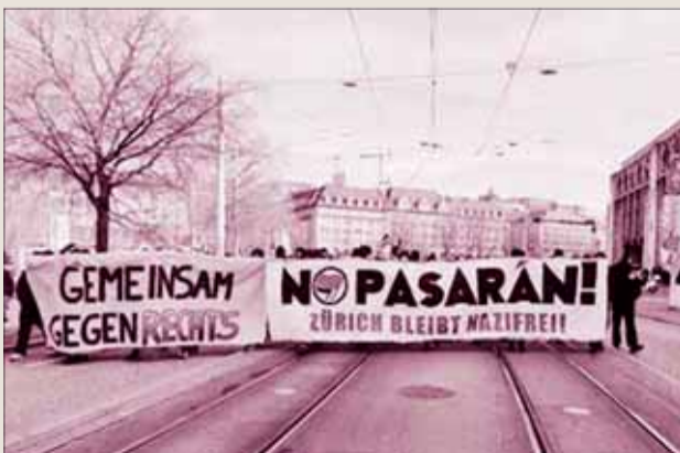
Pochod švajčiarskych antifašistov 13. februára v Zürichu.

Podujatie antifašistov vyvolala aj neonacistická demonštrácia, ktorá sa v polovici januára uskutočnila v Berne. Všetky tieto aktivity vedie extrémne pra-