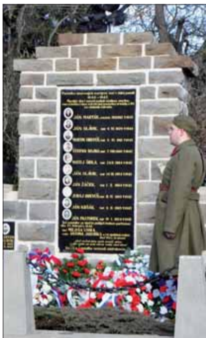
Pri príležitosti 77. výročia Cestinského boja sa 27. februára konala spomienková slávnosť na hrdinov, ktorí položili životy pre slobodu našej vlasti.

Osobne mi chýba rubrika o ankete čitateľov, tak ako to bolo predtým, kde sa mohli k určitej otázke vyjadriť aj obyčajní členovia SZPB a tiež, čo sa v zahraničí deje a čo my mu odkazujeme. Písať by sa dalo viacej, ale starší členovia, pre ktorých bol odber Bojovníka „povinnosťou“ vymierajú a ostatní sa vyhovárajú na internet. Je to škoda, že takto uvažujú.