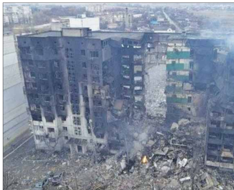
Sídliisko mestečka Borodanka, asi 60 kilometrov severozápadne od Kyjeva, sa stalo terčom dvojďňového bombardovania ruskou armádou. Útok neprežilo niekoľko civilistov.