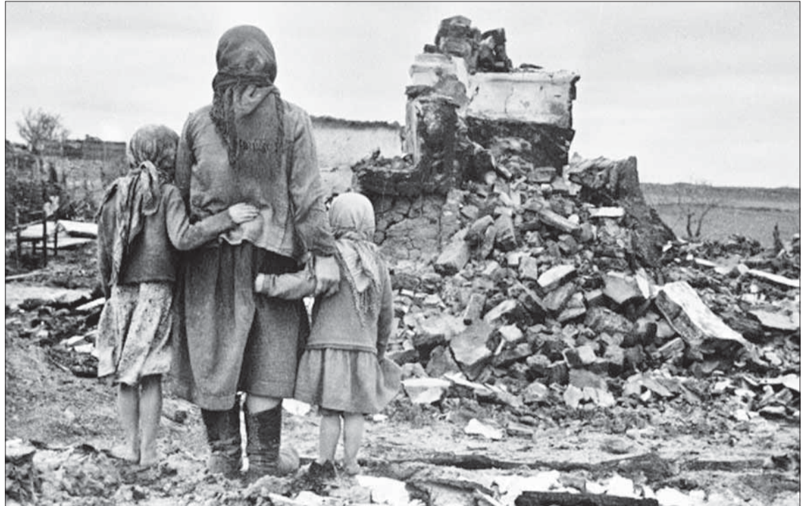
Nemecká agresia pripravila o strechu nad hlavou 25 miliónov sovietskych občanov. Žena s dvoma dievčatkami pri pohľade na ruiny domu.

Samozrejme, tvrdil o nich, že sa zrúti pod tlakom nadržanej rasy, pretože im bude chýbať cárske vedenie, ktoré spo-