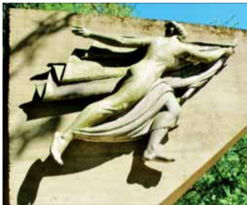
Pomník SNP v Kunerade.