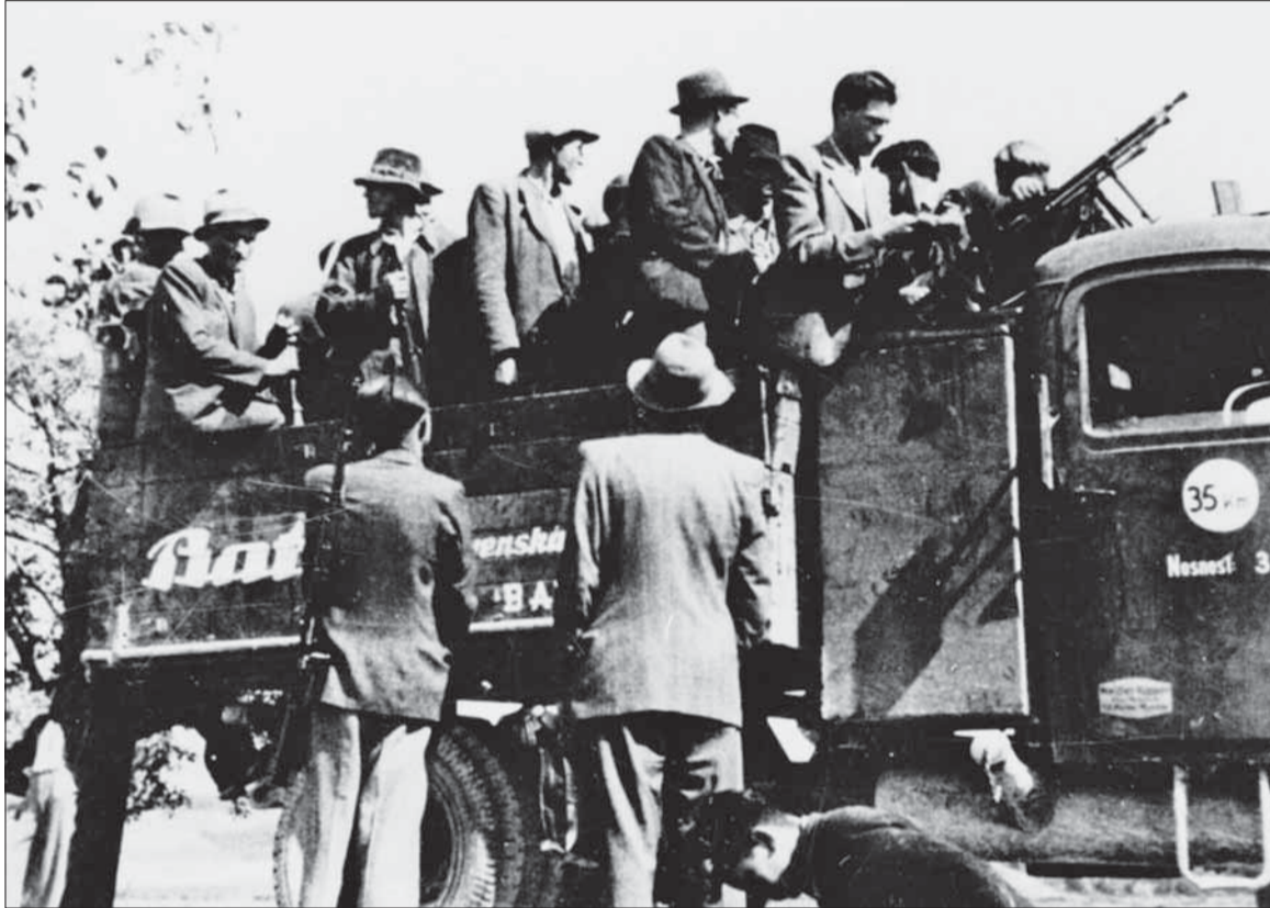
Nástup dobrovoľníkov z Baťovian (Partizánskeho) do SNP.

(Uprava a medzititulky redakcia Bojovník.)