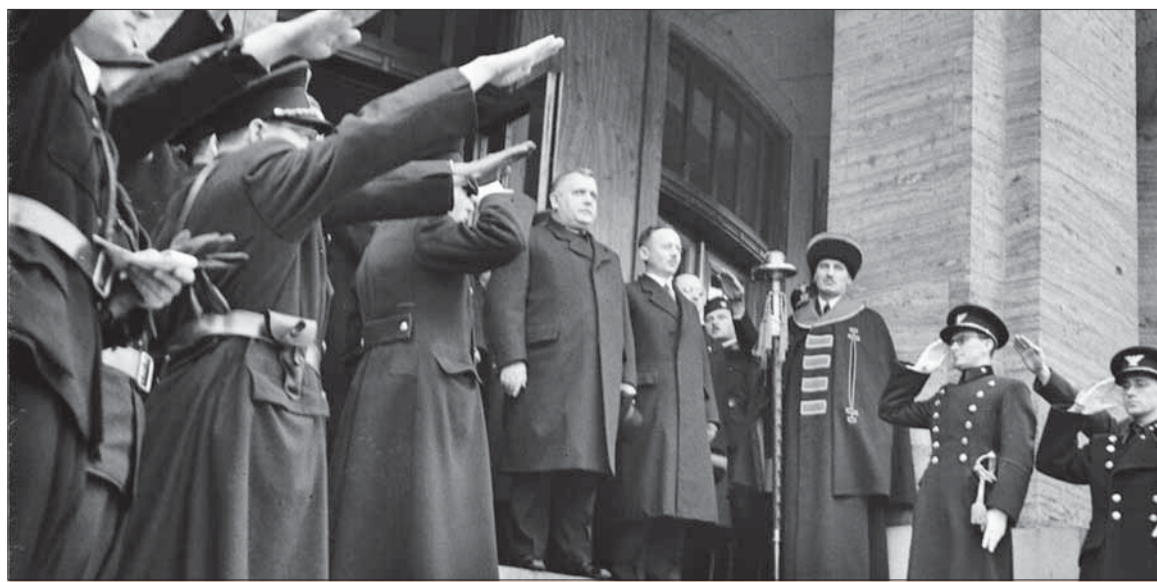
Jozef Tiso po zvolení za prezidenta pred Slovenskou univerzitou.

Ktovie či Hitler vtedy stihol Tisovi prezradiť, čo všetko