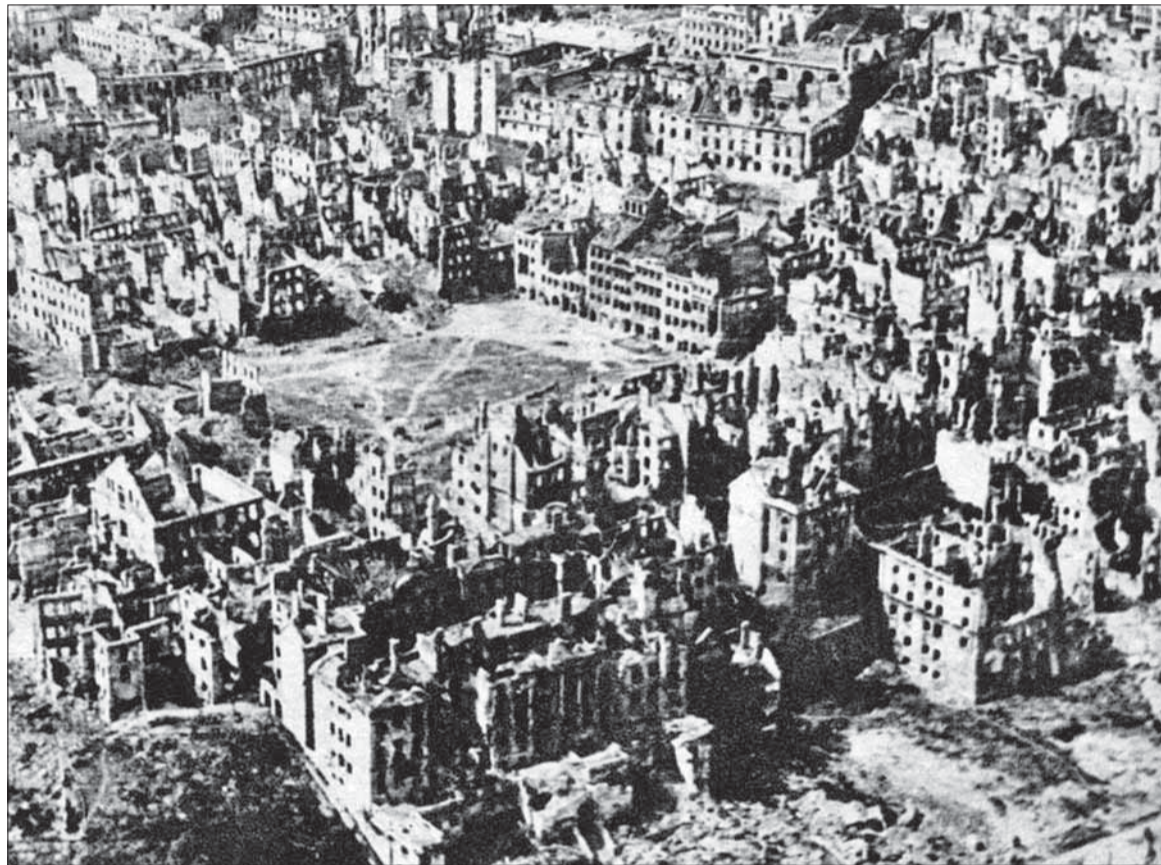
Na Hitlerov príkaz Nemci zrovnali Varšavu so zemou, takto vyzerala v januári 1945.

cisti a ich domáci prisluhovači zavraždili 5304 ľudí, z ktorých polovicu – Židov a Rómov – popravili z rasových dôvodov. Politika životného priestoru pre nordickú rasu sa však uskutočňovala najmä počas nemeckej agresie v Poľsku a ZSSR. Dá sa len ťažko predstaviť, čo by sa dialo, keby Hitlerovi vyšli jeho dobyvačné zámery.