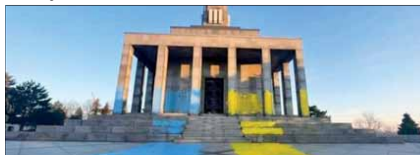
Jednoducho hrozný a odsúdeniahodný čin.