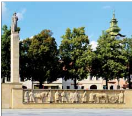
Pomník padlým v SNP, Prievidza.