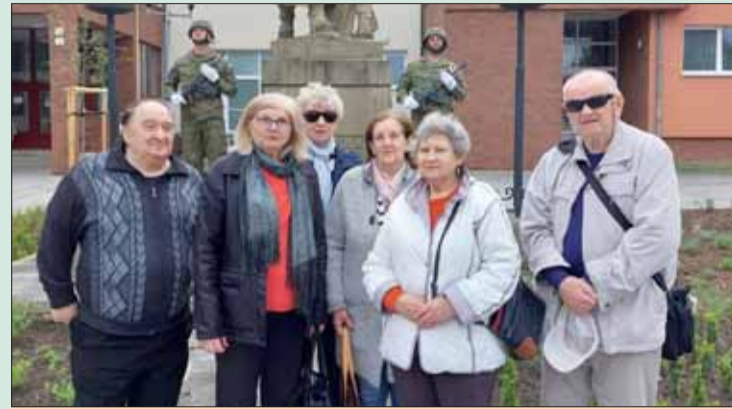
Obyvatelia Topoľčan si položením venca pri miestnom pamätníku uctili obete 2. svetovej vojny.

Položením venca sme prejavili vďaku a úctu osloboditeľom, ako aj obetiam vojny.