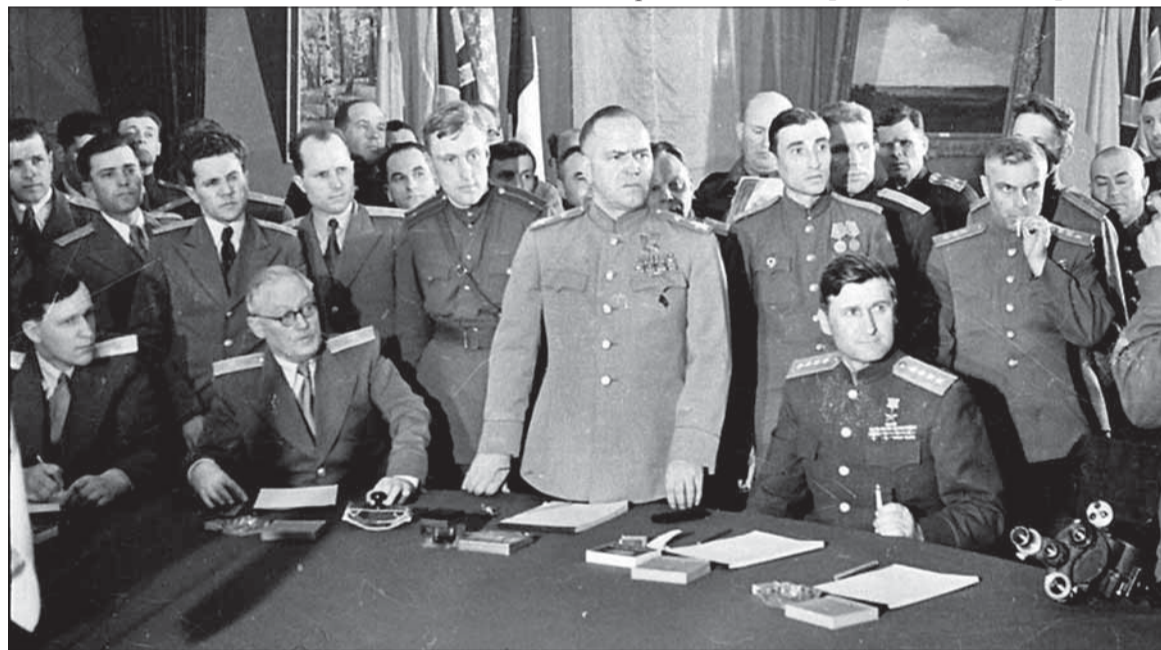
Maršal Georgij K. Žukov podpísal na prelome 8. a 9. mája 1945 za Sovietsky zväz akt bezpodmienečnej kapitulácie nacistického Nemecka.