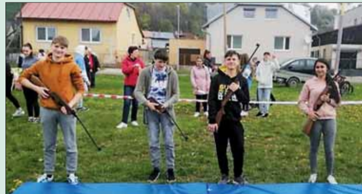
Počas športových hier v Hniezdom sa okrem strelby na kôš strieľalo aj zo vzduchoviek.