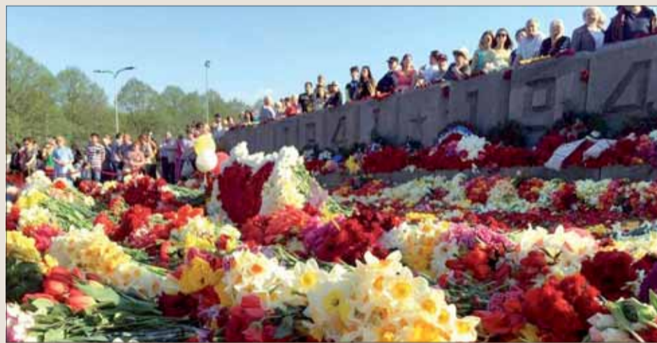
Takto vyzerali oslavy Dňa víťazstva v Rige 9. máj 2006.

zhromaždenie OSN prijalo 22. novembra 2004 rezolúciu, ktorou vyzvalo členské štáty aby 8. či 9. máj využili na uctenie si spomienky obetí 2. svetovej vojny. Zatiaľ čo v Moskve a ďalších krajinách sa bude konať vojenská prehliadka, v Litve budú vlajky potiahnuté čiernou stuhou a stiahnuté na pol žrde. Zákon určuje, aby sa v tento deň z úcty k obetiam dnešného konfliktu na Ukrajine nekonali verejné oslavy. Prítom nemálo ľudí si každoročne hrdlo pri sovietskom vojnovom pamätníku v Rige Paradaguave pripomína 9. mája Deň víťazstva nad fašizmom.