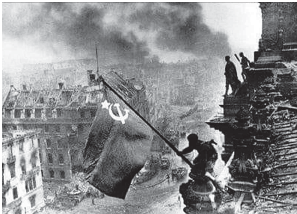
Vitazná sovietska zástava veje nad Reichstágom.

Po dohode hlavného velenia spojeneckých expedičných síl a sovietskeho najvyššieho velenia sa ratifikácia kapitulačného