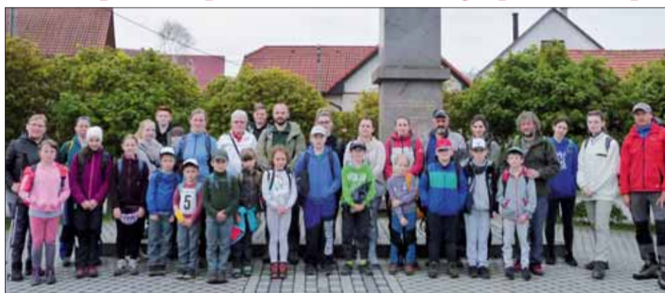
V obci Dobrá Niva si pripomenuli koniec 2. svetovej vojny.