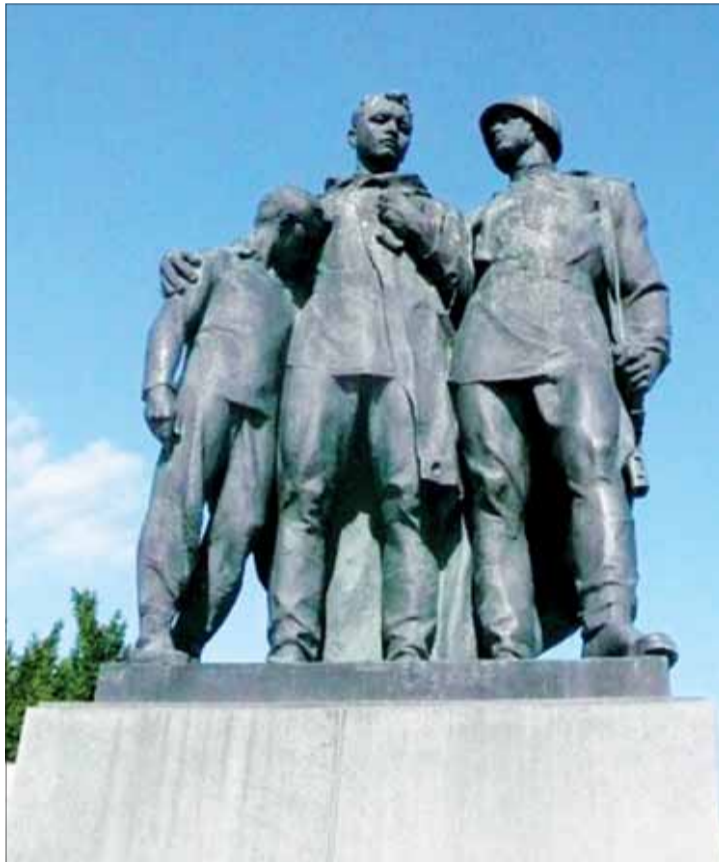
T. Bartfay: Nad hrobom spolubojovníka, súsošie na bratislavskom Slavíne, 1959-60.