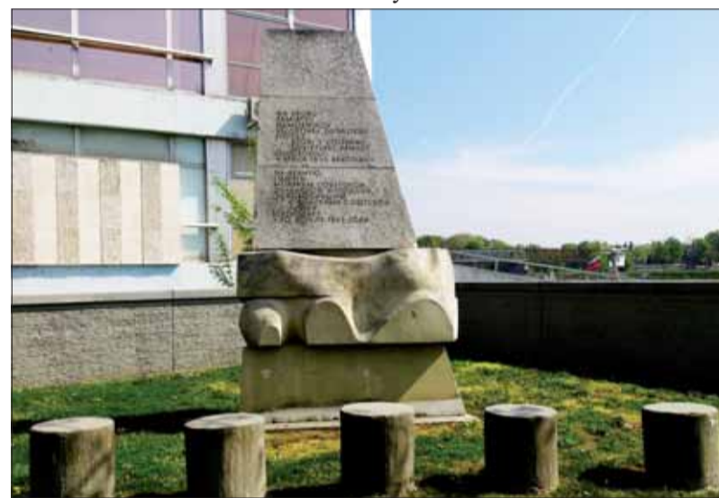
Pomník príslušníkom sovietskej Dunajskej flotily, ktorí sa podieľali na oslobodzovaní Bratislavy.

Po novembri 1989 prišlo hlavné mesto takmer o všetky názvy, ktoré súviseli s bojom proti ľudákemu režimu, fašizmu a za oslobodenie našej vlasti od nacistických okupantov.