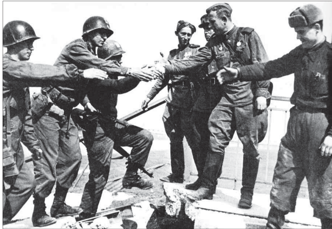
Stretnutie amerických a sovietskych vojakov pri Torgau 25. apríla 1945.

Delegáciu prijal náčelník Eisenhowerovho štábu gen. Walter Badel Smith. Po upozornení, že dohodnúť sa bude možné len na súčasnej bezpodmienečnej