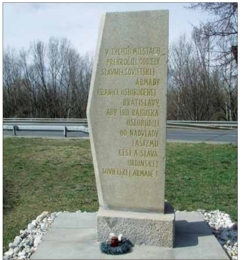
Míľnik osloboditeľom na Viedenskej ceste v Petržalke.

V parčíku medzi Jiráskovou a Romanovou ulicou okoloidú-