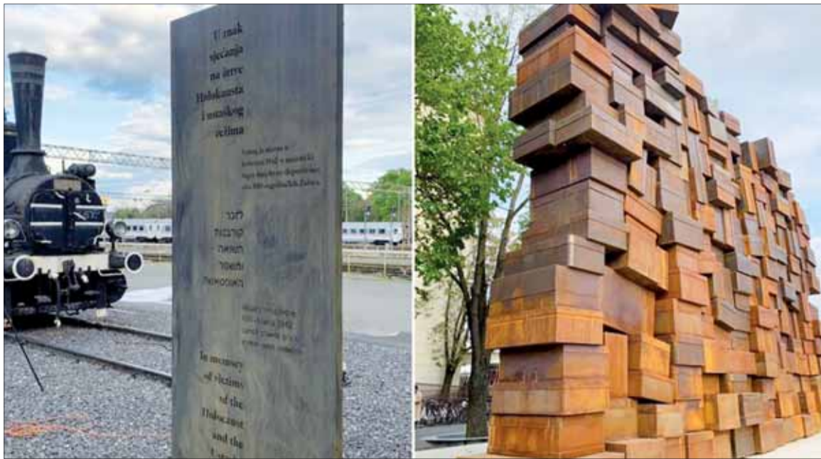
Pamätník židovským obetiam ustašovského režimu pripomína kufre, ktoré deportovaným zobrali už pri nástupe do vlaku.

Svetový židovský kongres obvinil chorvátske úrady z pokusu o „prepisovanie dejín“. „Človek nemôže rozprávať o holokauste v Chorvátsku bez toho, aby nezdržal hlavnú úlohu ustašovského režimu