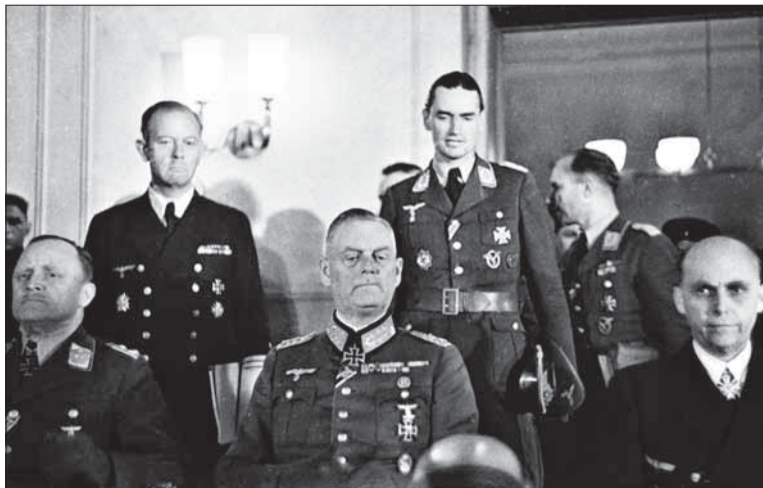
Zľava generál Stumpf, maršal Keitel a admirál Friedeburg pred podpísaním vojenskej kapitulácie Nemecka v Karlshorste.

Tretieho mája sa bez boja vzdala posádka Hamburgu