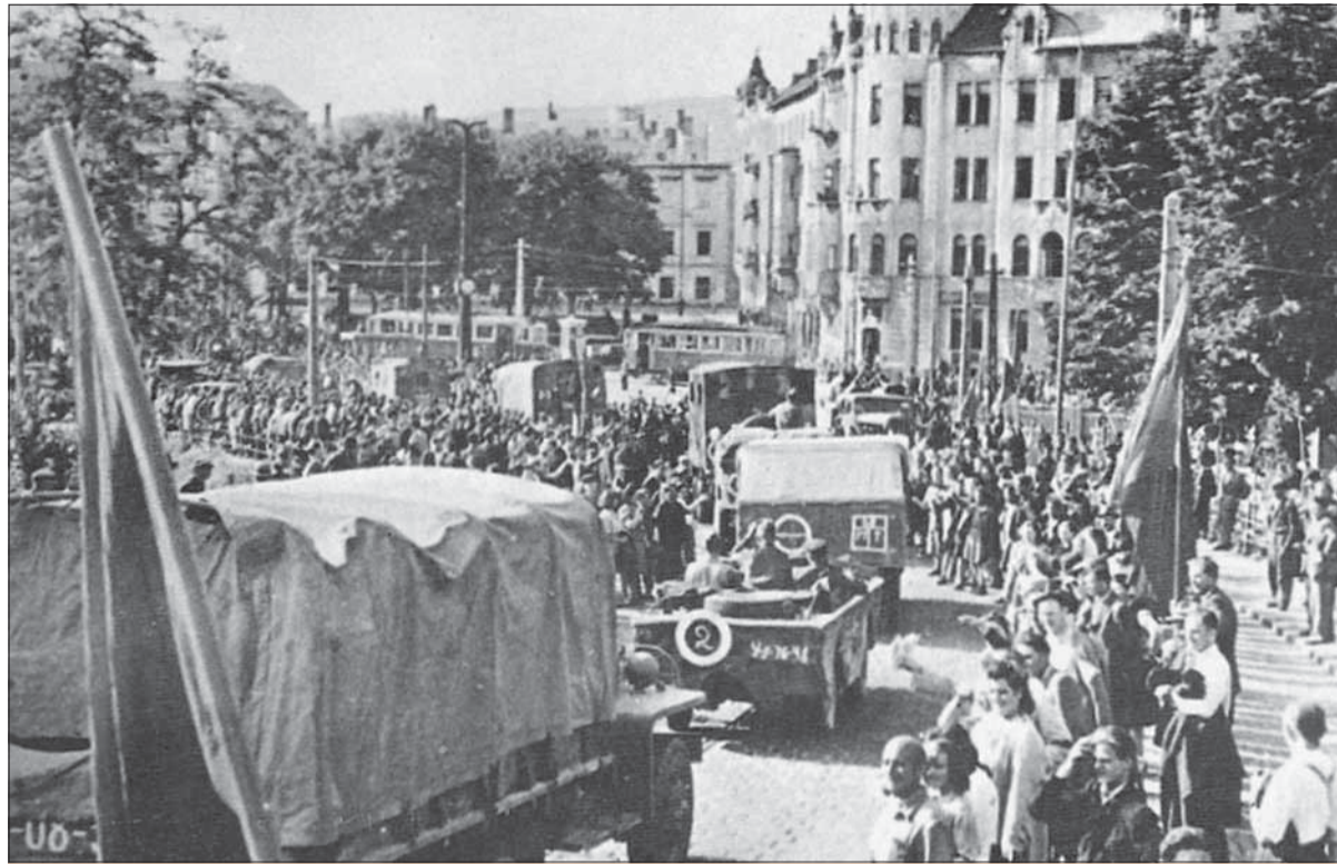
Bratislavčania vitajú osloboditeľov na Šafárikovom námestí.