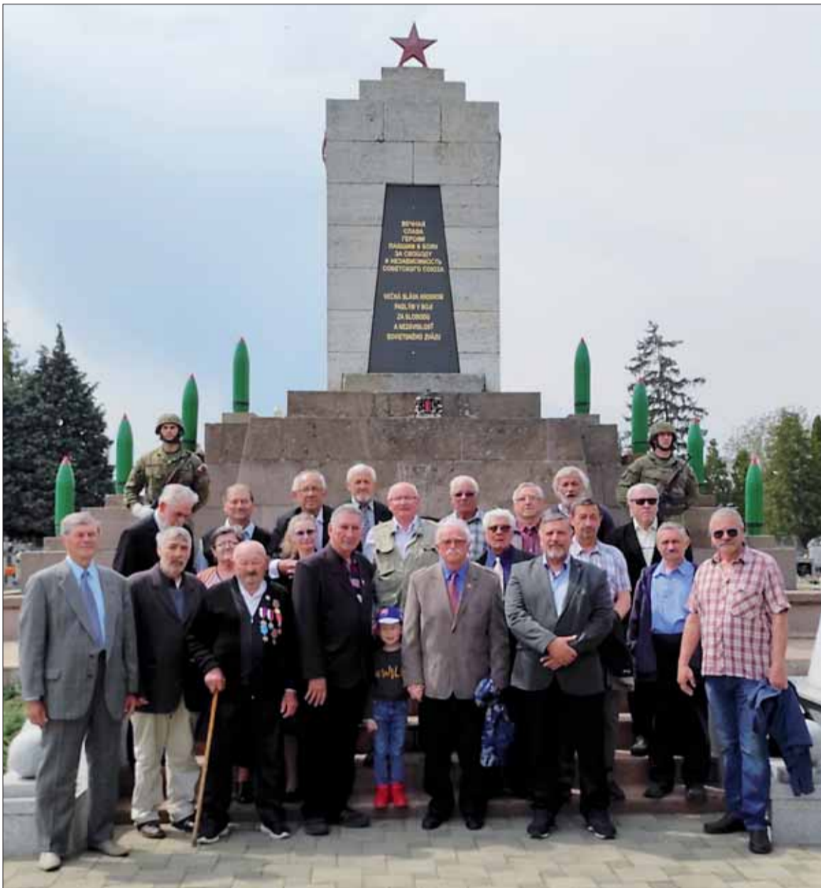
Trebišovčania si uctili pamiatku obetí 2. svetovej vojny pri pamätníku na miestnom cintoríne.

Padlých hrdinov si prišli uctiť predstavitelia štátnej správy, samosprávy, mestských organizácií, zástupcovia Ozbroyených síl SR, členovia Oblastnej organizácie SZPB, ako aj ďalší občania mesta Trebišov.