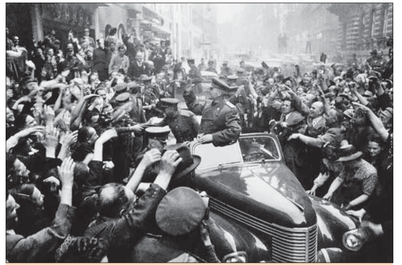
Pražania vítajú 9. mája 1945 svojich osloboditeľov, aj maršala Ivana Stepanoviča Koneva.