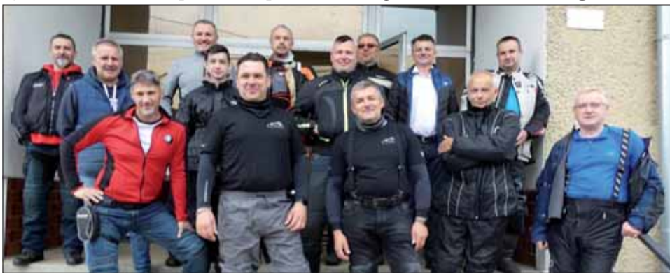
Časť motorkárov v Ostrom Grúni pred odjazdom.

Podujatie sa ukončilo v miestnej lodenici pri dobrom moravskom guláši.