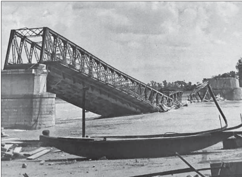
Po fronte 1945, zborený most cez Dunaj.

Na tabuliach v slovenčine, ktoré zrenovovali roku 1977, stálo: