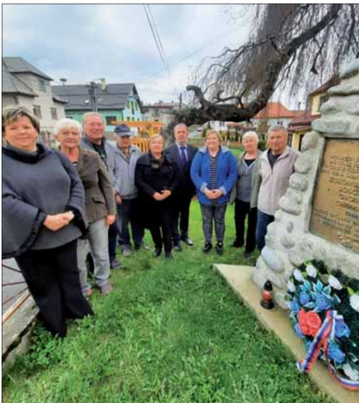
Obyvatelia Liptovskej Kokavy si uctili obete 2. svetovej vojny aj položením vencov k miestnemu pomníku.

Kruté boje v okolí dediny si vyžiadali aj svoje obete. Traja partizáni ostali nezvestní, ďalší ôsmi padli počas bojov. Hrdinské činy občanov Liptovskej Kokavy v období SNP sú zdokumentované v publikácii „Z dejín obce Liptovská Kokava“.