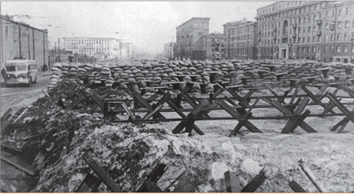
Protitankové zátarasy v Moskve.

Ak sa pozrieme na situáciu nezaujatým pohľadom vojenského experta, tak toto všetko začalo byť zrejme už najneskôr na začiatku posledného týždňa v novembri