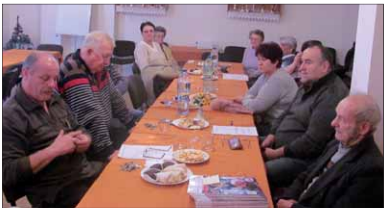
Vpravo dole je „najstarší pokladník SZPB!“

Oblastný predseda P. Brndiar v diskusii poukázal na súčasné nebezpečenstvo radikalizácie neofašizmu, ktorý nachádza živnú pôdu práve v dôsledku migračnej problematiky. Preto je nevyhnutné, aby aj SZPB svoju činnosť zameral vo väčšom úsilí na poukazovanie nebezpečenstva aktivizácie neofašistických strán a hnutí. – JP –