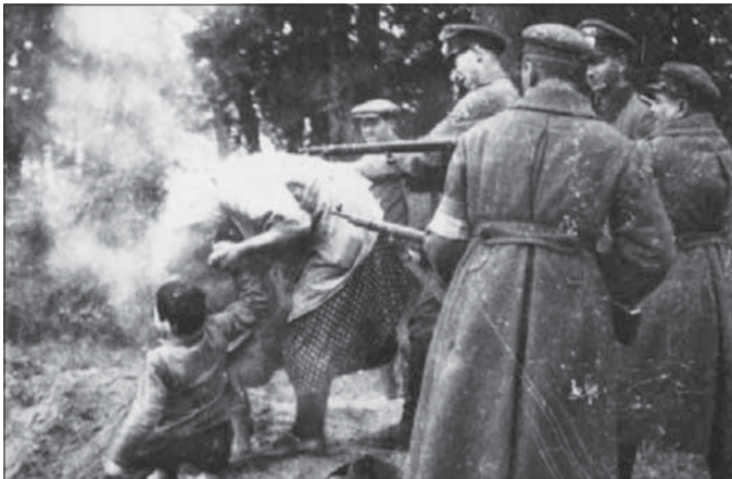
Historická dokumentačná fotografia. „Hrdinovia Ukrajiny“ z pomocných policajných práporov v čase okupácie Ukrajiny počas Veľkej vlasteneckej vojny vraždia židovské deti a matky v obci Miropol v Žitomirskej oblasti.

zložená z idiotov, ktorí nemajú žiaden plán na rozvoj štátu, ekonomiky, kultúry, vedy. Dnešná politická elita Ukrajiny, to sú intelektuálni chronickí impotenti, schopní len deštruktívnych výstupov. Súčasná ukrajinská politická elita – to