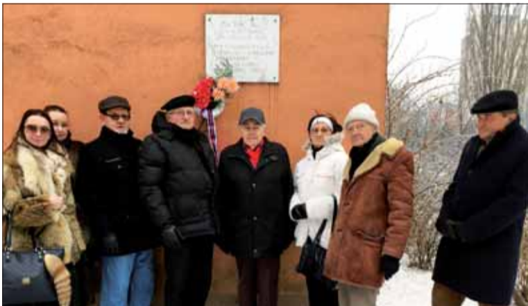
Pri pamätnej doske na Bulíkovej ulici v Petržalke.