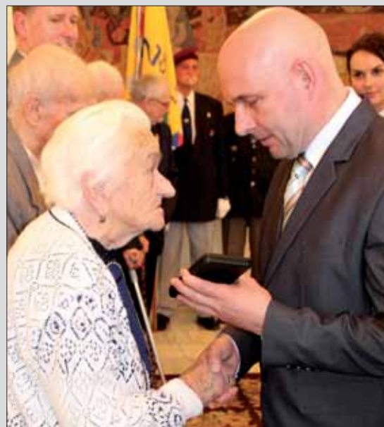
Preberanie vyznamenania v roku 2015.