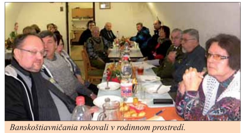
Banskoštiavníckania rokovali v rodinnom prostredí.