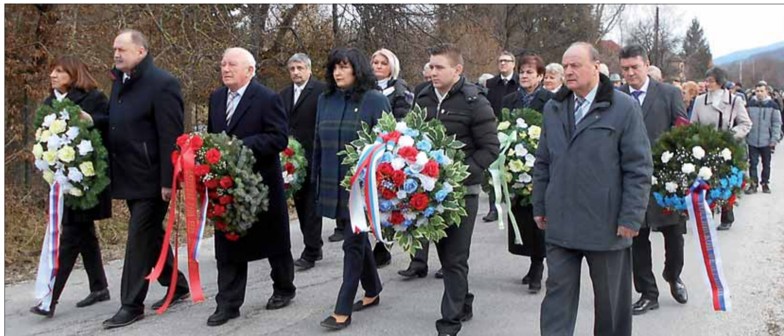
Sprievod od Kultúrneho domu k pamätníku.