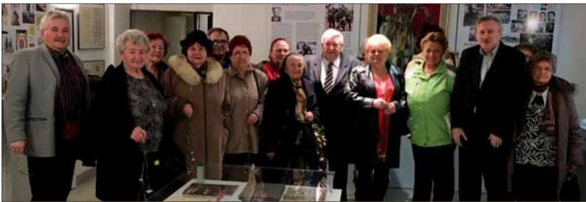
Niektoré funkcionárky ObIV SZPB Bratislava si boli 8. marca 2017 pozrieť aj výstavu Za slobodu.