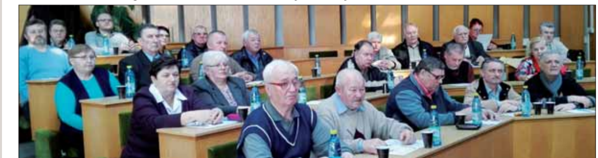
Pohľad do trebišovského pléna.