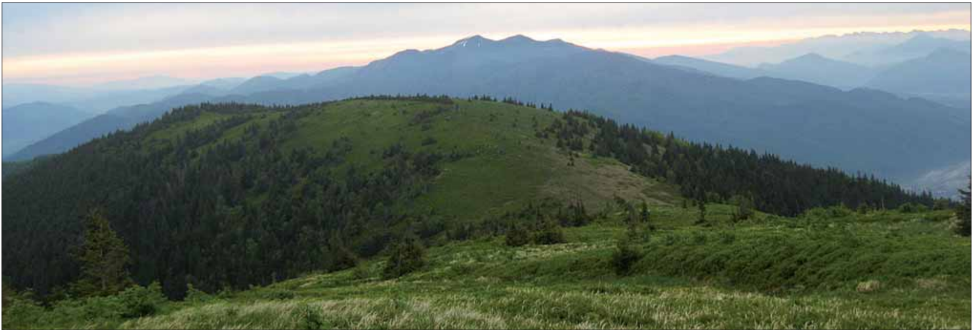
Úplaz je najsevernejší lúčnatý vrch na hlavnom hrebeni Lúčanskej Malej Fatry nad obcou Višňové a Stráňavy.