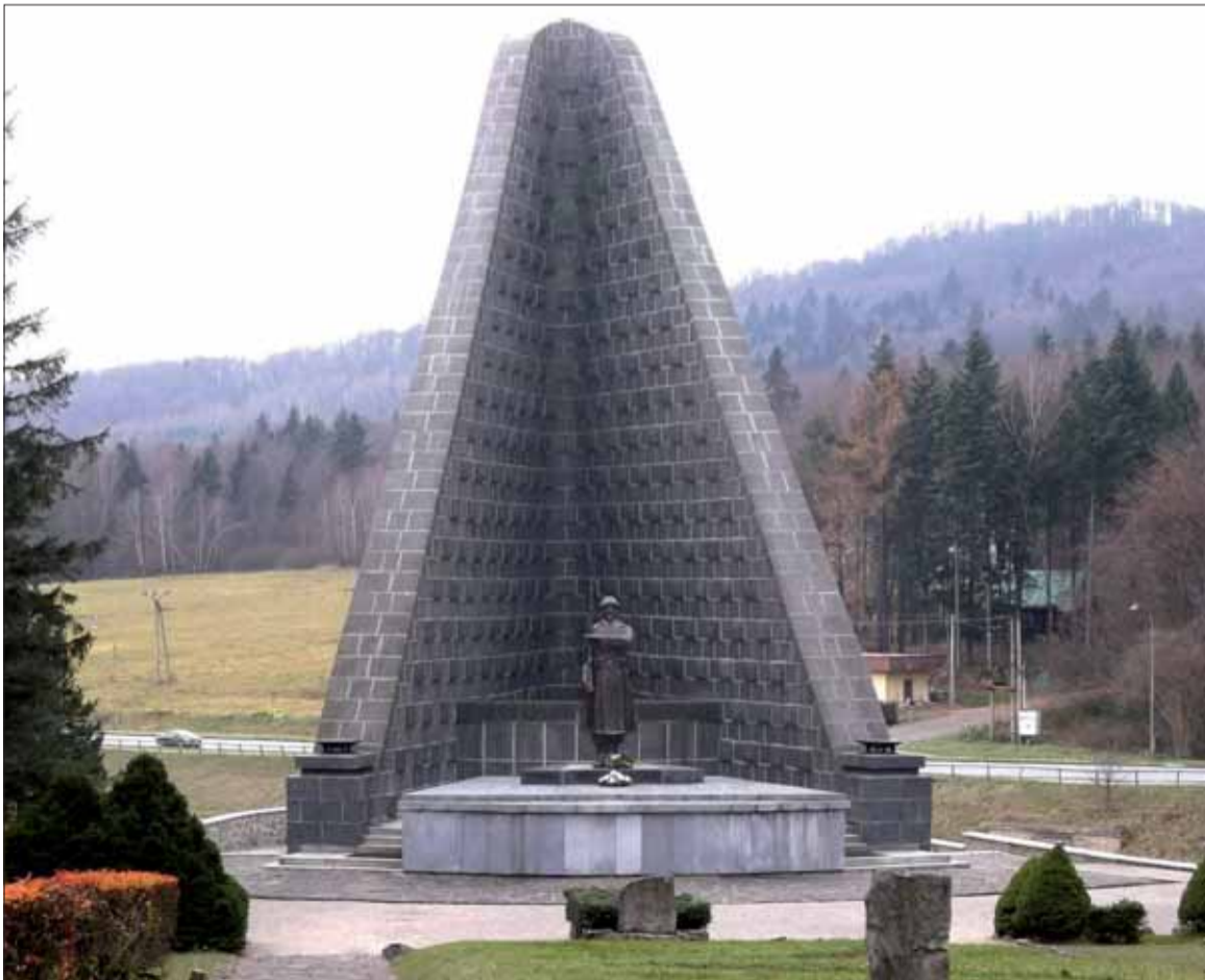
Duklianský pamätník so sochou československého vojaka.