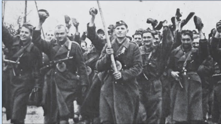
Sami seba sme začali oslobodzovať na Dukle.

žeme pripomenúť aj ďalší 3. máj, tentoraz však z roku 1849, kedy sa uskutočnila intervencia ruských vojsk do Uhorska, čím sa v podstate na dlhé roky oslabila maďarizácia Slovákov.