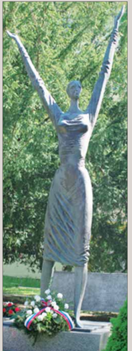
Senica – pamätník oslobodenia.