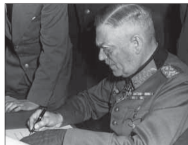
Poľný maršal Keitel podpisuje kapituláciu (8. 5. 1945).

Toto vyhlásenie malo v konečnom dôsledku žiaduci účinok. Dönitz dal súhlas na prijatie mojich podmienok a 7. mája o 02.41 hodín podpísal Jodl v mene nemeckého hlavného veliteľstva do-