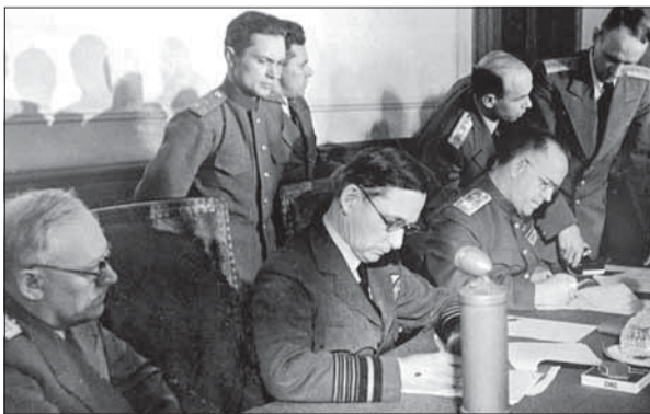
Podpisovanie Aktu o vojenskej kapitulácii Nemecka 8. 5. 1945. Sediaci sprava maršal G. K. Žukov a hlavný maršal britského letectva A. Tedder.