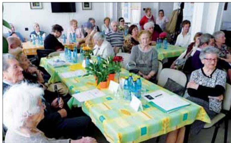
Príbehy veteránov uverejníme v budúcom čísle.