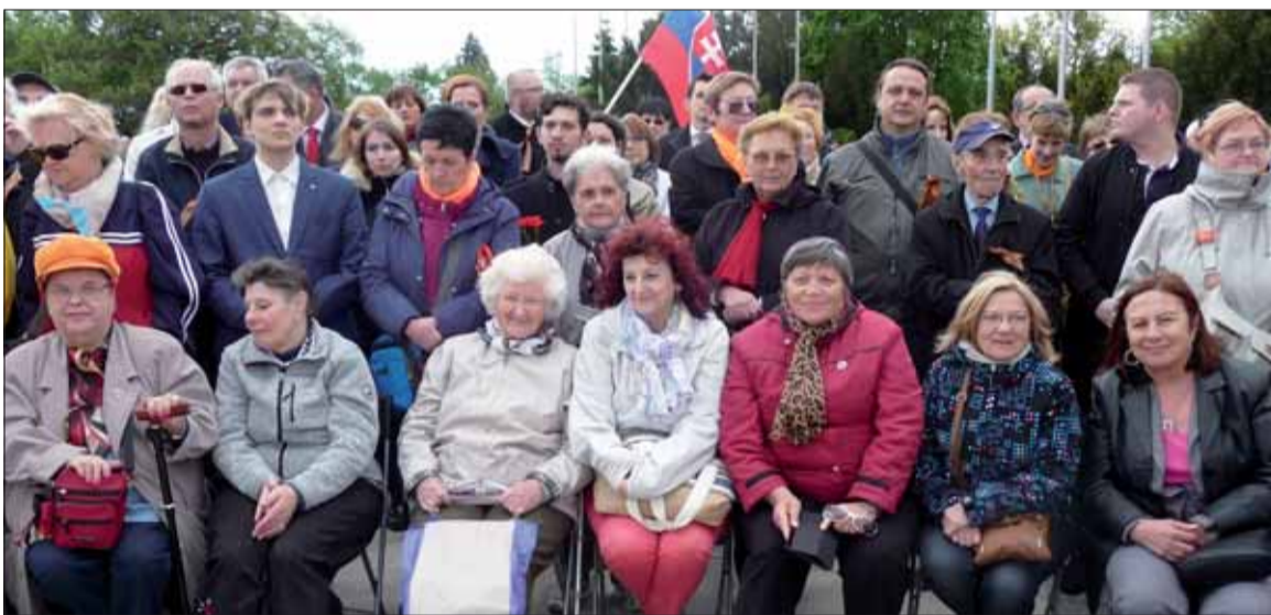
Tu vidíme Banskobystričanov, Zvolenčanov...