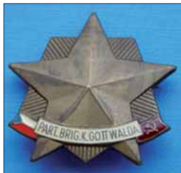
Partizánsky oddiel „Lipa“ patrilo do „Partizánskej brigády Klement Gottwald“.