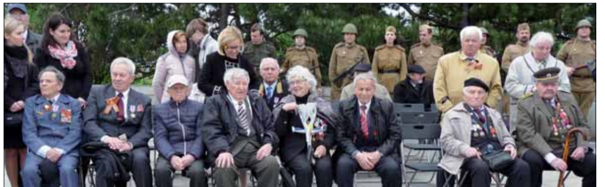
Rednú radu našich veteránov. Na tomto mieste pred dvomi, tromi rokmi sedeli v pár radoch.