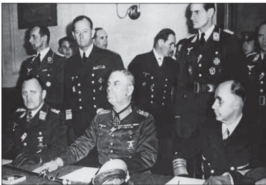
Nemeckí predstavitelia pred podpísaním kapitulácie. Sediaci zľava genplk. Štumpf, poľný maršal Keitel, admirál Friedeburg.