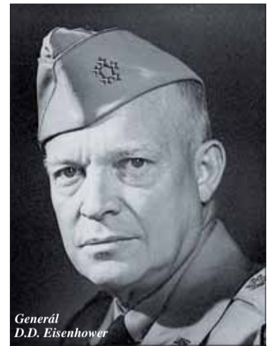
Generál D.D. Eisenhower

Dodatkom k dokladu o vojenskej kapitulácii Jodl podpísal záväzok, že sa náčelník nemeckého hlavného veliteľstva a veliteľia pozemnej armády, námorníctva a letectva dostavia v dobe a na miesto, ktoré určí sovietske najvyššie veliteľstvo a ja, aby nemeckým hlavným velením mohla byť vykonaná formálna ratifikácia bezpodmienečnej kapitulácie. Táto schôdzka sa konala v Berlíne večer 8. mája. Tam za mňa podpísal vrchný letecký maršal Tedder a za sovietske najvyššie veliteľstvo maršal Žukov. Generál Spaatz z amerického letectva a generál de Lattre de Tassigny (v za-