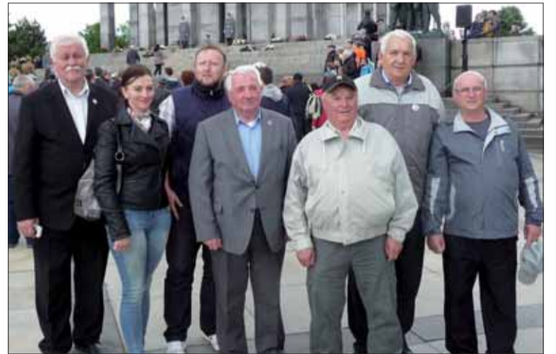
Protifašisti z Brezna, B. Bystrice i Žiaru nad Hronom.