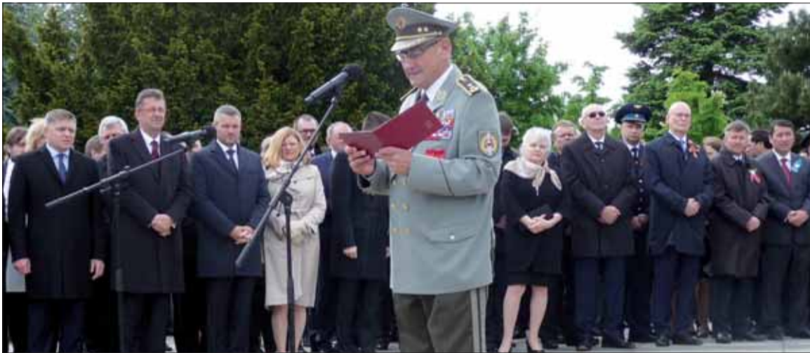
Za SZPB prehovoril podpredsa ÚR SZPB generál Igor Čombor.