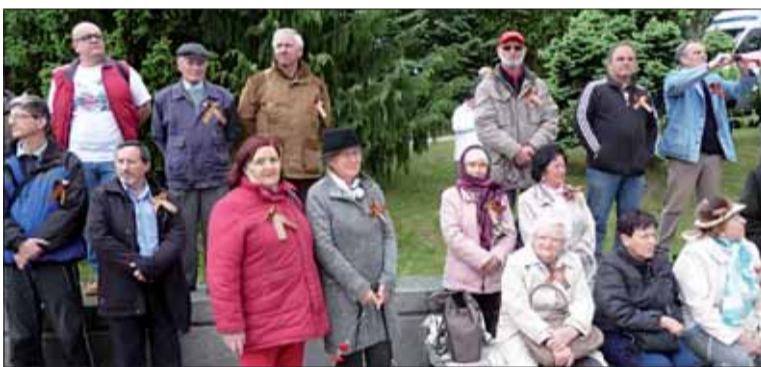
Členovia rôznych bratislavských ZO SZPB.