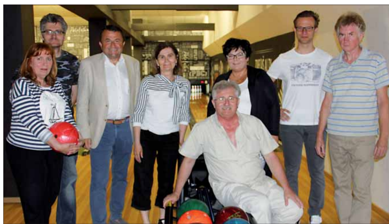
V posledných dňoch jari si niekoľko členov 19. ZO SZPB Bratislava Petržalka bowlingovým zápolením učilo najvýznamnejšiu udalosť tohto obdobia, ktorým bolo 72. výročie Dňa víťazstva nad fašizmom a oslobodenie Petržalky. Petržalská základná organizácia SZPB má z roka na rok bohatší program, osobitne zameraný na školskú mládež, čo finančne podporuje aj petržalská samospráva.