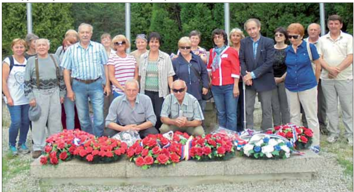
Liptáci na Partizánskom cintoríne v Priekope.