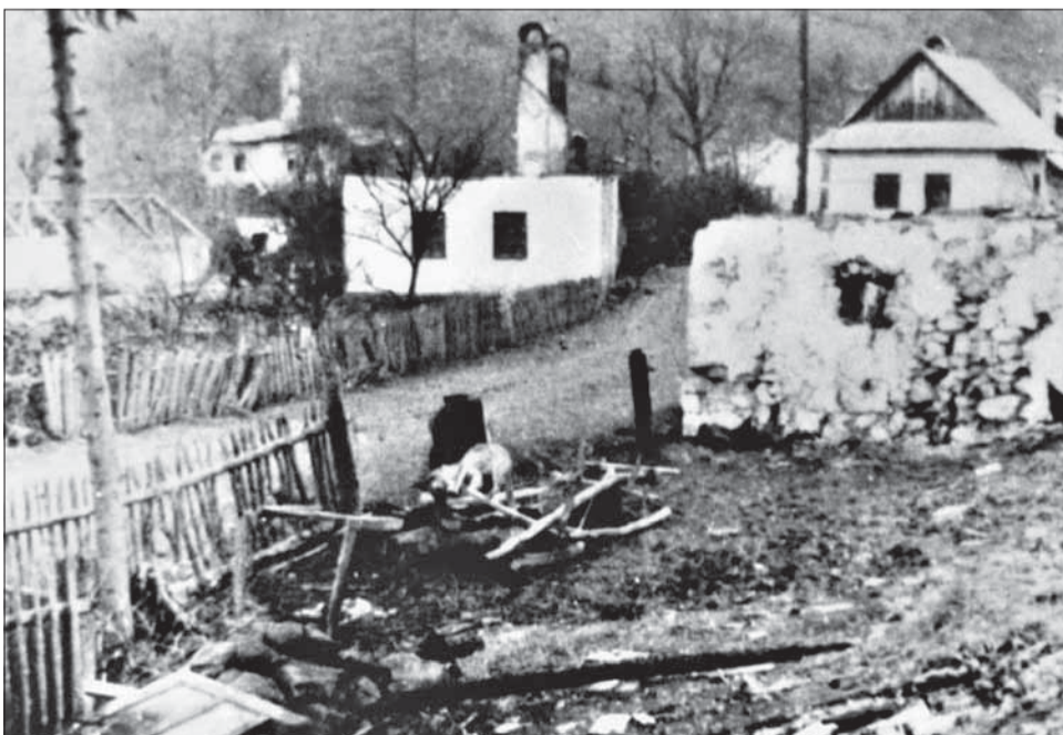
Vypálené domy v Prochoti (marec 1945).

Anne Lagiňovej, č. d. 3 vzali 2 kone, 1 voz, 400 kg ovsa, 5 postelných plachiet, 40 kg fazule, 20 kg maku všetko spolu v cene 75.000 Ks.