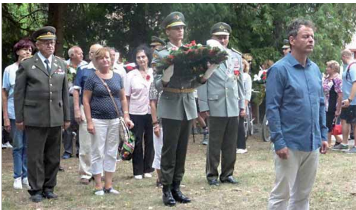
Delegácia SZPB pri kladení venca k pamätníku SNP v Zlatne.