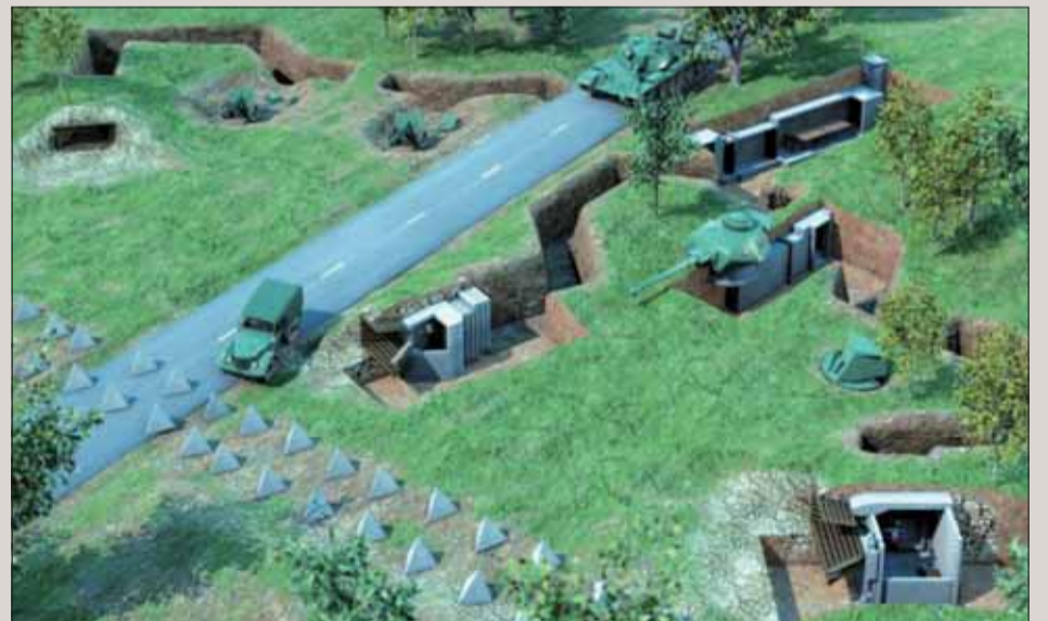
Československá betónová hranica, systém pevností z tridsiatych rokov.