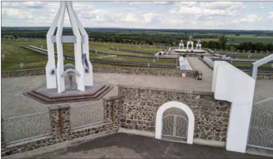
Maďarský vojenský cintorín pri Voroneži.