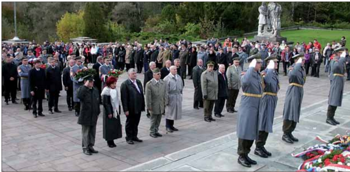
Svidník. Veniec kladie (skupina vpravo) delegácia SZPB i ČSBS.