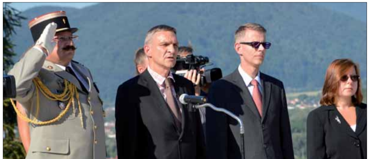
Delegácia francúzskeho veľvyslanectva na Strečne

Regionálne oslavy Výročia SNP žilinskej kotliny sa uskutočnili 25. augusta pri Pamätníku francúzskych partizánov na vrchu Zvonica pri Strečne.