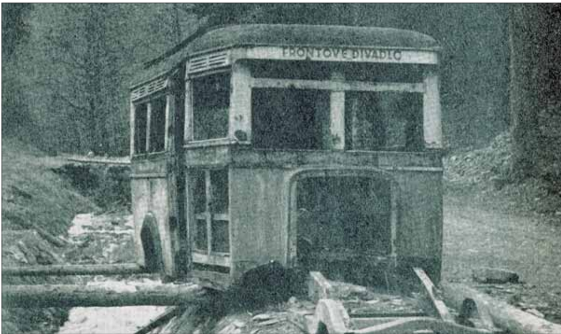
Vrak autobusu Frontového divadla pri ceste zo Starých Hôr na Richtárovú. Stav koncom štyridsiatych rokov.

Literatúra: V. Štefko, Premeny slovenského ochotníckeho divadla, Obzor, Bratislava 1984