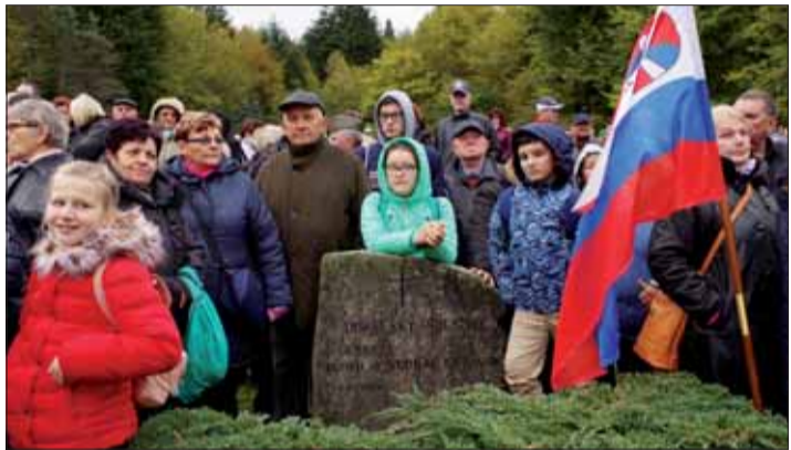
Vďaku za hrdinstvo osloboditeľov tu vyjadrovali tri generácie.