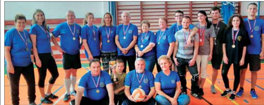
Športovci ocenených družstiev.