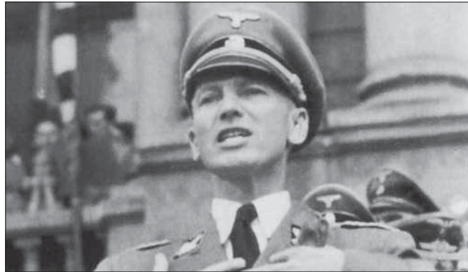
S myšlienkou zostaviť vojenský útvar z haličských dobrovoľníkov prišiel guvernér haličského dištriktu Otto von Wächter, ktorý navrhol vytvoriť divíziu zbrani SS predurčenú na nasadenie na východný front.