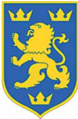
14. Waffen-Grenadier-Division der SS (galizische Nr. 1)

Podľa HSP, 12. 11. 2017 (krátené), ilustrácie: Internet