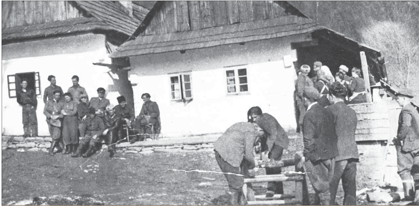
Partizáni v Kľaku.