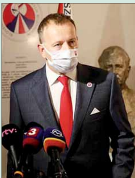
Predseda NR SR Boris Kollár (Sme rodina) počas návštevy v SZPB.