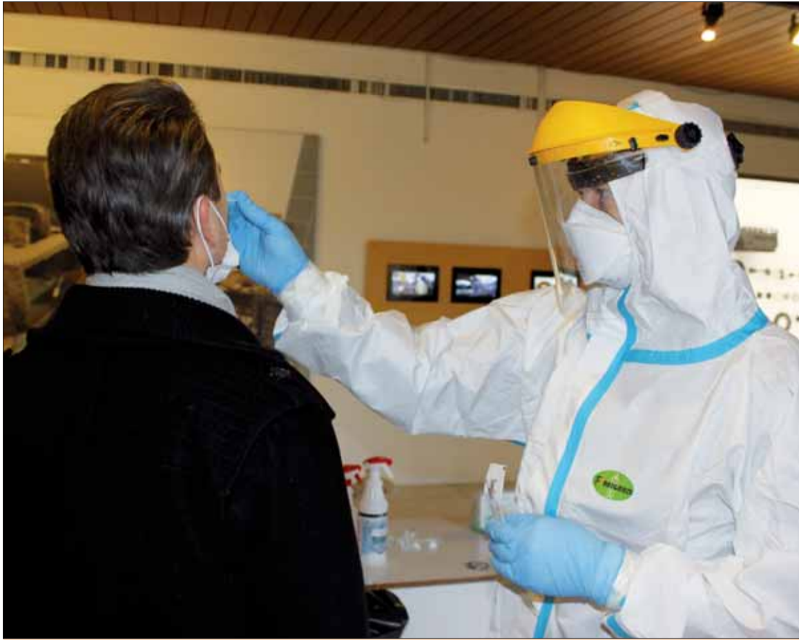
Testovanie na nový koronavírus.