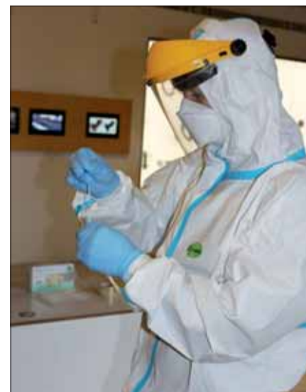
Antigénové testovanie na COVID-19.