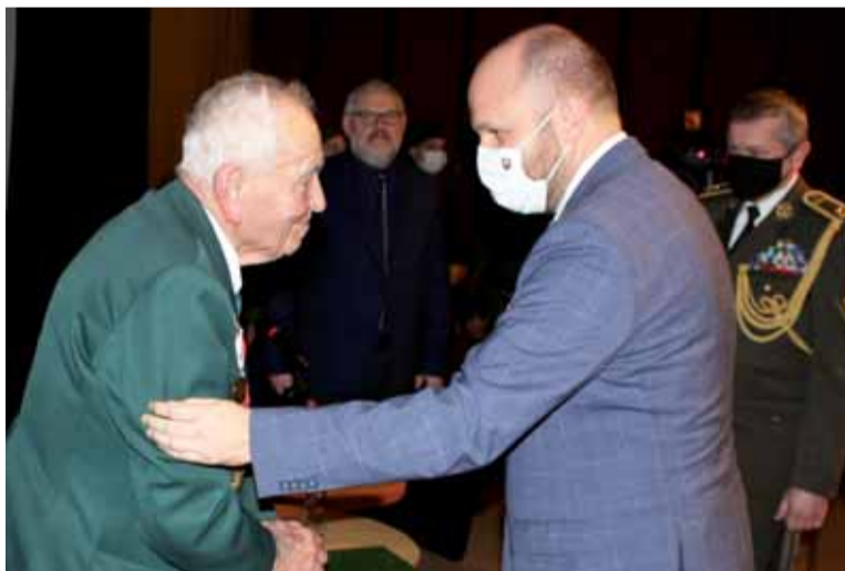
Minister obrany Jaroslav Nad' povyšil hrdinu SNP do hodnosti nadporučík.

Film Mlčanie premiérovu uvedie RTVS na Jednotke v Deň víťazstva nad fašizmom, 8. mája 2021 večer.