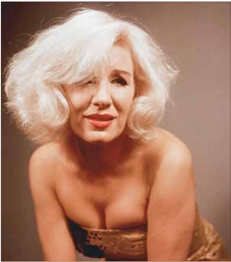
Maggie alias Marilyn Monroeová v hre Arthura Millera Po páde – 1964.