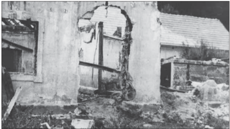
Vypálená škola v Ostrom Grúni.

Koncom apríla sa uzavreli aktivity jednotky Jozef. Aj vysadzovanie diverzných skupín do českého pohraničia sa ukázalo ako iluzórne, jej štáb začal myslieť skôr na vlastnú bezpečnosť než na plnenie stanovených úloh. Ich činnosť sa nepodarilo utajiť. Zostali za nimi masové hroby a od-