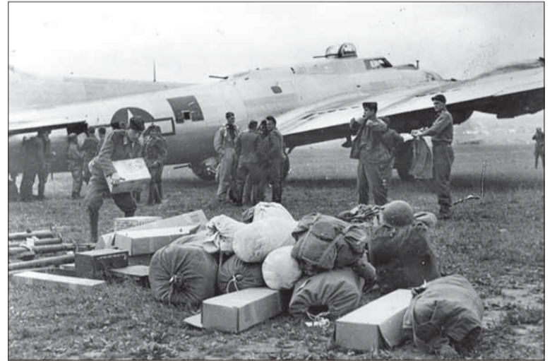
Vykládanie zásob z lietadiel.

(Dokončenie z č. 22, krátené a medzititulky red. Bojovníka)