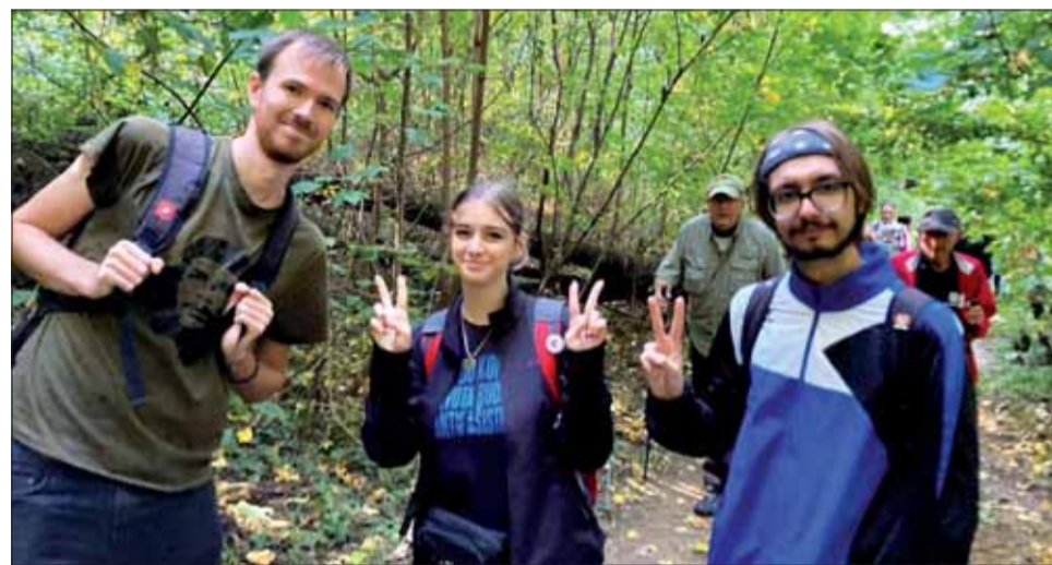
Aktívni mladí antifašisti sú prísľubom pre budúcnosť SZPB. Z antifašistického výstupu na Zobor.