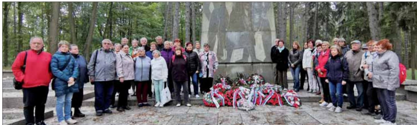
Účastníci spomienkovej akcie v Trenčíne a okolí.

Na spomienkovej akcii sa zúčastnili členovia zo ZO Prievidza, HBP a. s. Prievidza, Malinovej, Bojníc, Lehoty pod Vtáčnikom, Partizánske, Žabokreky nad Nitrou a Dolné Vestenice.