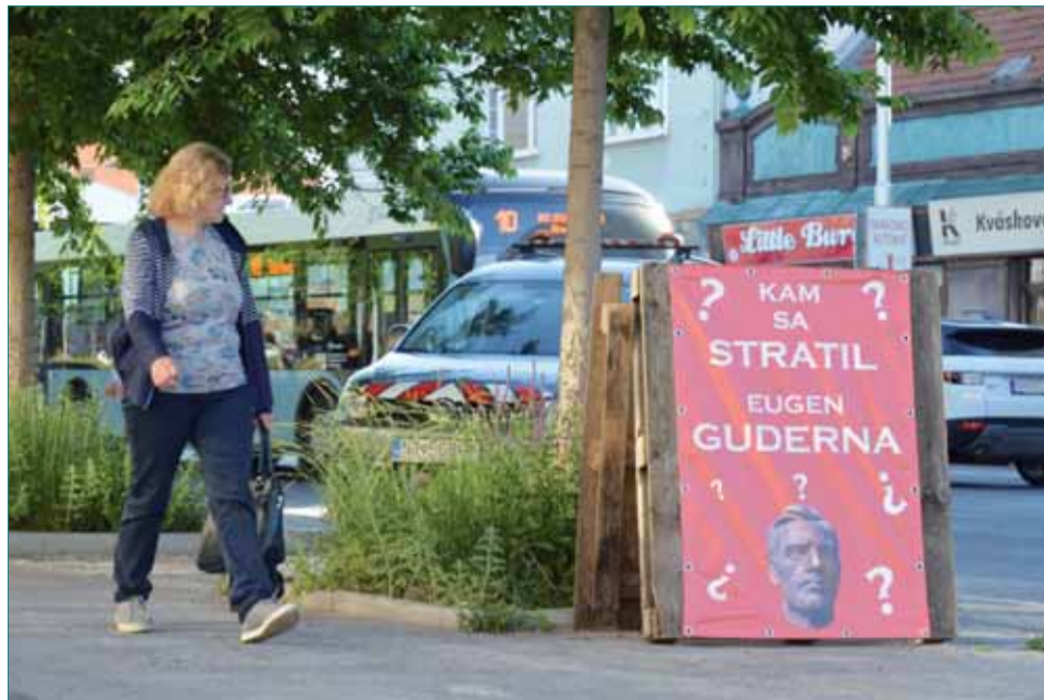
Petičný výbor zvolil nápaditú propagáciu už od samého začiatku.