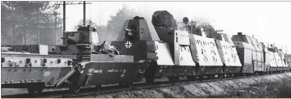
Nemecký Panzerzug 61 bol nasadený aj na východe Slovenska.

Za hlavnú príčinu nedostatočného stavu príprav Východoslovenskej armády na ozbrojené vystúpenie v lete 1944 možno považovať nejednoznačný postoj SNR v určení veliteľa týchto vojsk (gen. Augustín Malár verzus plk. Viliam Talský), tiež nepochopiteľne dlhú váhavosť