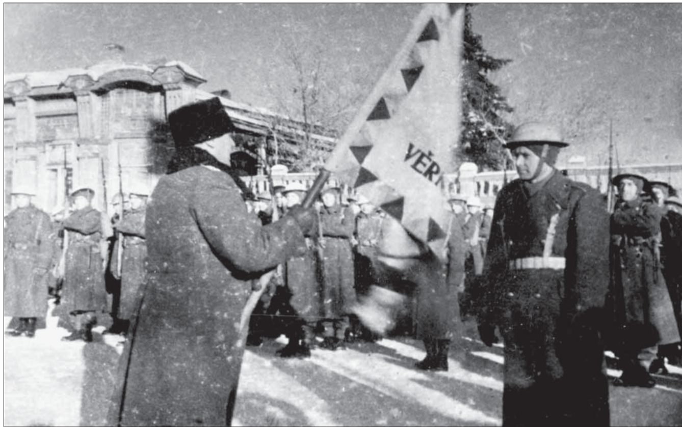
V januári 1943 Heliodor Píka odovzdal v Buzuluku pred odchodom na front pplk. Ludvíkovi Svobodovi bojovú zástavu 1. čs. samostatného poľného práporu v ZSSR.

Bez medzinárodnej spolupráce by sme boli v dnešnej dobe stratení. Zaslúži si napriek určitým pozitívam vyššiu intenzitu. Existujú na to možnosti, treba ich však rozumne využívať. Existujúce vzťahy, dohody, memorandá a zmluvy so stranami a organizáciami na Slovensku a v zahraničí potvrdzujú, že SZPB je rešpektovanou spoločenskou organizáciou. Je nevyhnutné ich zveľaďovať a naďalej rozvíjať.