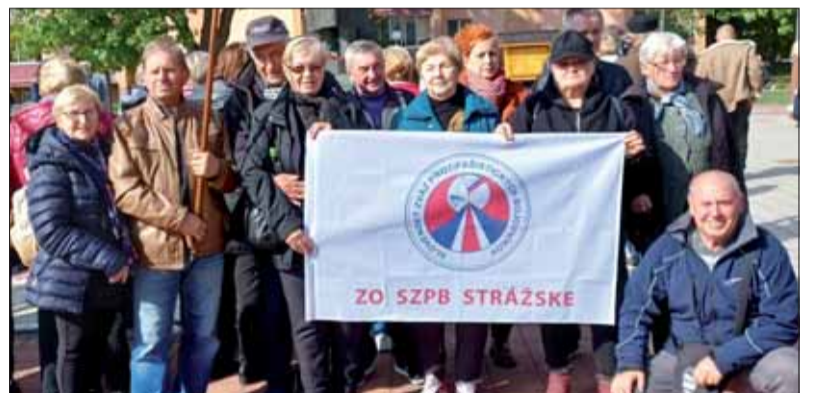
Časť účastníkov pripomenky Karpatsko-duklianskej operácie.