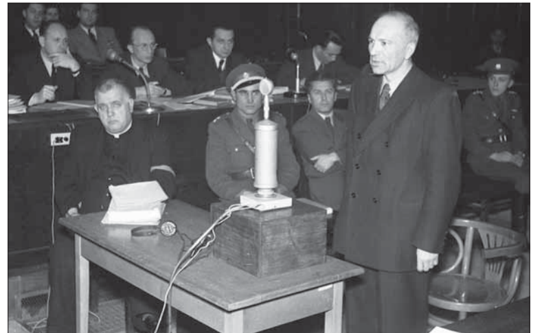
Ferdinand Čatloš, bývalý generál Slovenského štátu, vypovedá v procese proti Jozefovi Tisovi, 14. január 1947.