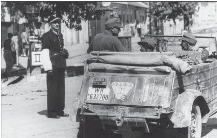
Slovenský žandár sleduje príchod nemeckých vojsk na východné Slovensko.