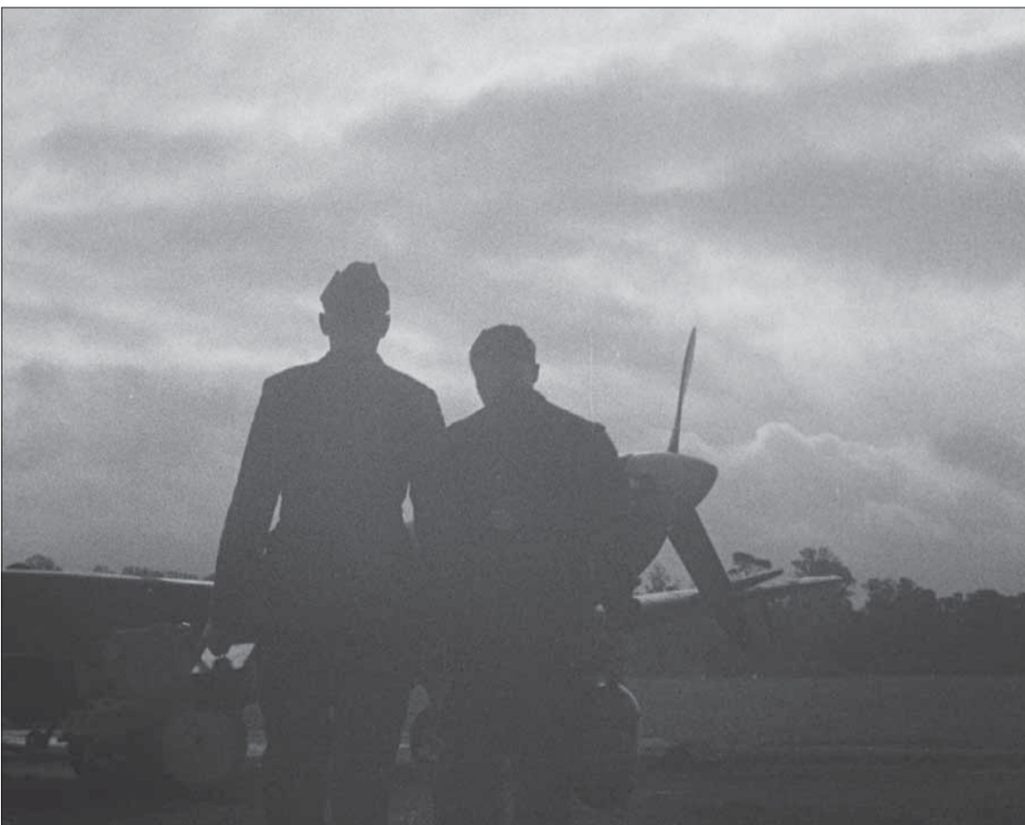
Vojnoví hrdinovia mali ťažké osudy aj po oslobodení.

vzdorovať. Dosť často sa stretávam s tým, že moje umelecké výstupy neprídu niekomu dostatočne korektné. Nie, že by som bol hrdý, na to, že sa to deje, no ak sa to niekomu javí ako nekorektné, mám čisté svedomie a s ním sa snažím neuhýbať podobnej kritike. Podľa mňa tam nič toxického nie je a jednoducho je to pohľad doby, presnejšie niektorých jej čitateľov.