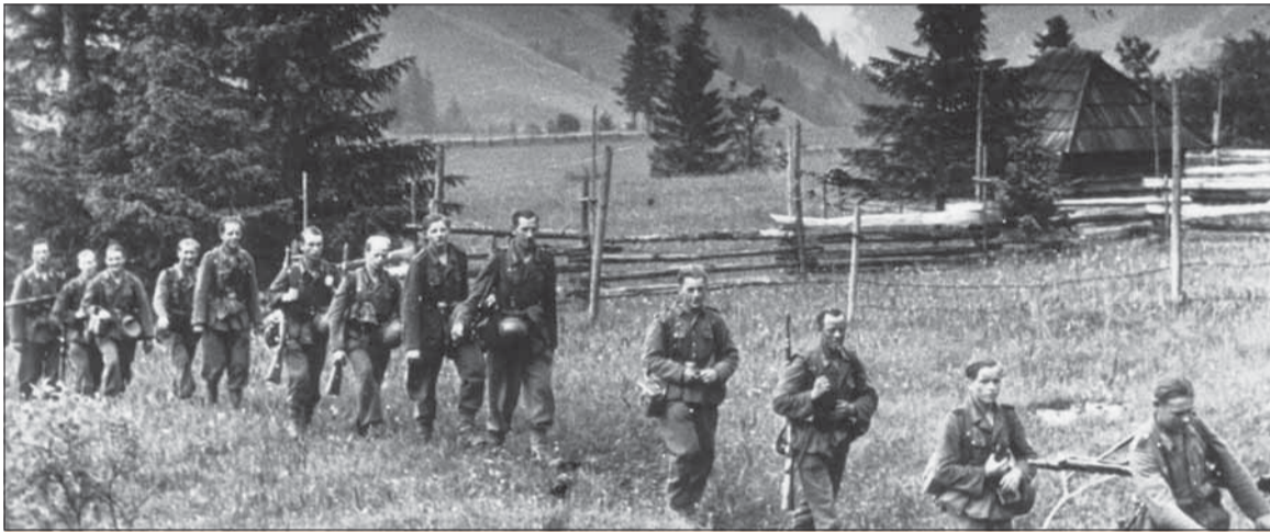
Nemeckí vojaci v Karpatoch, august 1944.

Hlboké znepokojenie Benešovej exilovej vlády z utajovania delegácie zo Slovenska sovietskymi úradmi a skryté po-