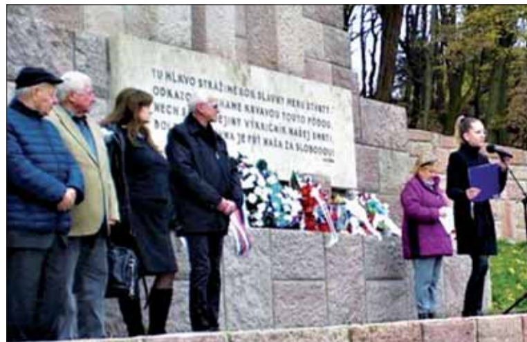
Mladí ľudia zohrali pri spomienke v Kremničke aktívnu úlohu.

Vyzývame v ňom najvyšších predstaviteľov nášho štátu i širokú verejnosť, aby „aktívne podporovali všetky aktivity zamerané k potlačaniu prejavov neofašizmu, neonacizmu, xenofóbie, netolerancie, extrémizmu, antisemitizmu, terorizmu, skresľovaniu a prekrúcania historických faktov. Zvýšené napätie v spoločnosti ukazuje, že sa to celkom nedarí, preto je aj úlohou SZPB svojou činnosťou prispievať k zmierneniu polarizácie prezentovaním pozitívnych príkladov z radov svojich členov a ich