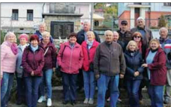
Organizátori Stretnutí generácií pred pomníkom padlých v 1. a 2. svetovej vojne v Ľubietovej.

Najvýznamnejším cyklickým podujatím oblasťnej organizácie SZPB v Banskej Bystrici býva Stretnutie generácií na Kališti. Tohto roku sa uskutočnil jeho 16. ročník za zmenených podmienok. Múzeum SNP ako hlavný z viacerých usporiadateľov už patrí pod ministerstvo obrany, s čím sa obmenilo personálne obsadenie zabezpečenia.