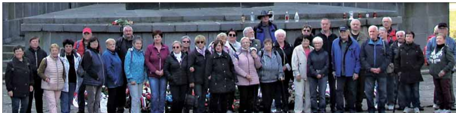
Členovia SZPB z Revúcej na Dukle.