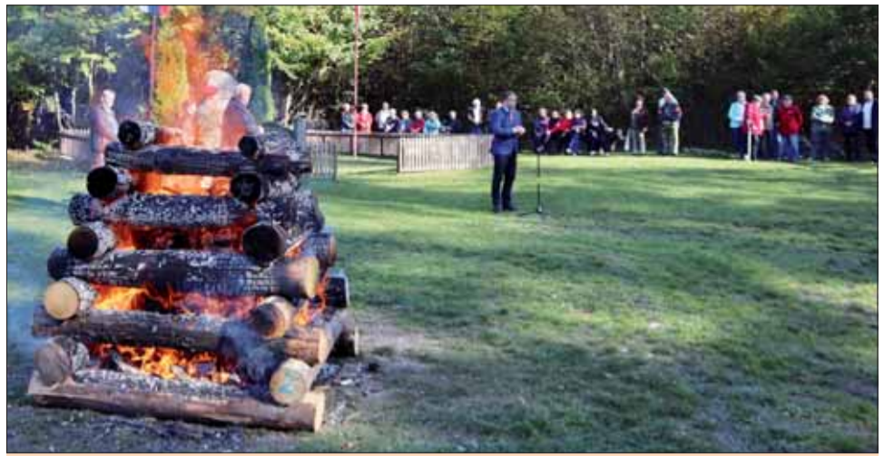
Odbojárska vatra sa už tradične rozohorela na Švábe pri Krupine.

Potom súťažili štvorčlenné družstvá z krupinských ZŠ a SŠ a zo ZŠ s MŠ v Bzovíku a Dobrej Nivy. Okrem kvízu o 2. sv. vojne a SNP, žiaci a študenti strelali zo vzduchovky, zúčastnili sa na zdravotníckej príprave a hádzali granátom. Na prvom mieste sa umiestnili študenti Gymnázia Andreja Sládkoviča v Krupine (získali 35,5 bodov) pred žiakmi zo ZŠ s MŠ Juraja Slávika Neresníckého z Dobrej Nivy (35 b) a ZŠ Eleny Maróthy-Šoltésovej v Krupine (34 b). Ďalšie tri miesta a diplom za účasť získali ZŠ Jozefa Cíge-