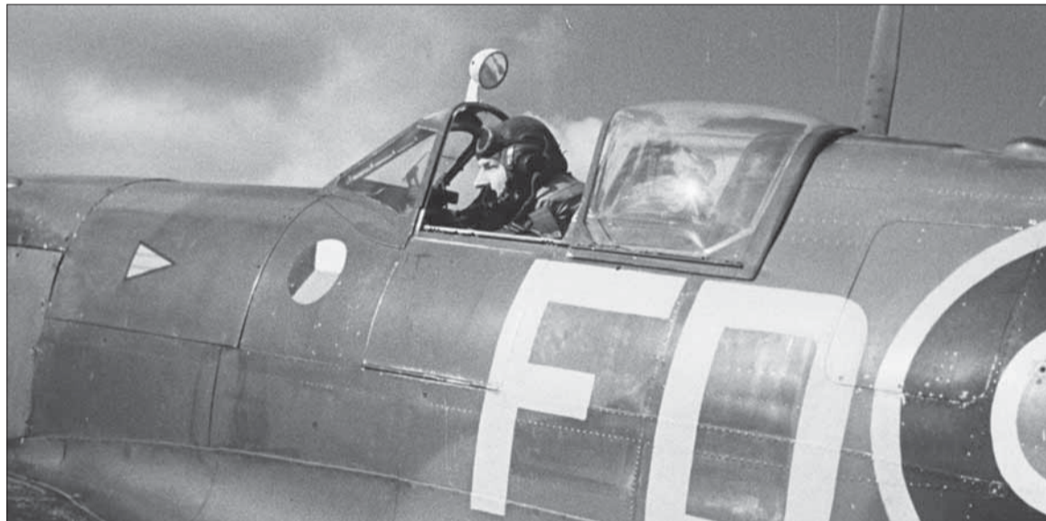
Pohľad do kokpitu československých lietadiel vo Veľkej Británii.

Druhá rovina je, že každá vojna je hrozná a prináša so sebou nesmiernu dávku utrpenia a zmaru, čo je vo filme dobre vidno, že človek začne byť po čase navený a nemôže dlhodobo tú záťaž znášať. V prípade Fajtla a Jánskeho príchod únavy trval pomerne dlho, no my ani v poriadnej vojne sami nie sme, ale únava z neďalekého konfliktu sa dostavila už po niekoľkých mesiacoch. Spoločnosť je skrátka slabšia, menej koherentná. Po prvotnom