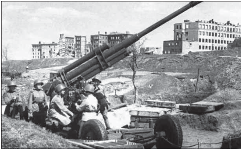
Sovietski delostrelci v Stalingrade.

Keď Erenburg v memoároch Ludia, roky, život spomína svoju vojnovú žurnalistiku, pripúšťa: „Možno zo všetkého najviac nenávidím fašizmus, nielen preto, že to bola absurdná, barbarická myšlienka, ale aj preto, že nás naučil nenávidieť.“ Jeho práca v najťažších obdobiach vojny slúžila ako silný faktor pri mobilizácii národov ZSSR a Červenej armády, aby porazili Nemecko.