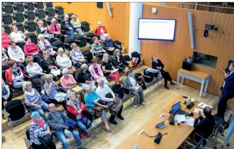
Národná banka Slovenska realizuje v spolupráci s Jednotou dôchodcov Slovenska finančné vzdelávanie seniorov.

Účet v banke môžete mať aj úplne zadarmo. Okrem komerčných balíkov služieb, ktoré banky ponúkajú klientom pri zriadení bežného účtu, existujú aj tzv. legislatívne účty alebo účty zriadené zo zákona. Je to služba, ktorú môžu využívať občania s obmedzenou výškou príjmu, prípadne tí, ktorým vyhovuje jednoduchý objem finančných operácií a nemajú záujem o širšie balíky. Bezplatný účet je výhodný napr. aj pre dôchodcov.