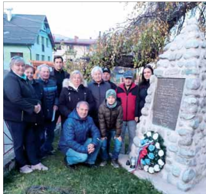
Účastníci podujatia v Liptovskej Kokave.