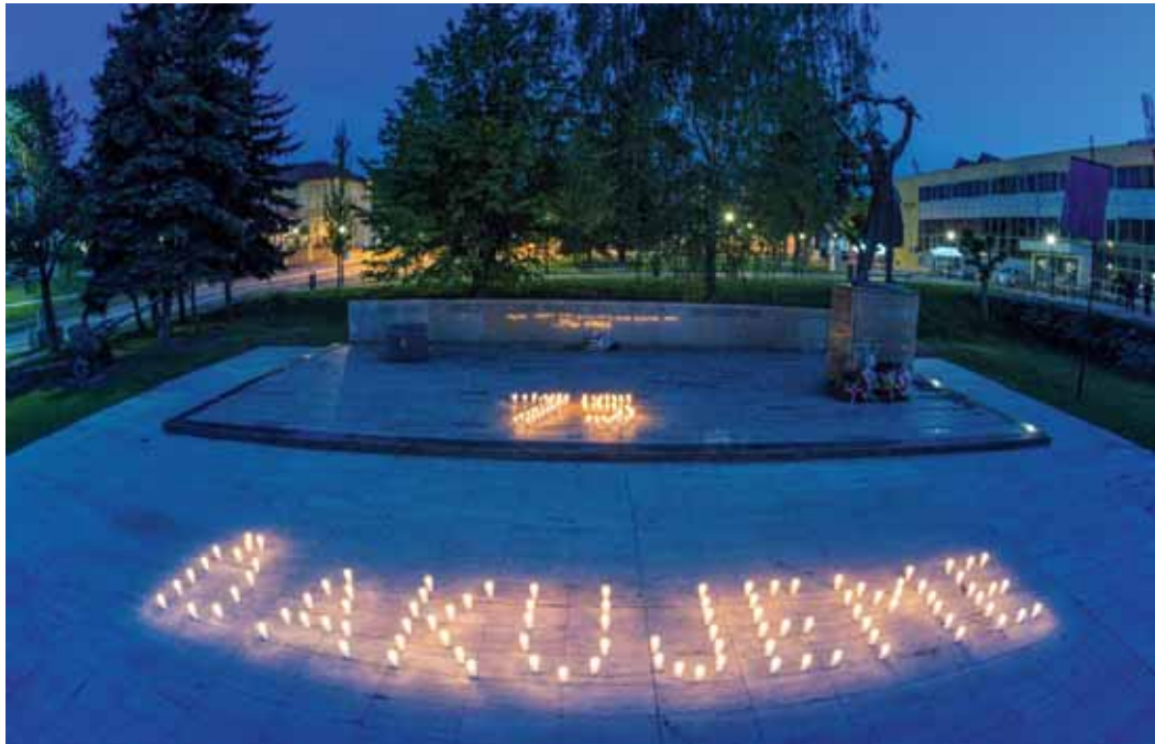
Nech naďalej vyjadruje náš národ vďaka osloboditeľom za porážku fašizmu a nacizmu.

*majdany – chyžky (boli roztrúsené na lúkach a stráňach a stali sa dobrým úkrytom a útočiskom pre partizánov)