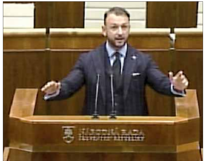
Matúš Šutaj Eštok (Hlas-SD) predložil návrh, aby SZPB dostával od štátu aspoň 500-tisíc eur.

Matúš Šutaj Eštok pre Bojovník vysvetli, že „Hlas-SD by poctivo zodpovedal za SZPB aj bez zmluvy o spolupráci, ale to, že sme ju podpísali je pre nás záväzok, ktorý nás núti konať, nielen hovoriť.“ Preto sa politič-