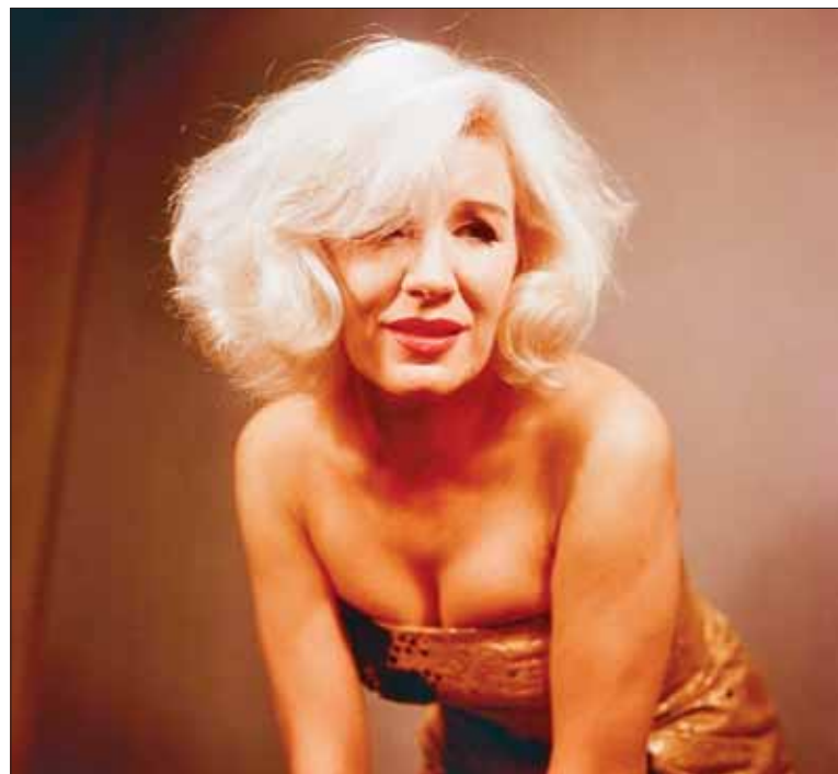
Maggie alias Marilyn Monroeová v hre Arthura Millera Po páde (1964).