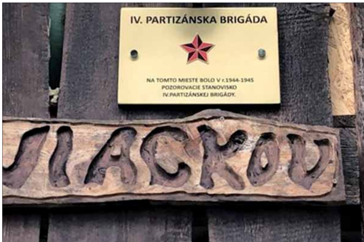
Pamätná tabuľa na IV. partizánsku brigádu na Holom vrchu, časť Viackov (Liptov).