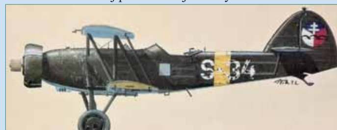
Dvojplášnik Letov Š. 328