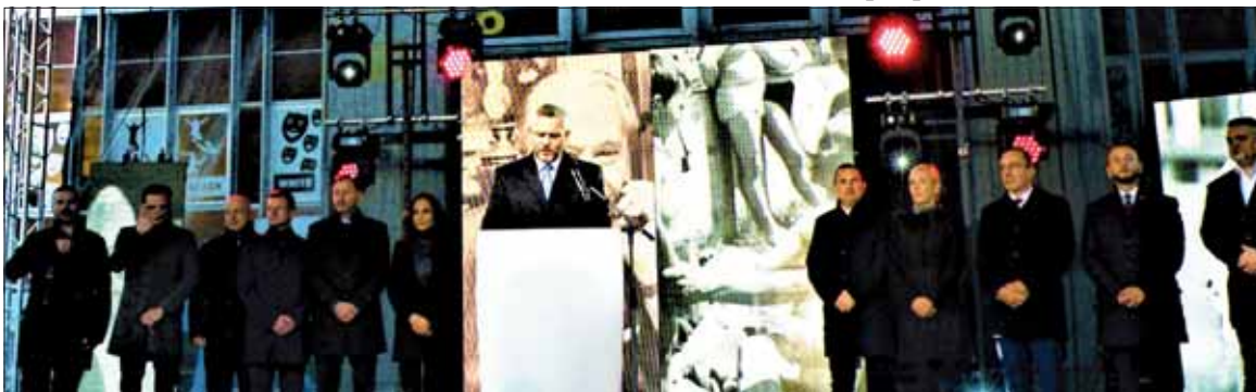
Petra Pellegriniho sprevádzali najbližší spolupracovníci z vedenia strany Hlas SD a Trenčianskeho kraja.