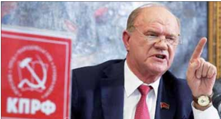
Predseda Komunistickej strany Ruskej federácie Gennadij Zjuganov.

Predseda ruskej komunistickej strany zverejnil tvrdú kritiku kremelskej zahraničnej politiky. Genadij Zjuganov na ruskej sociálnej sieti Telegram vyhlásil, že „hanba na Ukrajine“ je dôsledkom kapitalistickej oligarchickej politiky ruských vládov od rozpadu ZSSR. A upozornil, že „ruské impérium“ v minulosti prehrávalo dôležité vojny.