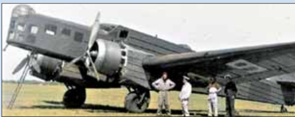
Bombardovacie lietadlo Bloch MB-210.