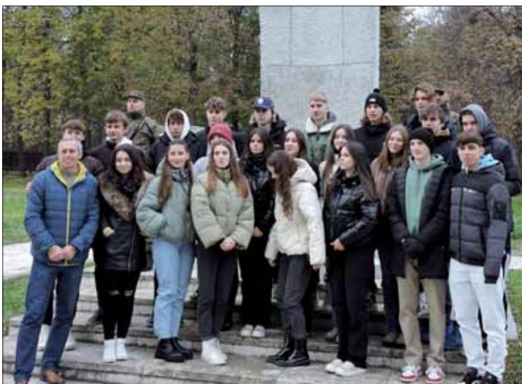
Mladí ľudia pri pamätníkoch osloboditeľom sú vždy potešením pre členov SZPB.