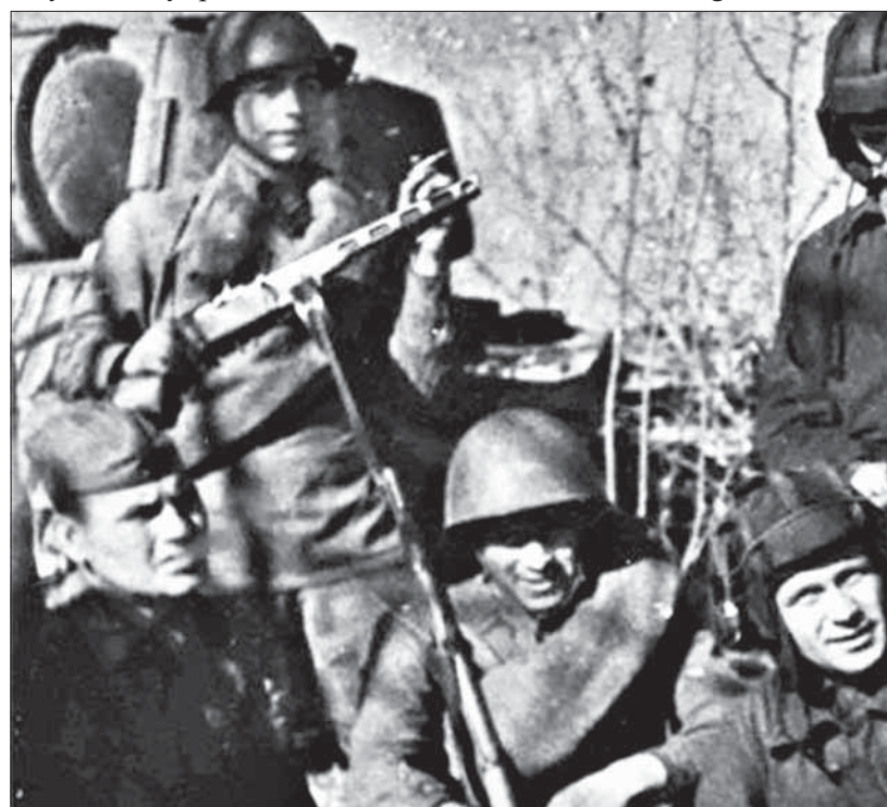
Erenburg medzi sovietskymi tankistami roku 1942.

Ilja Erenburg o fährovi tzv. tisícročnej ríše: „Prečo v Nórsku a Grécku plačú vdovy? Prečo bol vypálený Rouen, zničený Belehrad, Rotterdam? Hitler povedal: Zničím celý svet. Na jeho pokyn zlikvidovali fašistickí letci stovky pozoruhodných pamiatok svetovej architektúry. Nenávidí všetky národy sveta: potrebuje mučiť a ničiť. Svojmu priateľovi Hermannovi Rauschningovi povedal: Keby nebolo Židov, museli by si ich vynájsť – len krutosť človeka približuje k hnutiu. O Francúzoch napísal: Toto sú černosi, treba ich obmedziť. Hitler sa mstí Čechom: jeho nevlastná matka bola Češka. Vyhlásil: Sú to slovanské svine! Nenávidí najmä Rusov. Tento samolúbby kretén nazval Leva Tolstého bastardom. Hitler opovrhuje aj nemeckým ľuďom. Strasserovi povedal: Naši pracovníci nechcú nič iné ako chlieb a cirkusy – nemajú žiadne ideály.“