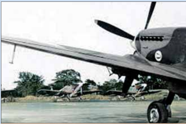
Lietadlá 312.čsl. stíh. perute.

V Martine absolvoval v r. 1939 poddôstojnícku školu. Z ČSR odišiel 17. 2. 1940 a ako vojak sa dostal do strediska v Belehrade. Vstúpil do československej armády