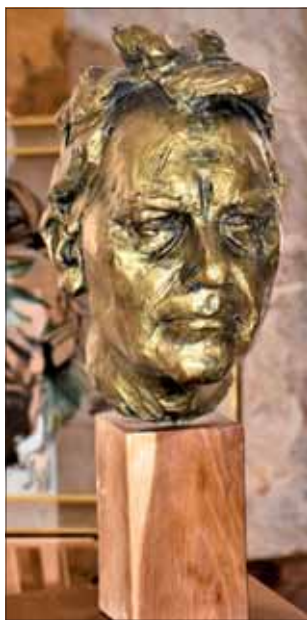
Ján Kulich, Laco Novomeský, portrét