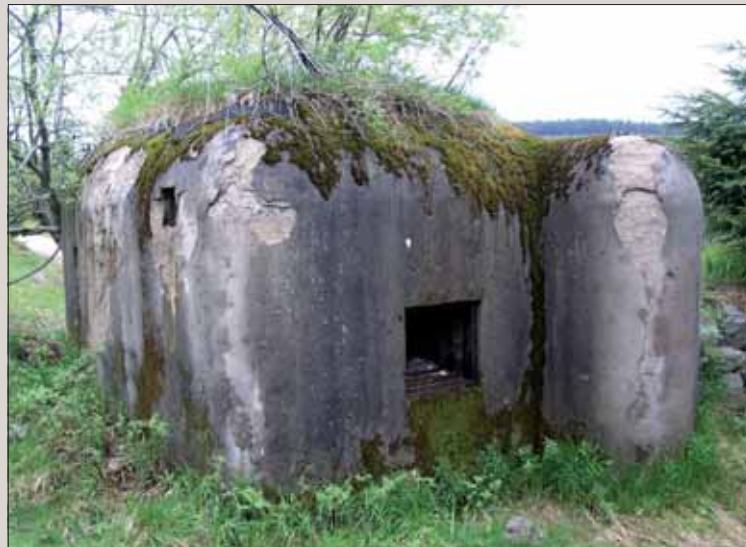
Ropik, ľahké opevnenie vz. 37.

ich však mala, aj keď celkom nedostačujúci počet: k 23. septembru 1938 mala k dispozícii 2000 ks protitankových mín, ale tie neboli určené do predpolí pevností.