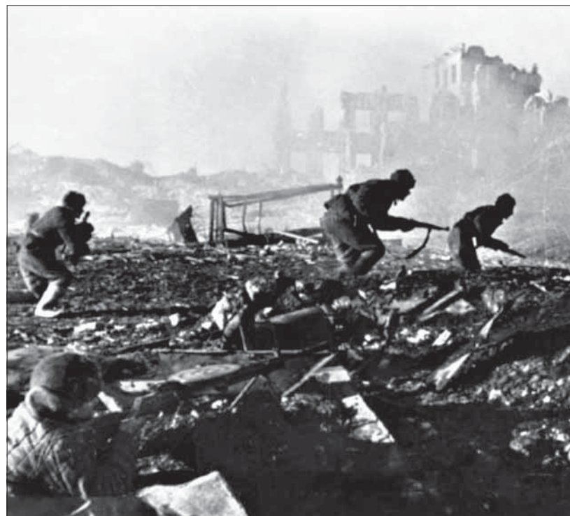
Aj v Stalingrade ako v Leningrade sa bojovalo o každú dom.

Počas bojov pri Stalingrade v správe Sovinformbyra 24. novembra 1942 uviedol: „Bitka o Stalingrad predstavuje pre Hitlera niečo viac ako jednu z bitiek: tu je v stávke prestíž fähre-