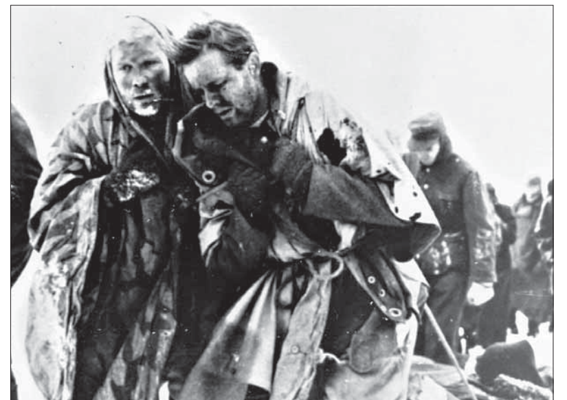
Takto skončili nemeckí okupanti v Stalingrade.

Skresleniu historicky spoľahlivých dejín druhej svetovej vojny treba čeliť vedecky overenou históriou skutočných udalostí toho dramatického a hrdinského obdobia.