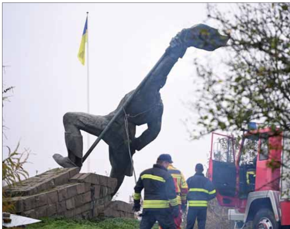
Ukrajinský vojak ČA, osloboditeľ od nacistických okupantov, na dnešnej Ukrajine zjavne nemá miesto.

Krajina takto pomaly nahrádza tradíciu Veľkej vlasteneckej vojny novou tradíciou boja s Ruskom. Bolo to vidieť aj v uliciach inak vojnou nedotknutého Užhorodu. Na reklamných plochách sa nachádzali heslá podporujúce ukrajinskú armádu, na niektorých aj nacionalistické heslá ako „Ukrajina nadovšetko“. Z niekoľkých okien dokonca viseli aj čierno-červené vlajky odkazujúce na Bandevu Ukrajinskú oslobodzovaciu armádu. Aj takáto je realita súčasnej vojny zmietanej Ukrajiny, pred ktorou si v Bojovníku nezakrývame oči.