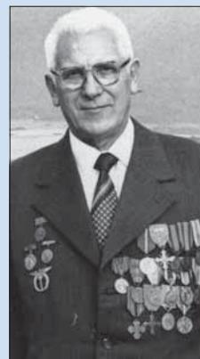
...a neskôr ako oceňovaný povstalecký hrdina

Lietal na jednom z dvanástich bojaschopných slovenských lietadiel.