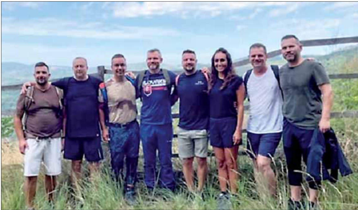
„Delegácia“ Hlasu-SD na 34. ročníku pochodu SNP Zlatno-Skýčov.