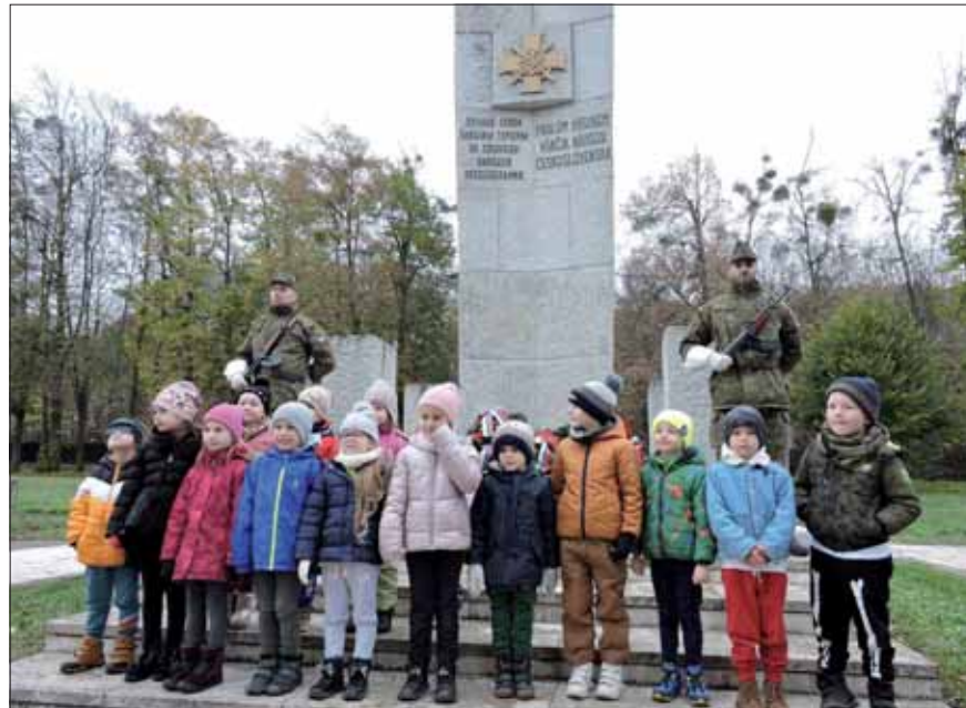
Spomienkové eseje sú umeleckou formou, ako vychovať v deťoch úctu k tradíciám protifašistického boja. SZPB dbá, aby deti poznávali aj všetky pamätné miesta.