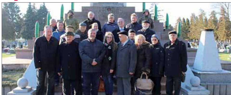
Členovia SZPB a ďalší hostia pred pomníkom v Trebišove.