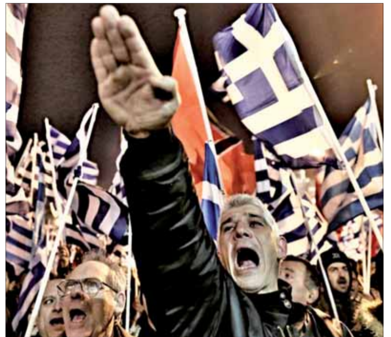
Grécki tzv. vlastenci na nacistickej demonštrácii Zlatého úsvitu.