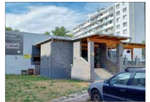
V budove s adresou Rybníčná 61 bola niekedy reštaurácia.

„Býva vo Vajnorochoch, pri učilišti BEZ vo Vajnorochoch,“ ozrejmujeme nám jeho kolega z AVB, keďže predseda ZO už mobil nezdvihá. Nuž, Vajnory sú síce celkom inde ako Vrakúňa, no zašli sme aj tam. Ulica sa volá Rybníčná. Adresu na Rybníčnej