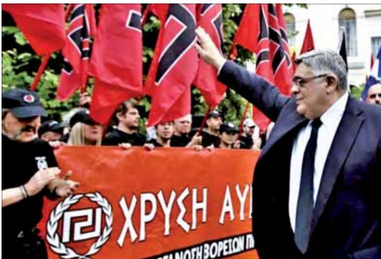
Malý grécky führer Nikos Michaloliakos pred svojimi stúpenkami na verejnosti.

Po dvoch týždňoch bojov Gréci zastavili postup Talianov a postupne ich zatláčali k moru. Podporovala ich svojím letectvom Veľká Británia, ktorá mala záujem zriadiť na gréckom území vojenské základne. Do situácie sa snažil zasiahnuť aj Adolf Hitler, nútil Grékov, aby uzavreli separátny mier s Talianskom. Metaxas lavíroval medzi Berlínom a Londýnom, ale 21. januára 1941 zomrel po prechodení angíny krátko pred nemeckou vojenskou inváziou. (ao)