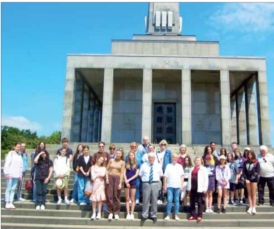
Žiaci seneckých základných škôl na Slavíne.