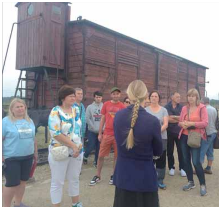
V koncentračnom tábore Auschwitz-Birkenau.

S vierou, že nič z toho, čo sme videli, sa nebude opakovať, sme nasmerovali svoje kroky do Krakova. Mesto rozprestierajúce sa na brehoch rieky Visly návštevníkov rozhodne nesklamalo. Ponúklo na obdiv nielen kráľovský hrad Wawel, ale i ďalšie historické skvosty ako katedrálu, kostoly, sochy, draka chrliaceho oheň, nádherný jantár či dobrú kuchyňu. Záverečný rýchly nákup suvenírov urobil bodku za denným programom. Všetci účastníci obdivuhodne zvládli náročné podujatie, hoci viacerí museli siahnuť hlboko do zásob svojich síl. Tých približne 20-tisíc krokov hovorí za všetko. Odmenou však bol krásny, spoločne strávený deň v priateľskej atmosfére, plný neza-