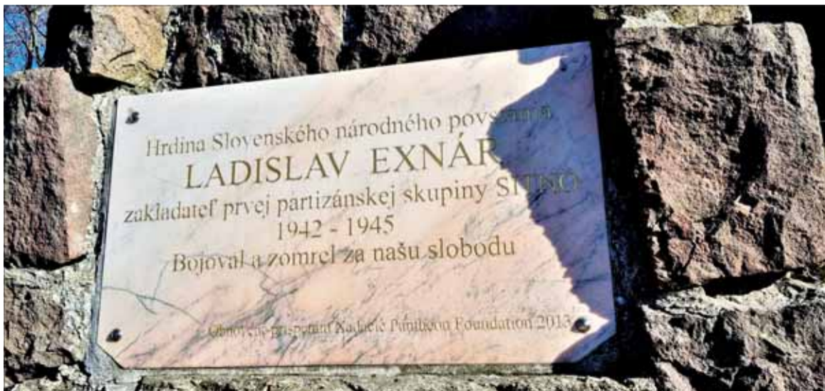
Pamätná tabuľa Ladislavovi Exnárovi pri chate na Sitne.