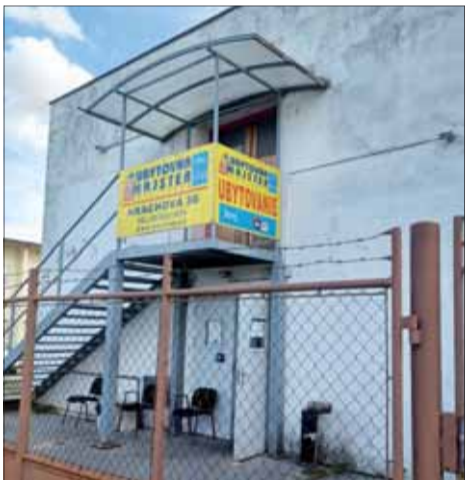
Na Hrachovej 36 je budova ubytovne.

Termín konania VČS vo viedke oznámili na OblV na poslednú chvíľu. Konala sa akurát v deň a hodinu, keď bola na-