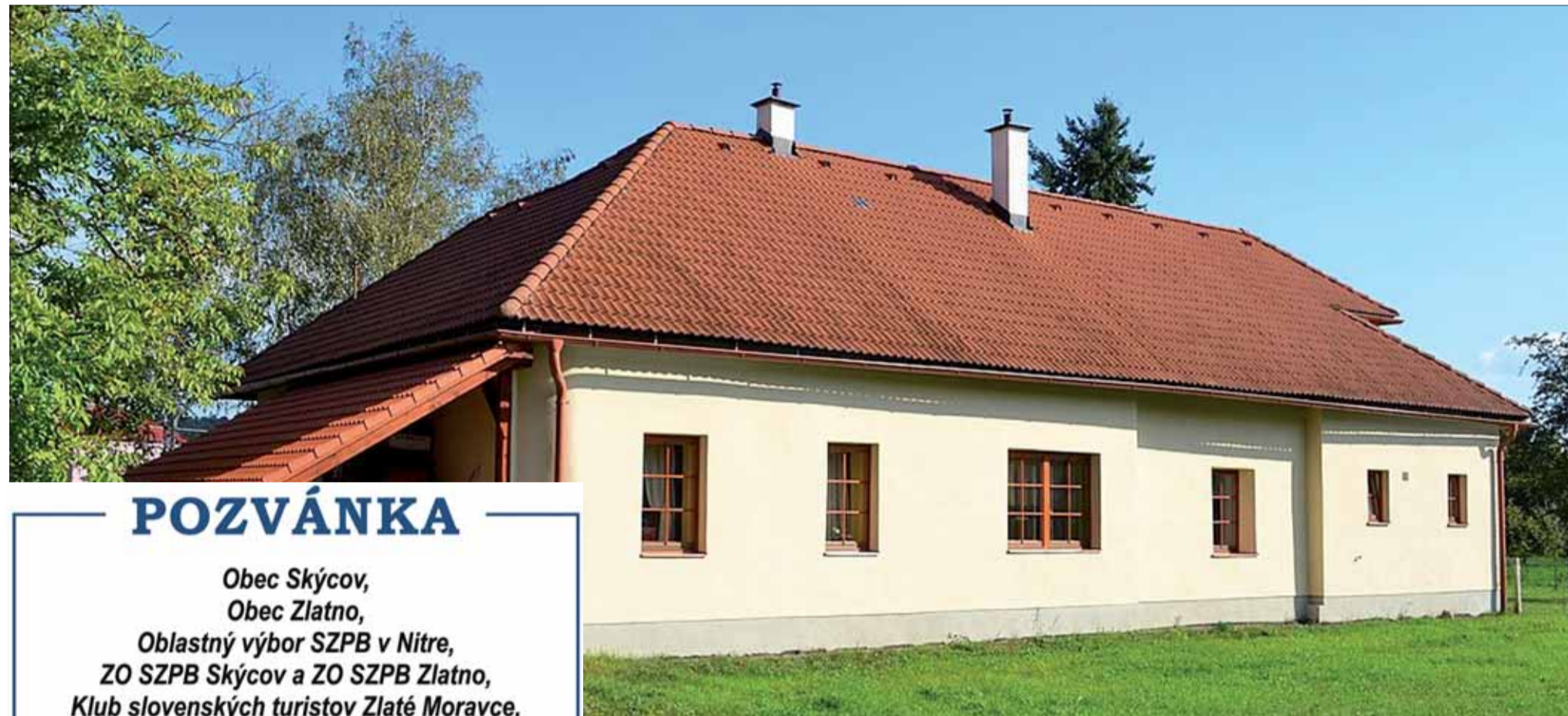
Legendárna evanjelická fara v Hronseku.