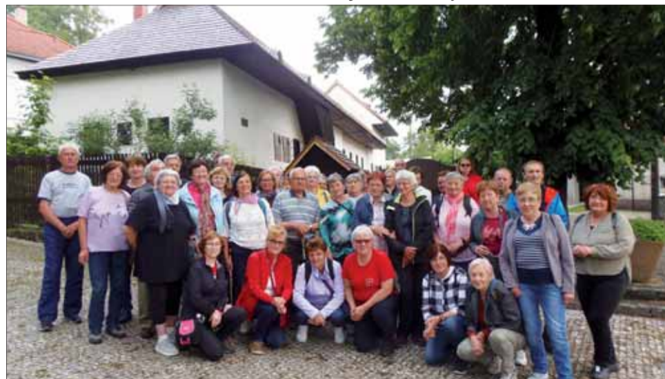
Pred rodným domom Ľ. Štúra a A. Dubčeka v Uhrovci.

Po skončení prehliadky múzea viedla naša cesta práve k mohyle. Položili sme k nej kyticu a uctili si pamiatku padlých partizánov, ktorí bojovali v týchto horách. Zrekonštruované bunkre, hotel Partizán a krása okolitých Strážovských vrchov vzbudila v nás záujem navštíviť tento kraj opäť a podniknúť aj túry po turistických chodníkoch. Treba povedať, že prehánky sa napokon umúdрили a počas výletu nám dokonca zasvietilo slniečko. Dážď, ktorý nás zachytil na spätočnej ceste, určite nepokazil príjemné zážitky z celého dňa.