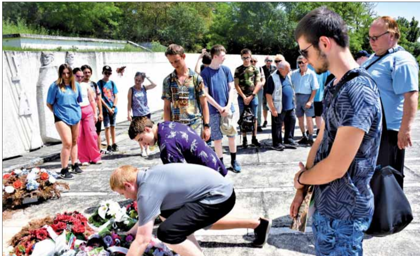
Kladenie venca k pomníku pri Kamíne, kde sa vo februári 1945 odohrala najväčšia tanková bitka na Slovensku.