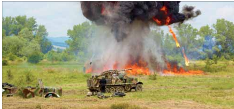
Ukážky bojov na Tankových dňoch Laugaricio.

Mohli sme naďažiť aj na ďalšie ukážky z iných historických období. Na jednom mieste ste tak mohli navštíviť francúzske zákopy 1. svetovej vojny, pozrieť si prácu československých pohraničníkov alebo zažiť atmosféru americkej vojny vo Vietname. Na akcii sme našli aj starove-