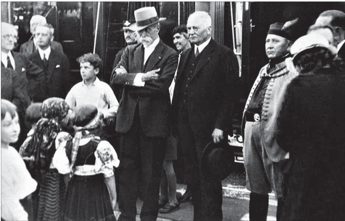
Senátor Národného zhromaždenia Vavro Šrobár na privítaní prezidenta T. G. Masaryka roku 19čč v Trenčianskych Tepličiach, kde bol Šrobár lekárom.