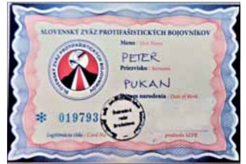
Členský preukaz Petra Pukana držia pod zámokom na OblV SZPB v Nitre.