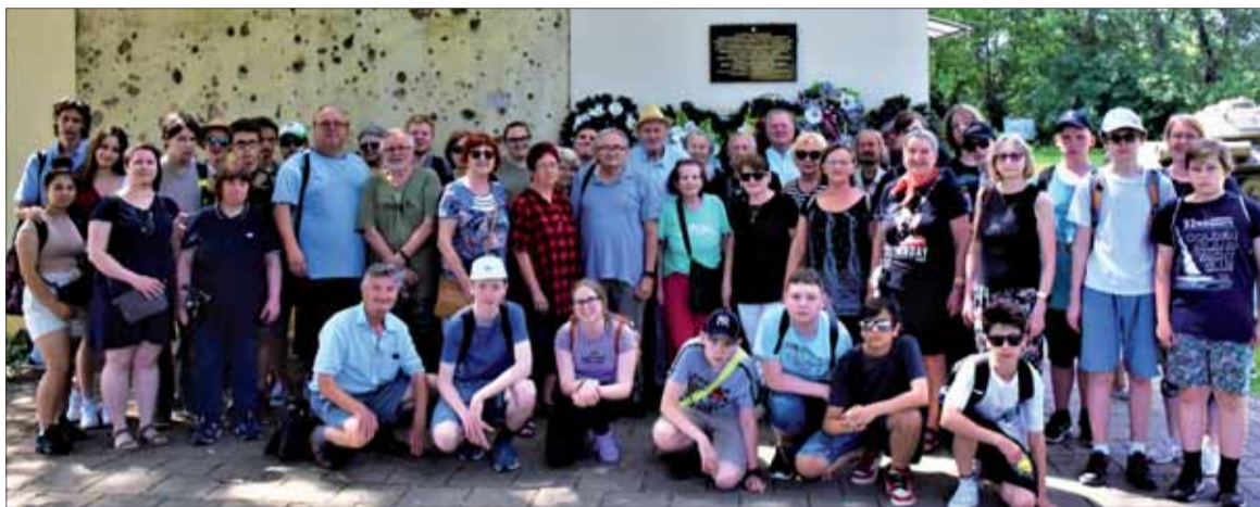
Účastníci poznávacieho zájazdu po dolnom Pohroní pred Domom bojovej sávy v Kalnej nad Hronom.

Tretí tank, na ktorom sa mohli žiaci odfotografovať, je súčasťou pamätníka pri Kameníne. Zimná operačná situácia sa tu vyvinula tak, že na ľavom brehu Hrona sa rozmiestnili nemecké a maďarské vojská, na protíahle sovietske. Tie oslobodili obec 27. marca 1945. „Ulice boli plné mŕtvych vojakov hrdinskej Červenej armády a ich telá sme pocho-