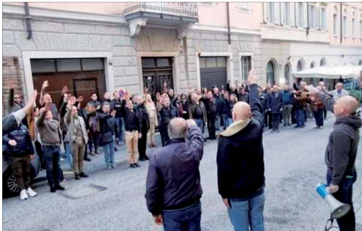
Hajlujúci účastníci spomienky v Terste.

Neofašistické zhromaždenie vzbudilo silný ohlas aj v susednom Slovinsku. Tam ministerstvo zahraničných vecí odsúdilo fašistické pozdravy v Terste a dodalo, že tak ako v minulosti budú na takéto akcie vždy reagovať, najmä ak sú namierené proti slovinskému štátu a jeho občanom.