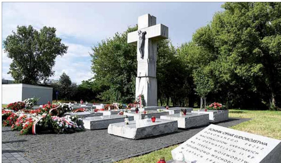
Pomník obetiam volynského masakru vo Varšave.

jenci lepšie chápu, aké dôležité je pre nás nájsť všetky obeť a kresťanský ich pochovať, dať im kríž, zapáliť sviečku a pomodliť sa,“ uviedol Mateusz Morawiecki.