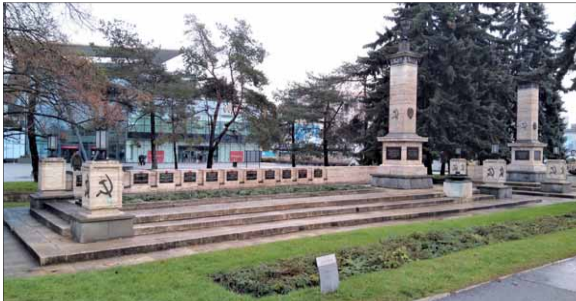
Pamätník červenoarmejcom na Namesti osloboditeľov v Kosiciach.

dezertérov popravili v lese pri Ťahanovciach a divadlo hrôzy predviedli aj na Hlavnej ulici. Nešťastníci, ktorých popravili mali na hrudiach nápisy Som zbeh, Komunista, Žid, Parti-