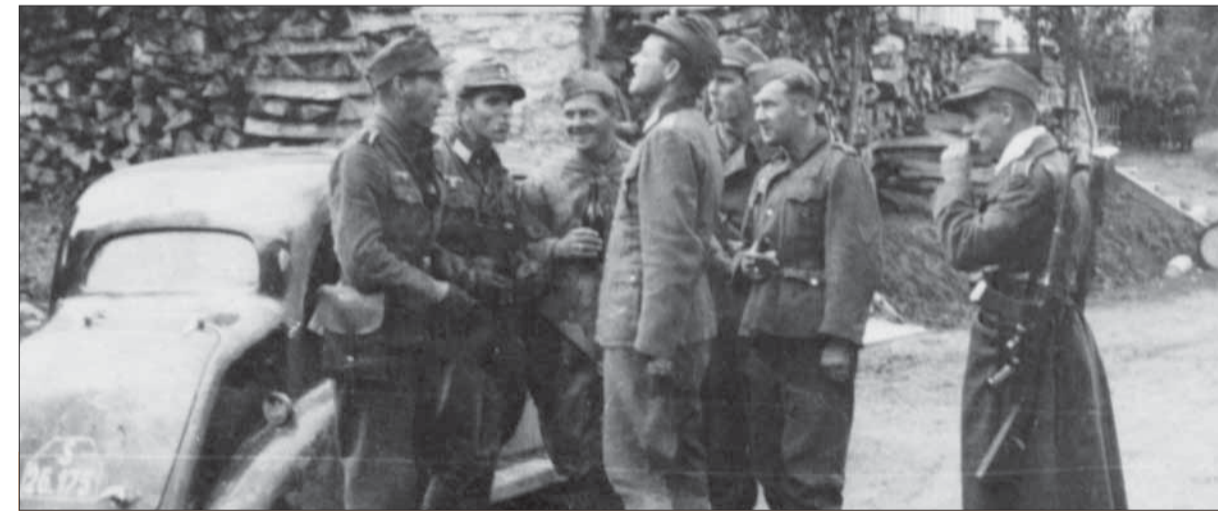
Členovia špeciálnej protipartizánskej jednotky Stíhací zväz Juhovýchod – Stíhacia skupina Slovensko s krycím názvom Jozef.

Abwehrgruppe 218 – Edeiweiss bola jednou z mnohých výkonných pák fašistického teroru na