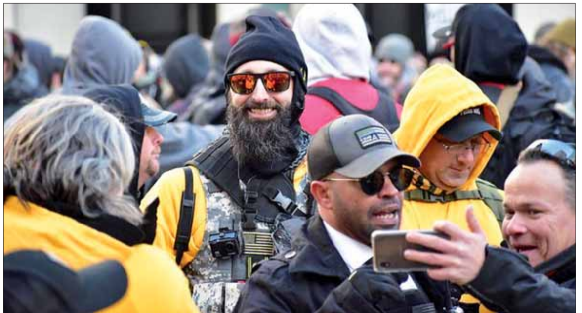
Proud Boys v akcii – Enrique Tarrío v šiltovke a slnečných okuliaroch.

To však, bohužiaľ, nebolo naposledy, čo o sebe táto skupina dala v roku 2020 vedieť. Príslušníci Proud Boys 12. decembra 2020 napadli historicky najstarší černošský kostol vo Washingtone D.C., z ktorého strhli ceduľu Black Lives Matter a následne ju spálili, pričom rukami ukazovali symboly bielej nadradenosti. Práve kvôli tejto výtržnosti bol zatknutý líder hnutia Henry „Enrique“ Tarrío (prekvapivo ku-