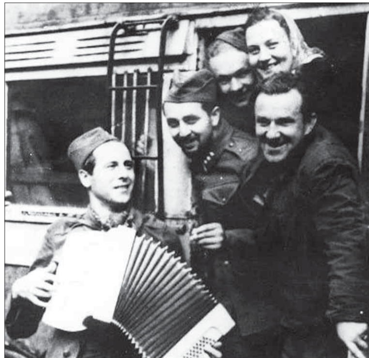
Cveková v chustočke – šatke, členovia Frontového divadla – s harmonikou F. Zvarík.

bárkou. Poznali sme ju ako dôstojnú ženu, aj napriek veku, plnú energie.